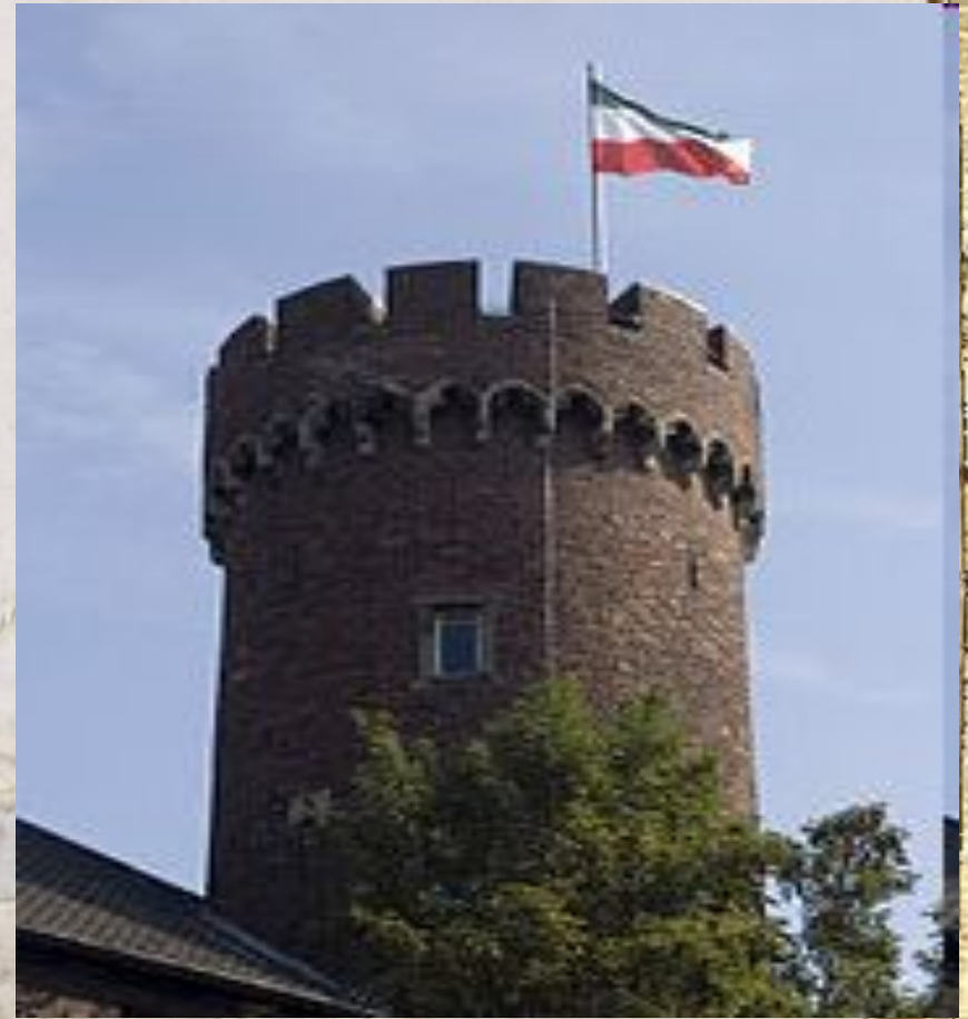
Донжон Кемпенского замка, (Северный Рейн- Вестфалия)