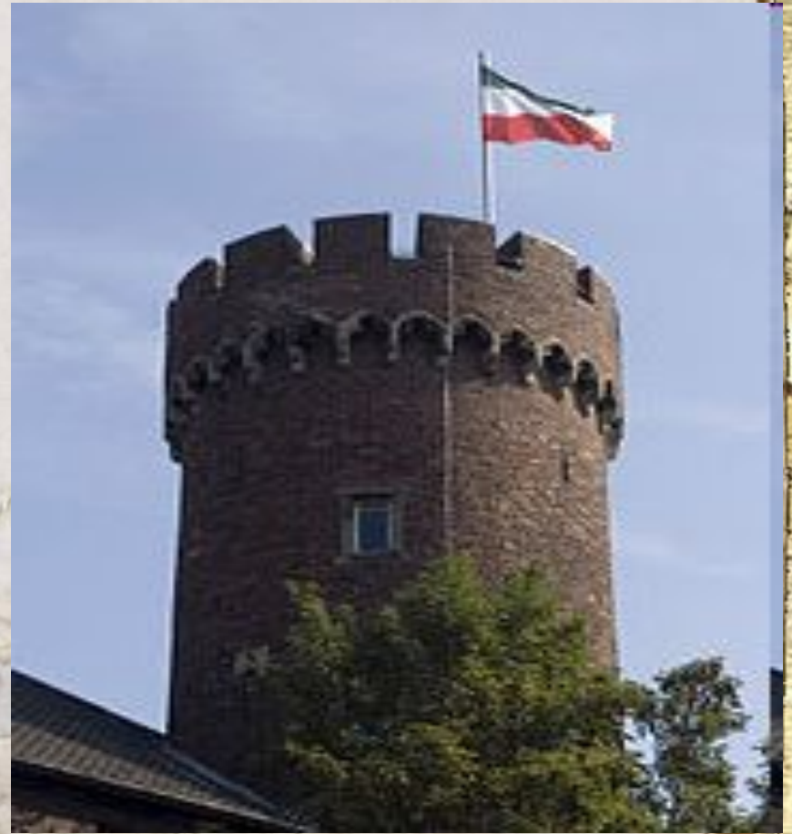
Донжон Кемпенского замка, (Северный Рейн- Вестфалия)