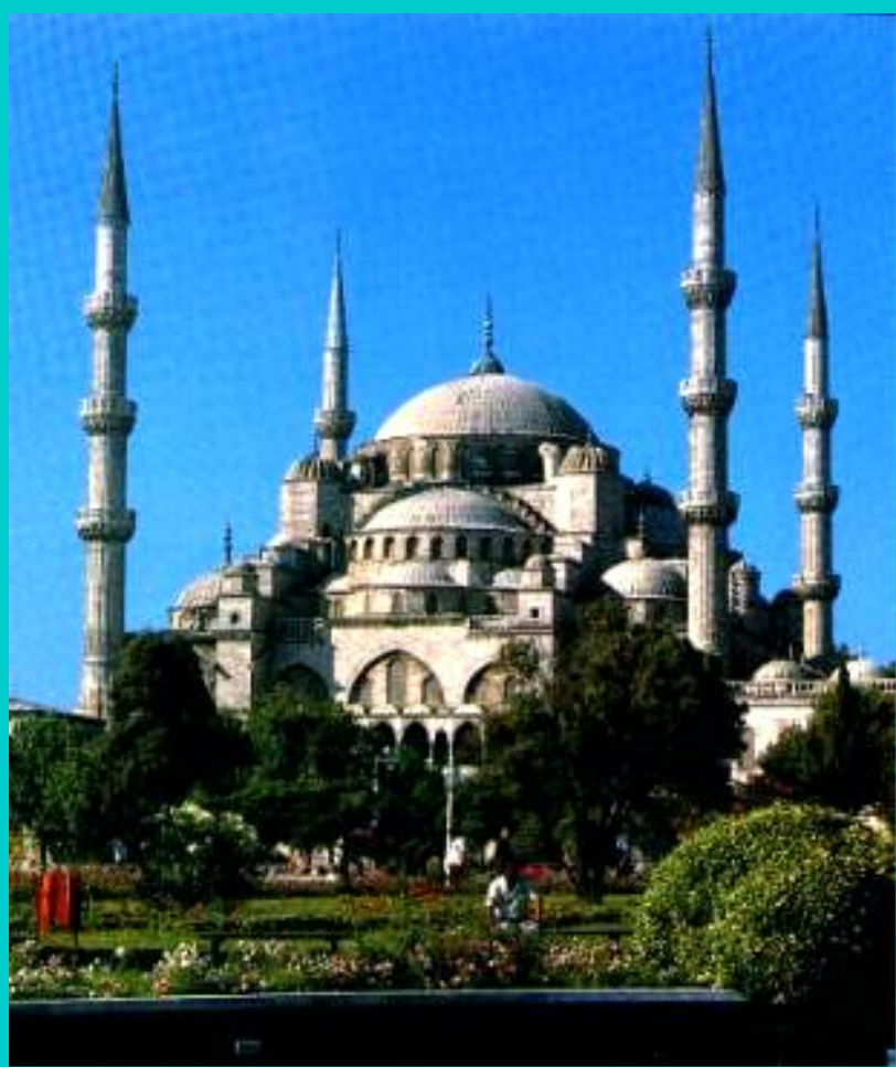
«Голубая мечеть» в Стамбуле.

Арабы создали оригинальную архитектуру. В городах сооружались мечети, которые были не только молитвенным домом, но и клубом, хранилищем денег