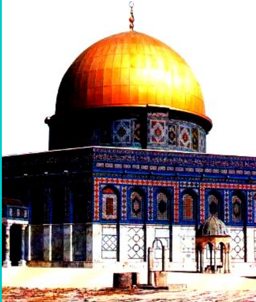
Храм «Купол Скалы» в Иерусалиме.

Снаружи храмы украшались узорами из затейливо переплетенных линий - арабесками .