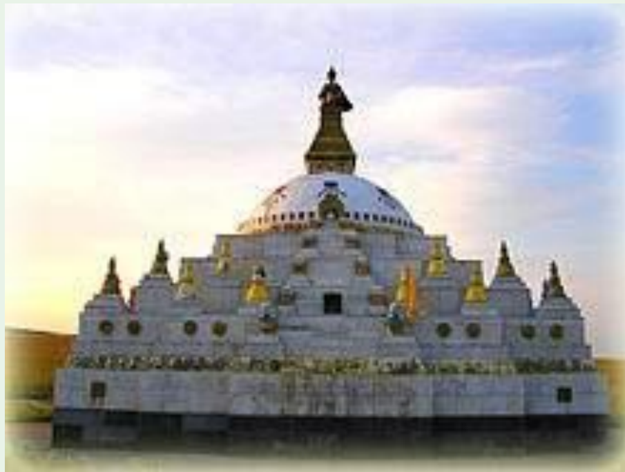
Самая Джарун Хашор, Кижингинский район Бурятии