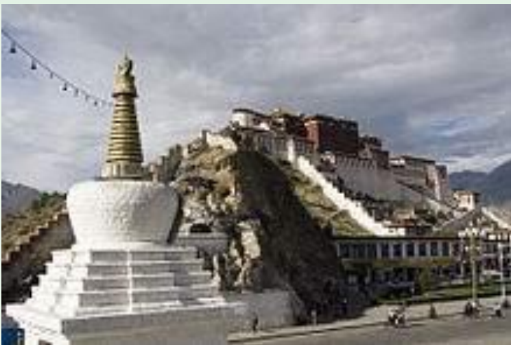
Ступа в Лхасе, (на фоне дворца Потала)