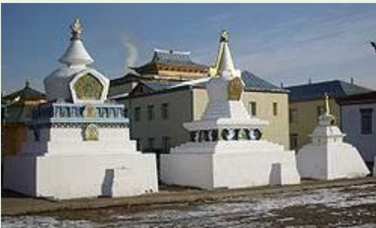
Субурганы Иволгинского дацана ( республика Бурятия)