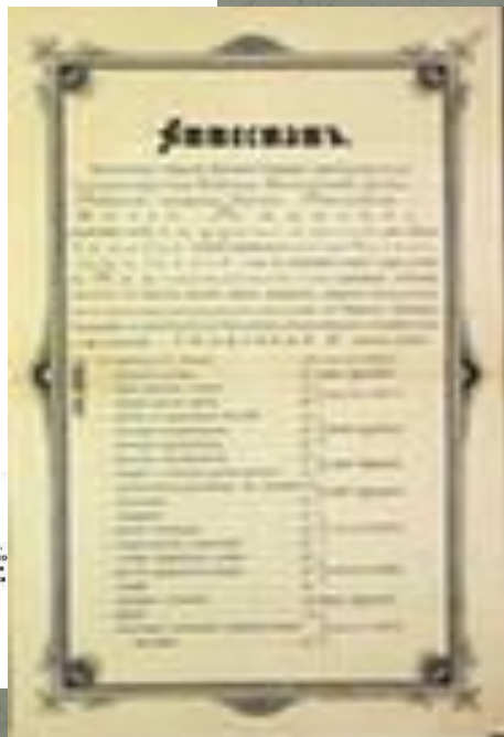
Рис. роко слав Буш