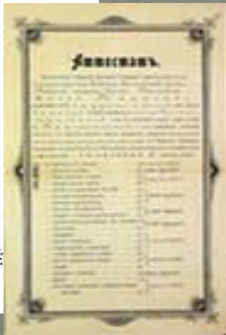
Рис. рукопись Бухи