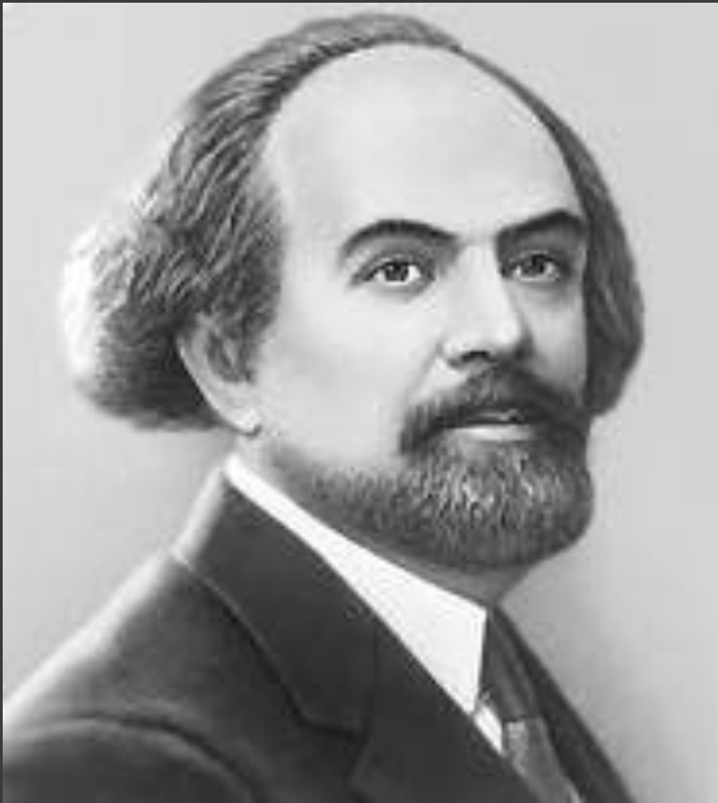
Бердяев Н.А. «Конец Европы»

Первые десятилетия XX в. – ощущения кризиса и распада окружающего мира.