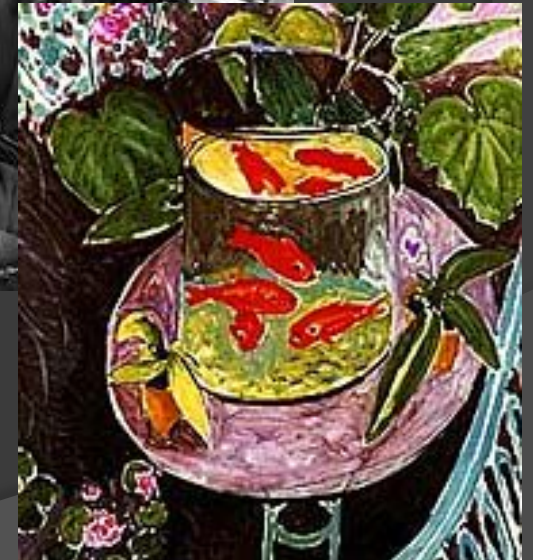
А. МАТИСС «КРАСНЫЕ РЫБКИ»