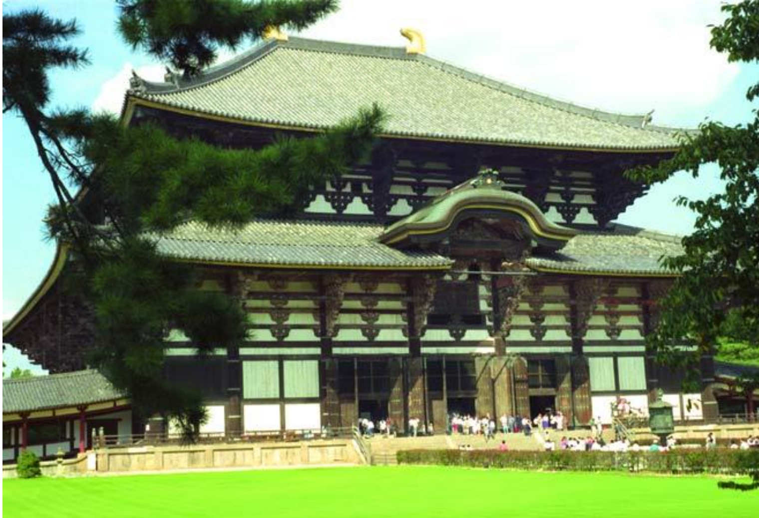
Монастырь Тодайдзи. Зал Большого Будды