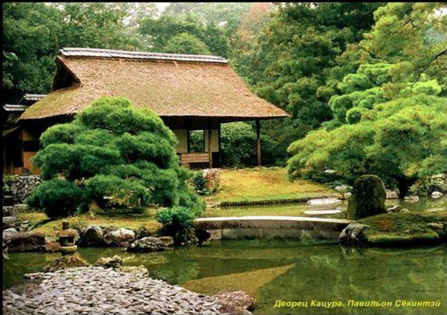
Дворец Кацура. Павильон Сёкинтэй