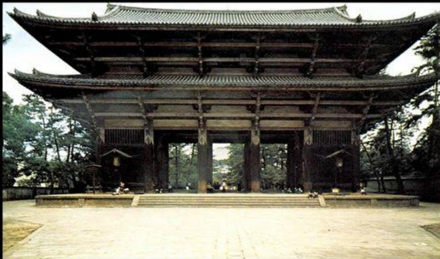
Ворота Нандаймон в ансамбле Тодайдзи