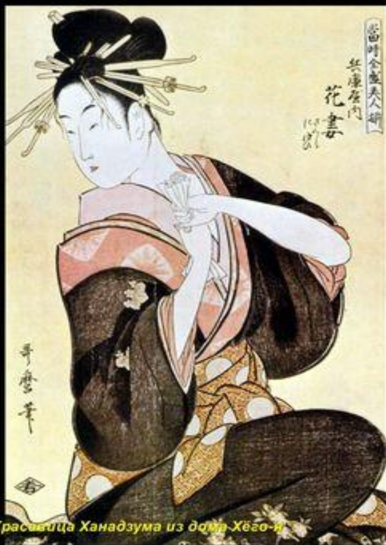
Китагава Утамаро: Красавица Ханадзума из дома Хёго-и