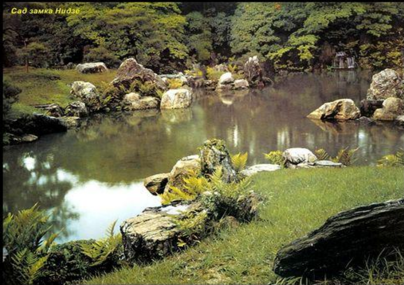
Сад замка Нидзё