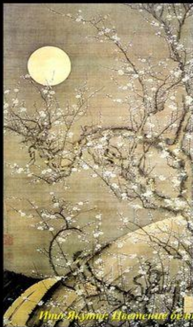
Ито Якуто: Цветение белой сливы в лунную ночь