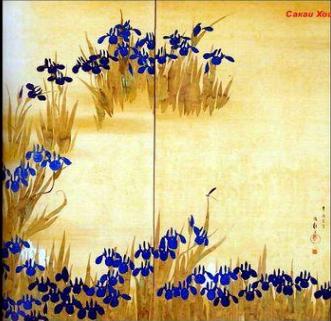
Сакаи Хонсю: Ирисы