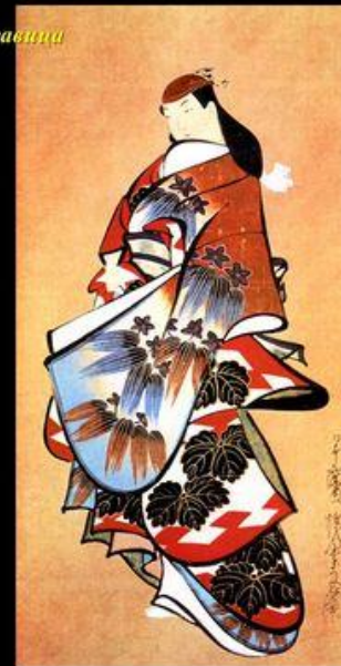
Кайгэцудо Досин: Красавица