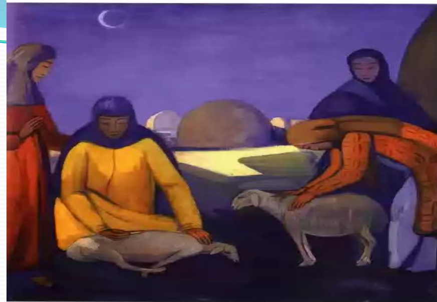
ЖИВОПИСЬ. РУБЕЖ XIX И XX ВЕКОВ