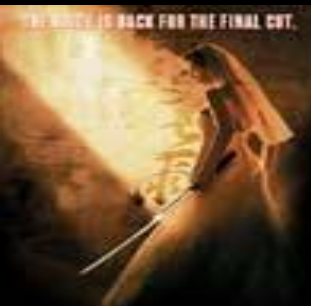
Убить Билла 2 (Kill Bill: Vol. 2)