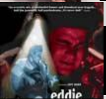
Эдди Прэсли ( Eddie Presley )