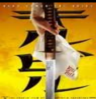
Убить Билла (Kill Bill: Vol. 1)