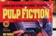
Криминальное чтиво (Pulp Fiction)