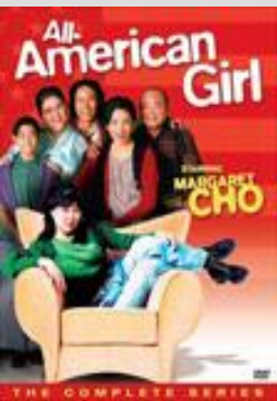
Американская девушка (All-American Girl)