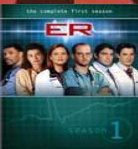
Скорая помощь (ER)