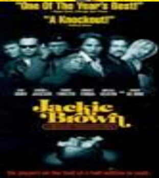
Джеки Браун (Jackie Brown)