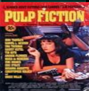
Криминальное чтиво (Pulp Fiction)