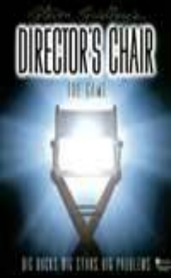
Режиссерское кресло Стивена Спилберга (Steven Spielberg's Director's Chair)