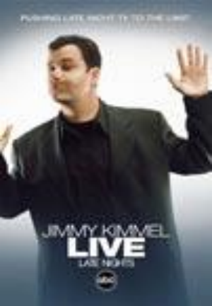
Джимми Киммель в прямом эфире (Jimmy Kimmel Live)