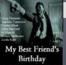
День рождения моего лучшего друга ( My Best Friend's Birthday )

Пародия на Элвиса ( Elvis Impersonator )