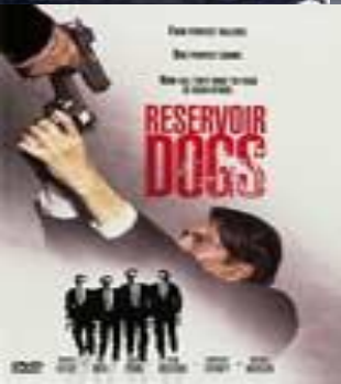
Башенные псы (Reservoir Dogs)