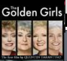
Золотые девушки ( The Golden Girls ) (сериал)