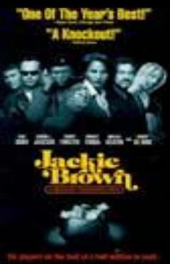
Джеки Браун (Jackie Brown)