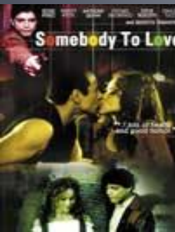
Любить кого-то (Somebody to Love)