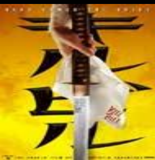
Убить Билла (Kill Bill: Vol. 1)