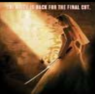
Убить Билла 2 (Kill Bill: Vol. 2)