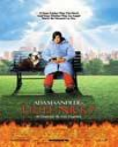
Никки, дьявол-младший (Little Nicky)