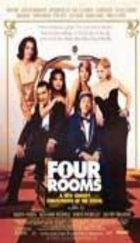
Четыре комнаты (Four Rooms)