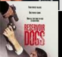
Бешеные псы (Reservoir Dogs)