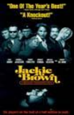
Джеки Браун (Jackie Brown)