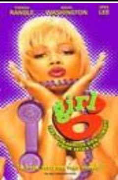
Девушка номер 6 (Girl 6)