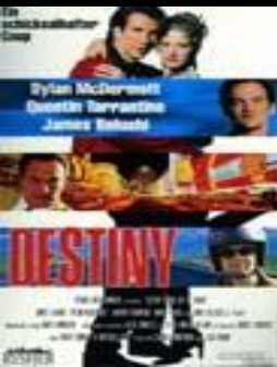
Дестини включает радио (Destiny Turns on the Radio)