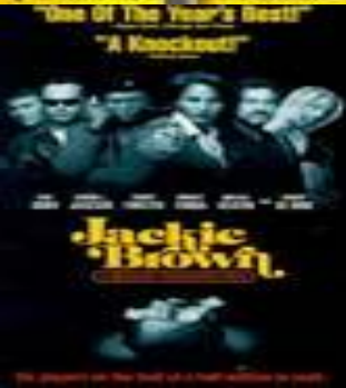
Джеки Браун (Jackie Brown)