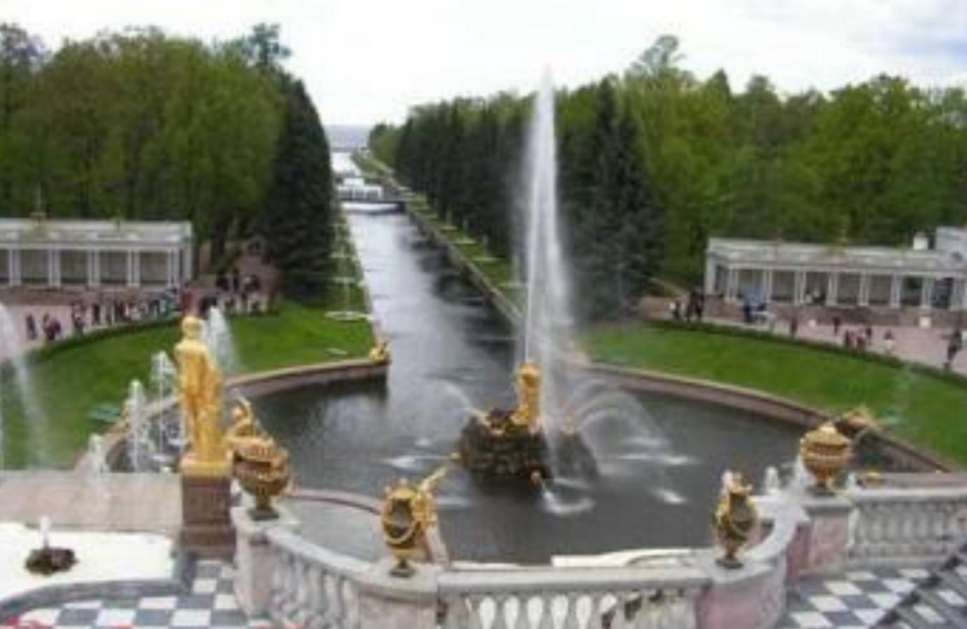
Садово-парковый ансамбль в Петергофе. 2006 год