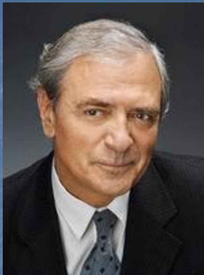
ЛАЗАРЕВ Александр Сергеевич 03.01.1938, Ленинград - 02.05.2011, Москва