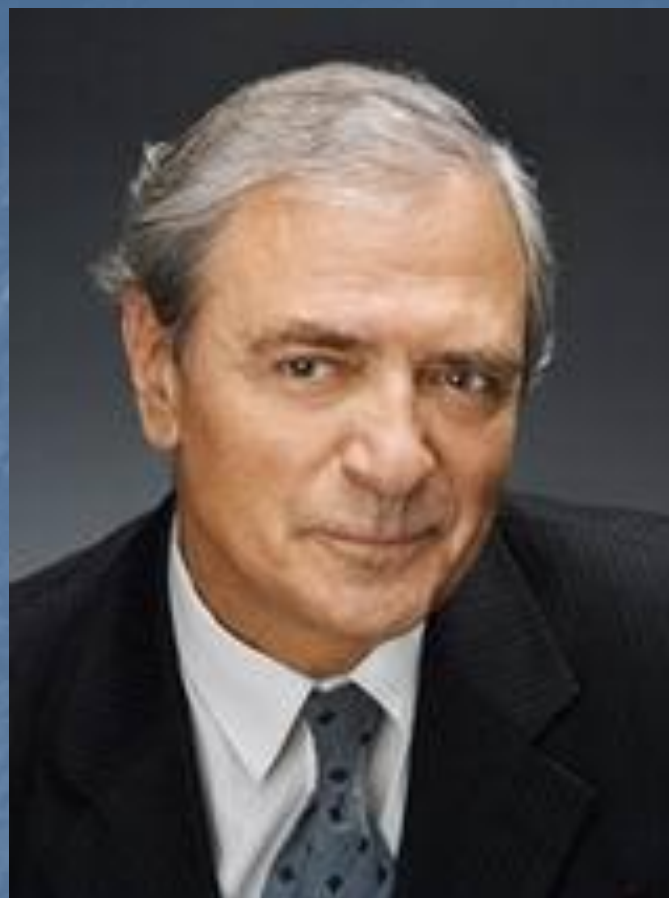
ЛАЗАРЕВ Александр Сергеевич 03.01.1938, Ленинград - 02.05.2011, Москва