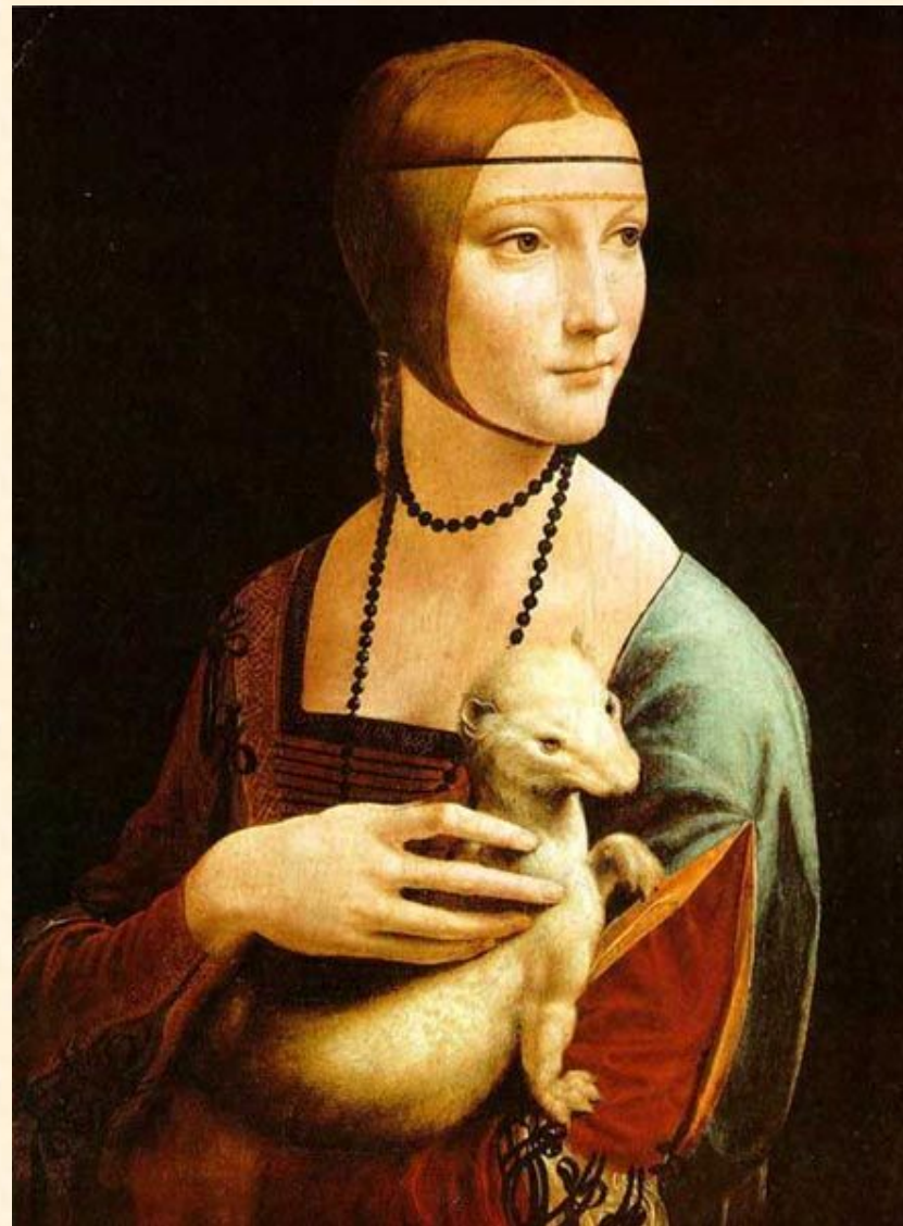
Дама с горностаем около 1485 г

Установлено, что на этой картине, написанной в необыкновенно изящной манере изображена Цецилия Гальерани. Картина находится в музее Чарторыйских в Кракове.