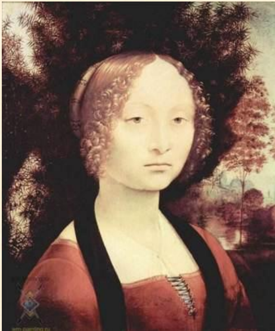
Портрет Джиневры ди Медичи 1474-1476 г.г.

Художник изобразил портрет на фоне кустов можжевельника, а на итальянском языке можжевельник - "ginero", что звучит почти так же, как и имя сеньоры - Джиневра. Творения Леонардо привлекательны и выдающиеся скрытыми в них загадочными реальными и вымышленными намеками. Джиневра ди Бенчи, будто живая, сама предстает не на холсте, а наяву.