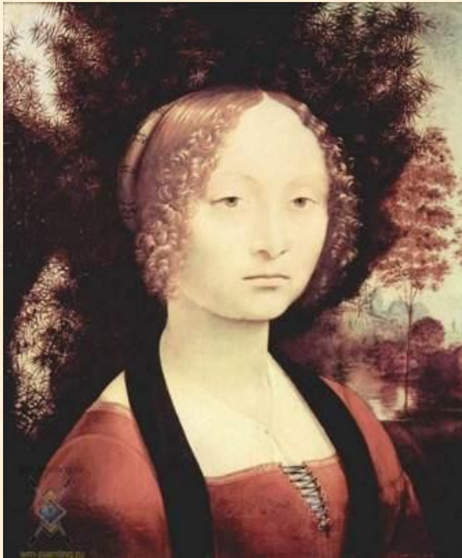
Портрет Джиневры ди Медичи 1474-1476 г.г.

Художник изобразил портрет на фоне кустов можжевельника, а на итальянском языке можжевельник - "ginero", что звучит почти так же, как и имя сеньоры - Джиневра. Творения Леонардо привлекательны и выдающиеся скрытыми в них загадочными реальными и вымышленными намеками. Джиневра ди Бенчи, будто живая, сама предстает не на холсте, а наяву.