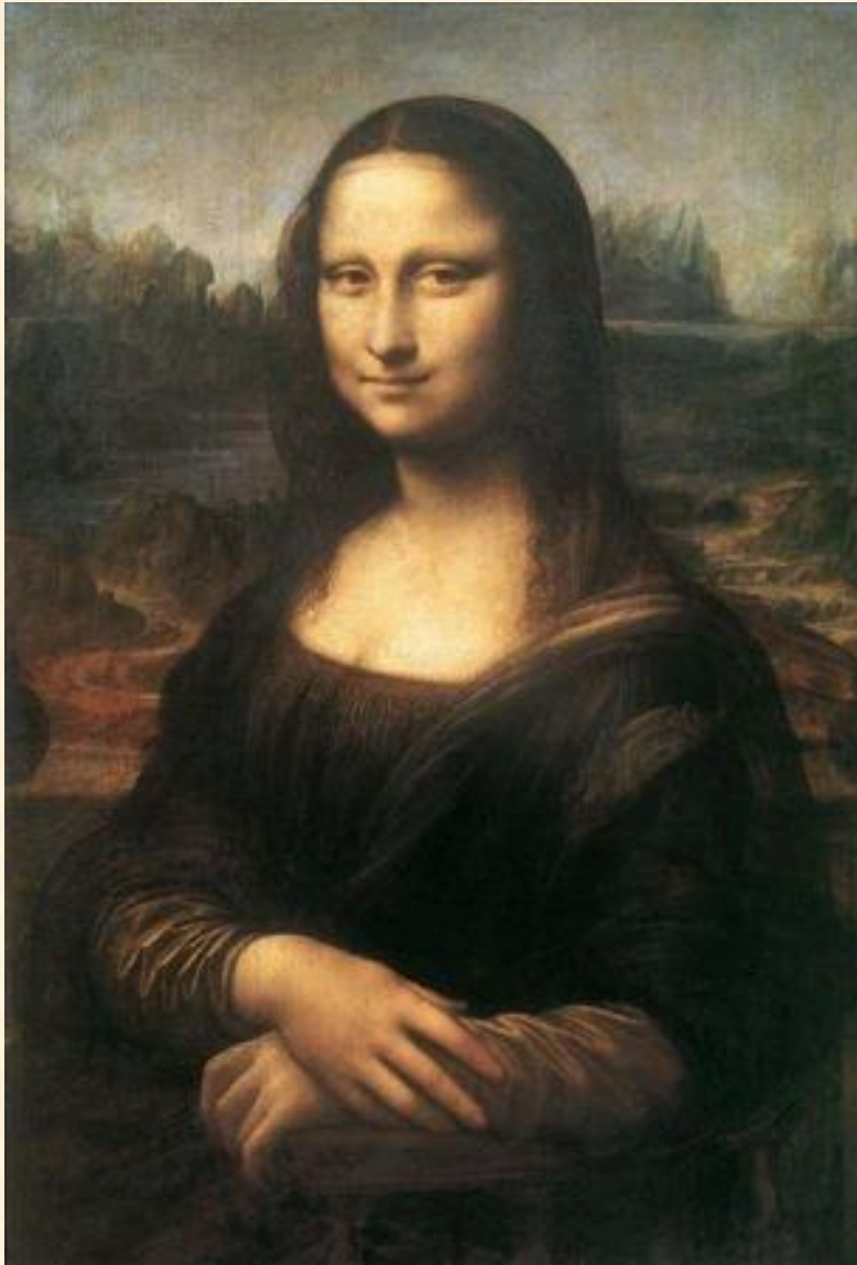
Портрет Моны Лизы 1514 – 1515 г.г.

Да Винчи создал шедевр мировой живописи «Мону Лизу». Леонардо прибег к следующему приему: так как мадонна Лиза была очень красива, то во время писания портрета он держал людей, которые играли на лире или пели, и тут постоянно были шуты, поддерживавшие в ней веселость и удалявшие меланхолию, которую обычно сообщает живопись выполняемым портретам.