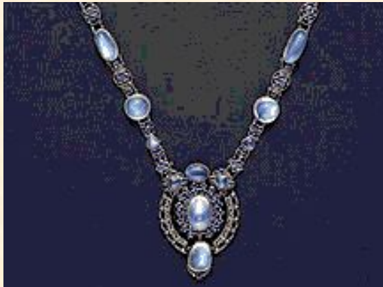
Ожерелье с кулоном. 1910. Платина, сапфиры, лунный камень.