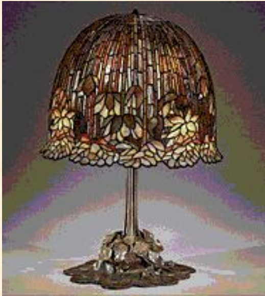
Настольная лампа «Водяные лилии» 1904-1915. Стекло фавриль, бронза.