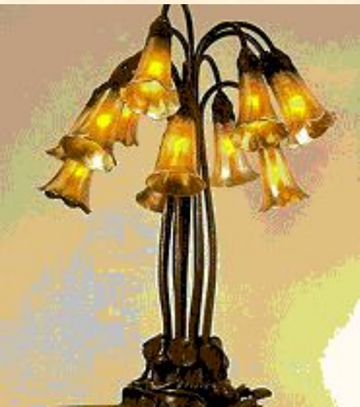
Лампа Тиффани в стиле «ар нуво», получившая название «Десять лилий»