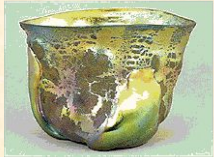
Чаша из стекла «фавриль». 1908.