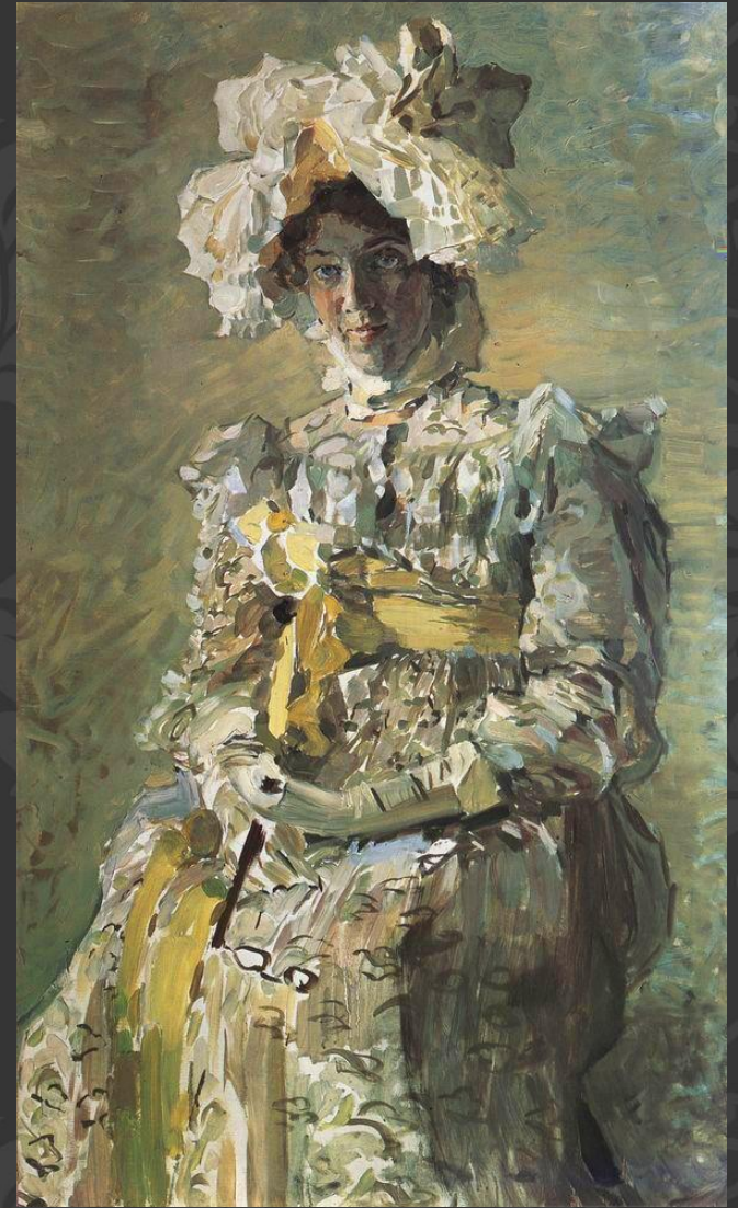
Портрет жены Н. И. Забелы-Врубель