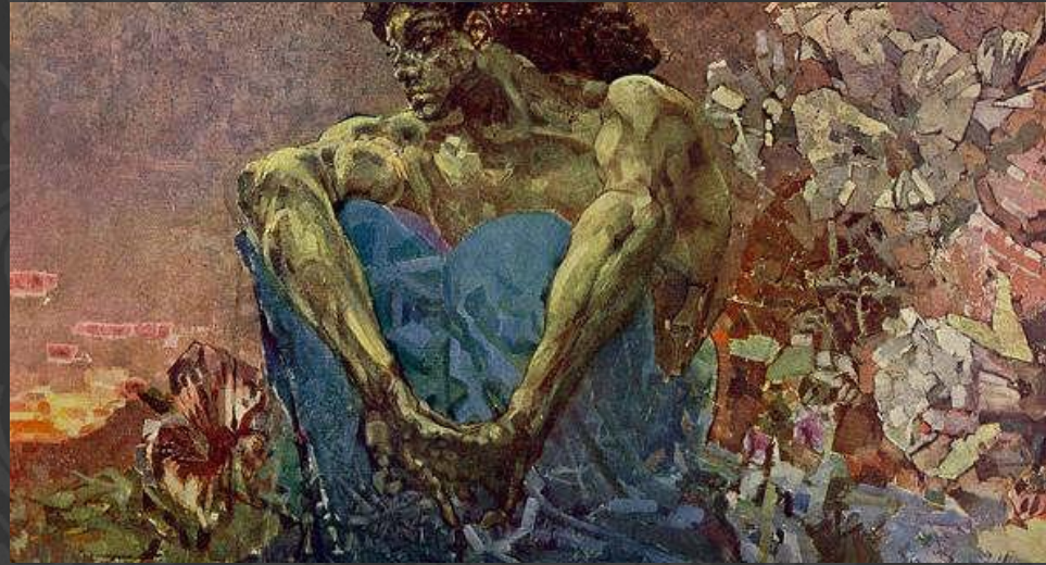
Голова демона на фоне гор