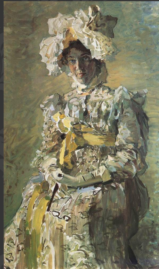
Портрет жены Н. И. Забелы-Врубель