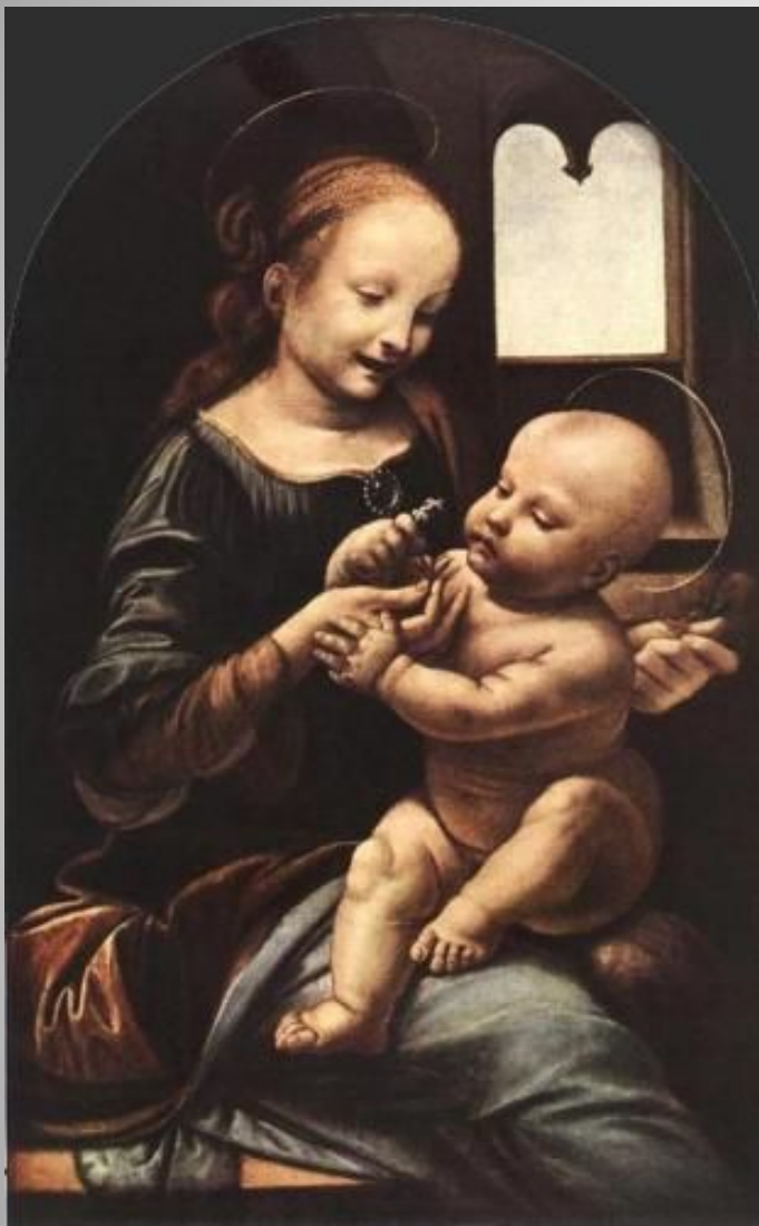
Леонардо да Винчи «Мадонна с Младенцем»