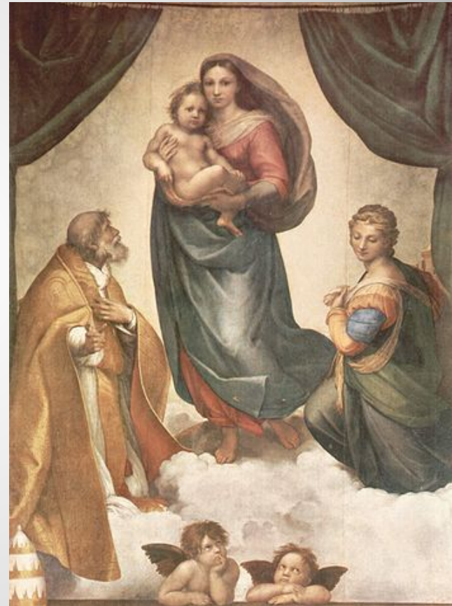
«Сикстинская Мадонна» Рафаэль