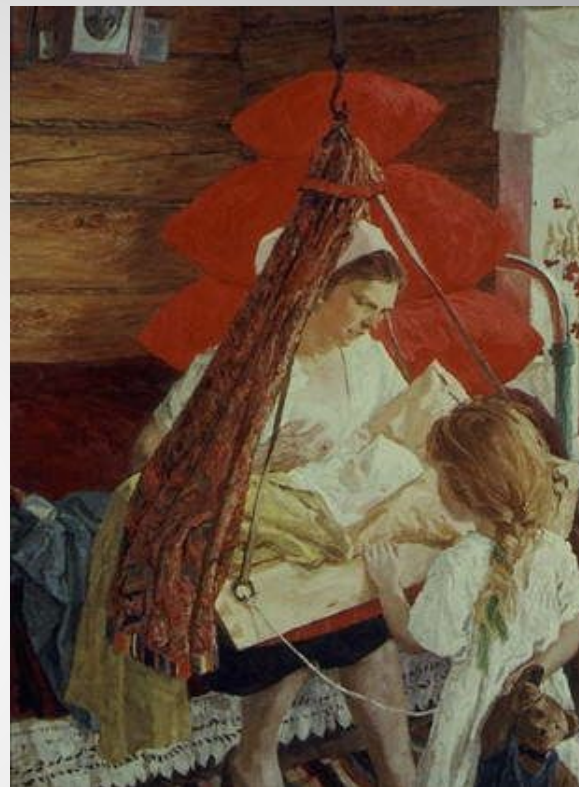
Пластов Аркадий Александрович: Мама