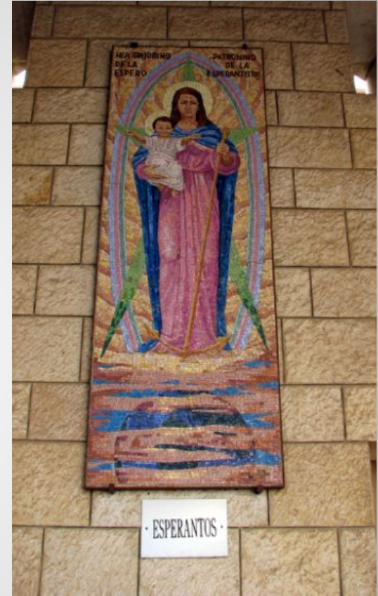
Назарет. Храм Благовещения