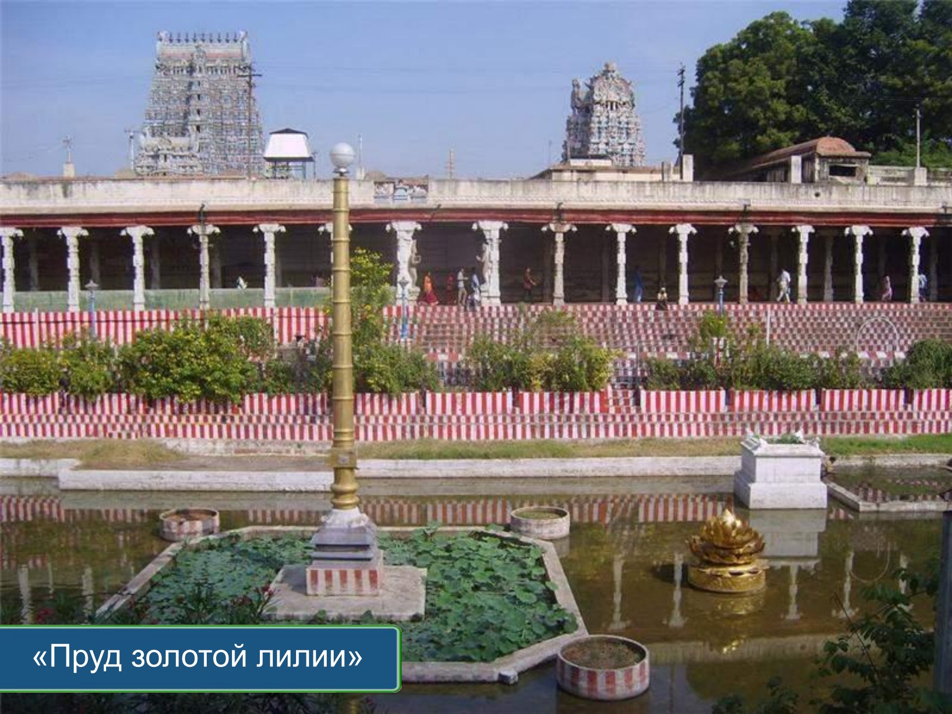
«Пруд золотой лилии»