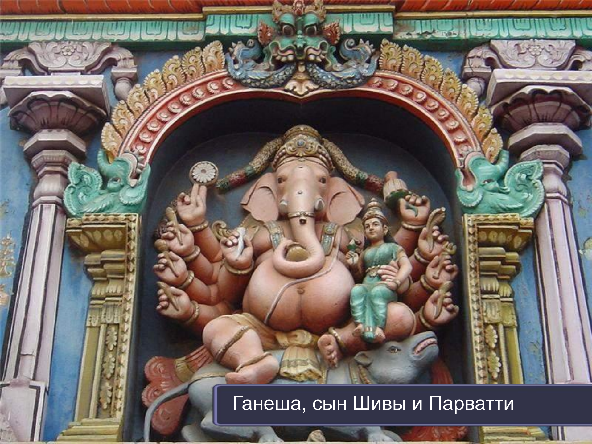
Ганеша, сын Шивы и Парватти