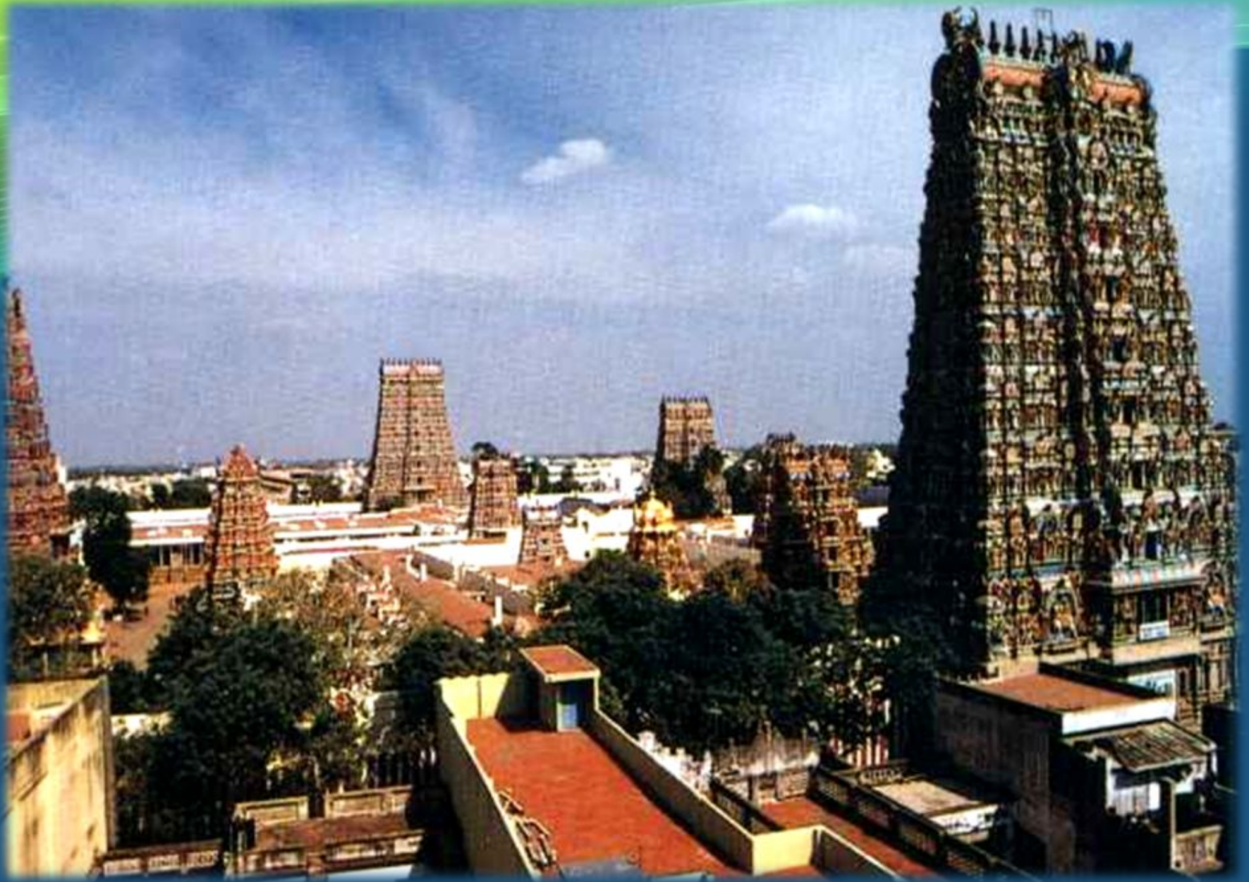
(Мадурай) – (மதுரை) — старейший существующий поныне город на полуострове Индостан.