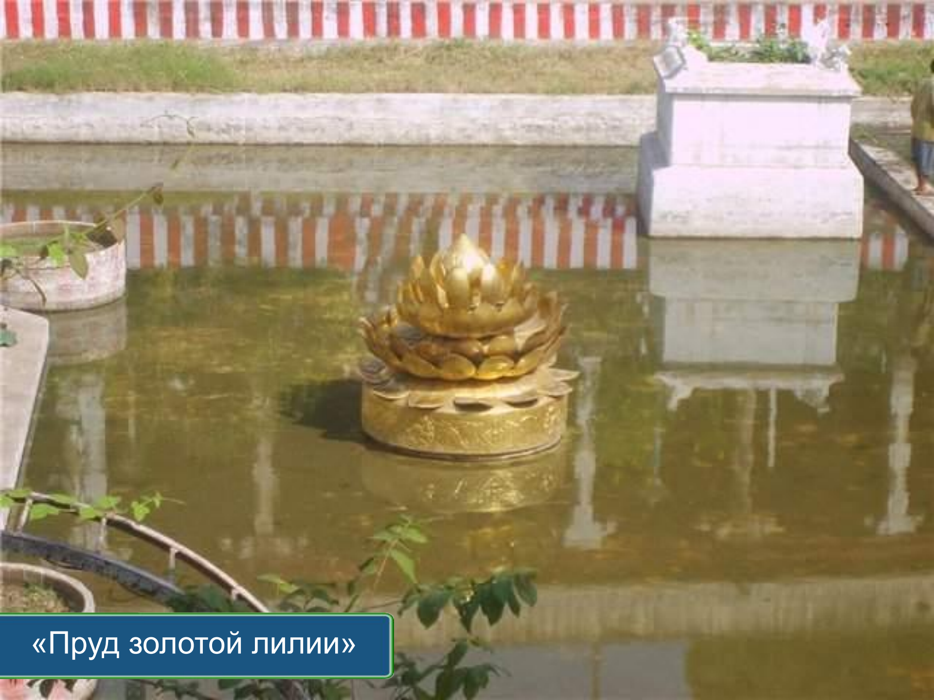
«Пруд золотой лилии»