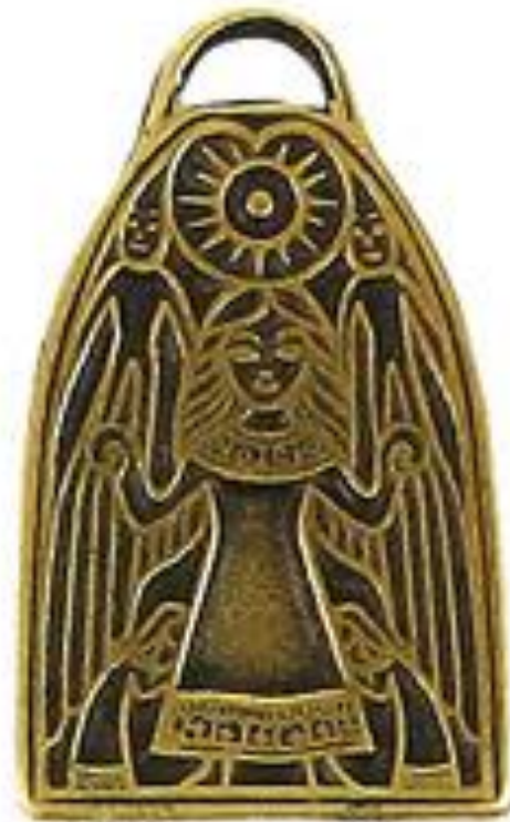
Металлический амулет мать Макошь