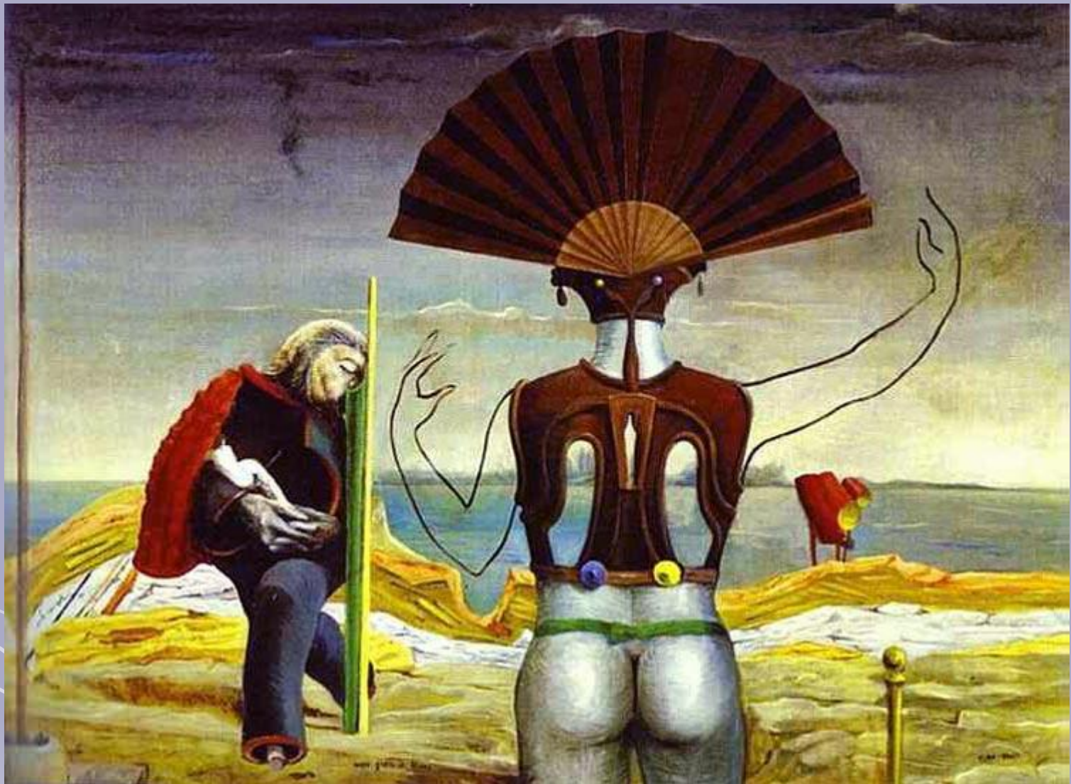
Женщина, старик и цветок, 1924