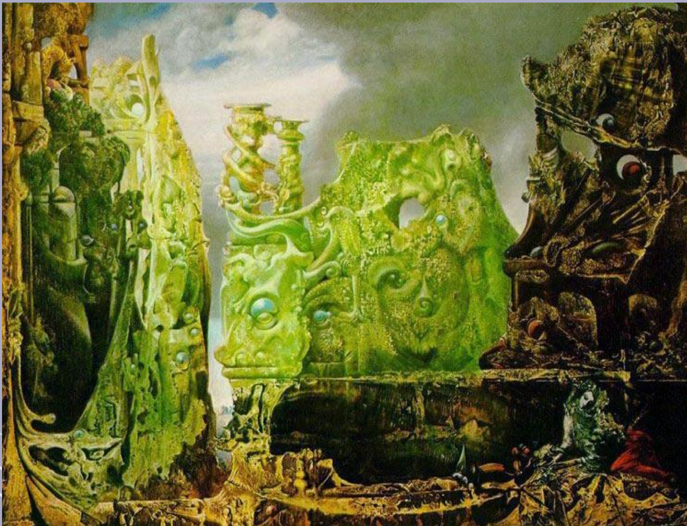
Око безмолвия, 1943-1944.