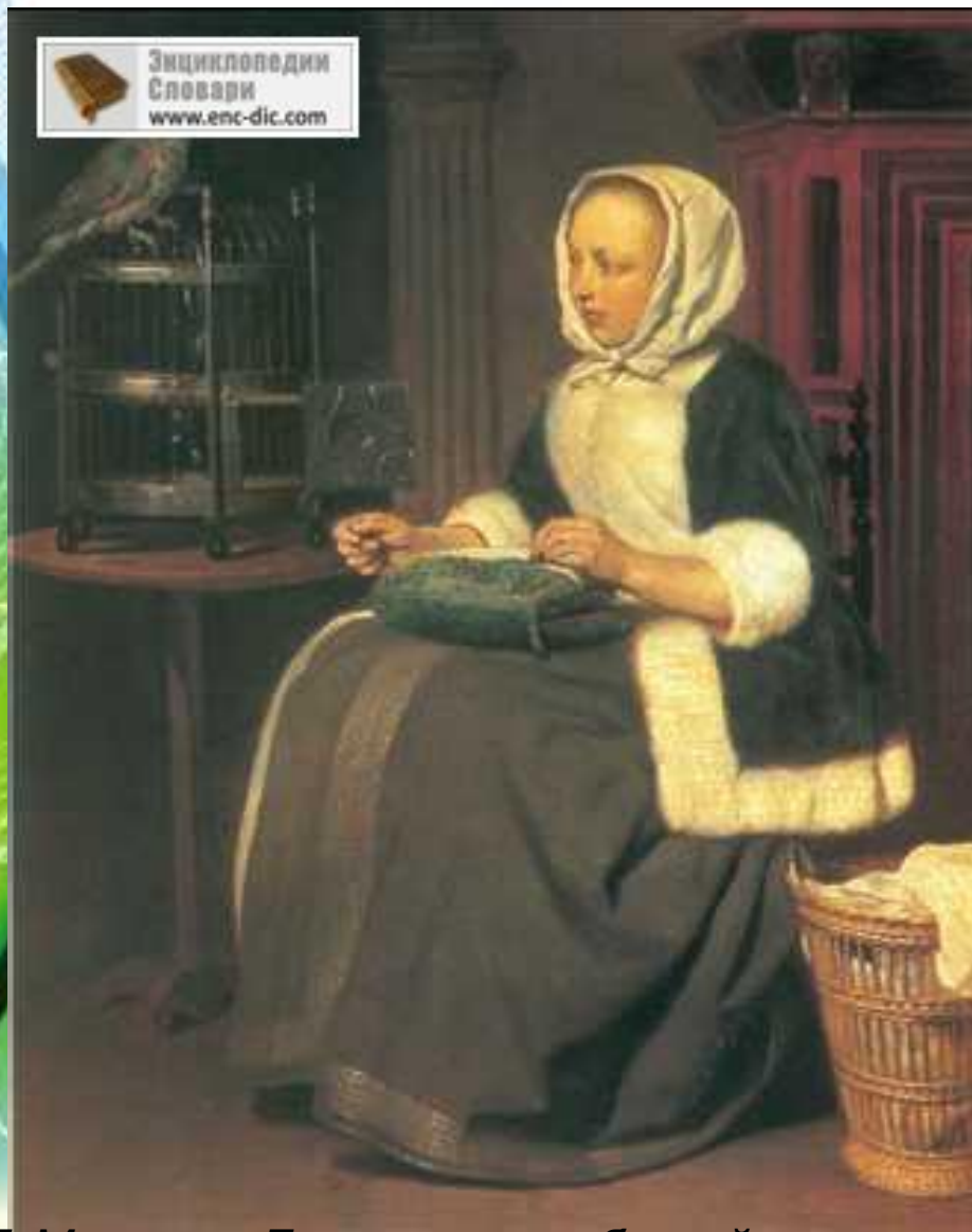
Г. Метсю. «Девушка за работой». Государственный музей изобразительных искусств им. А. С. Пушкина. Москва