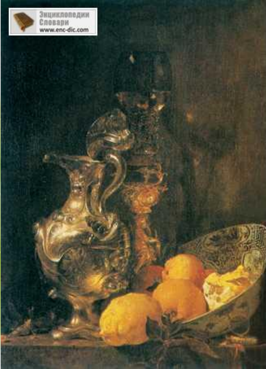
В. Калф. «Натюрморт». 1643 г. Рейксмузеум. Амстердам