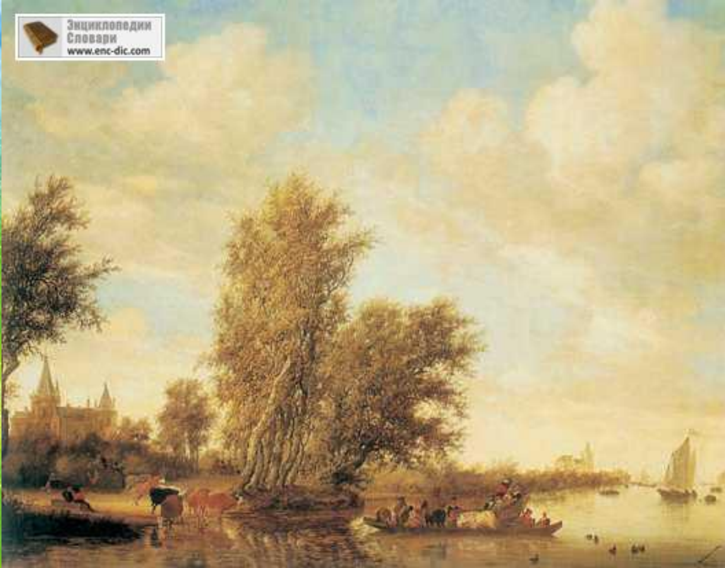
Я. ван Гойен. «Речной пейзаж». 1631 г.