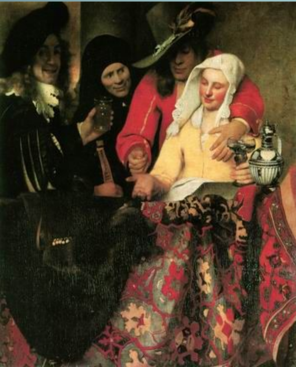
У сводни. 1656

1656 году написал первую жанровую картину «У сводни» (Дрезден, Картинная галерея). В приемах крупномасштабной композиции с высоким горизонтом и фигурами в натуральную величину художник сохранил традицию голландских последователей Караваджо, работавших в Утрехте в начале XVII столетия. Тема продажной любви, подчас с оттенком морализирования, получила широкое распространение в голландской жанровой живописи. В картине уже ощущается столь отличающее его творчество стремление к простоте, ясности, отточенности образа. Четыре фигуры, тесно заполняющие полотно, неразрывно связаны между собой. Пьяный кавалер в ярко-киноварной куртке и съехавшей набок шляпе грубо обнимает миловидную слегка захмелевшую девушку и кладет в ее открытую ладонь сияющую золотую монету. Слева музыкант с лютней в старинном черно-белом костюме — обязательный персонаж празднеств и попок. Выглядывающая из-за плеча кавалера старуха-сводня в черном платке с быстрым, алчным и полным любопытства взглядом охарактеризована живо и вместе с тем сдержанно, без малейшего шарживания. Используя интенсивный цветовой контраст широких плоскостей ярко-красного, лимонно-желтого, белого, зеленого и черного, художник обнаруживает свой редкий декоративный дар. Но в творчестве Вермера этот новый тип жанровой композиции оказался единственным.