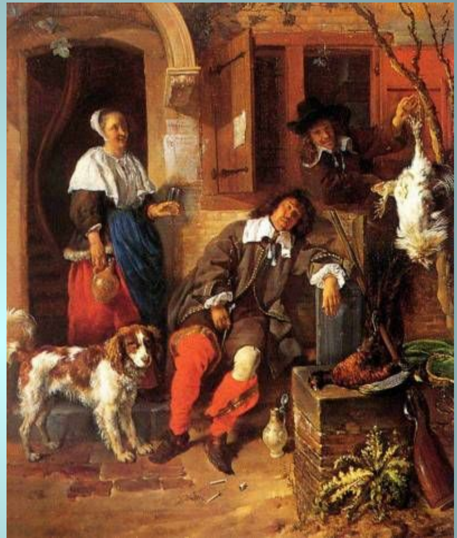
Спящий спортсмен. 1657-1659г.г. Метсю