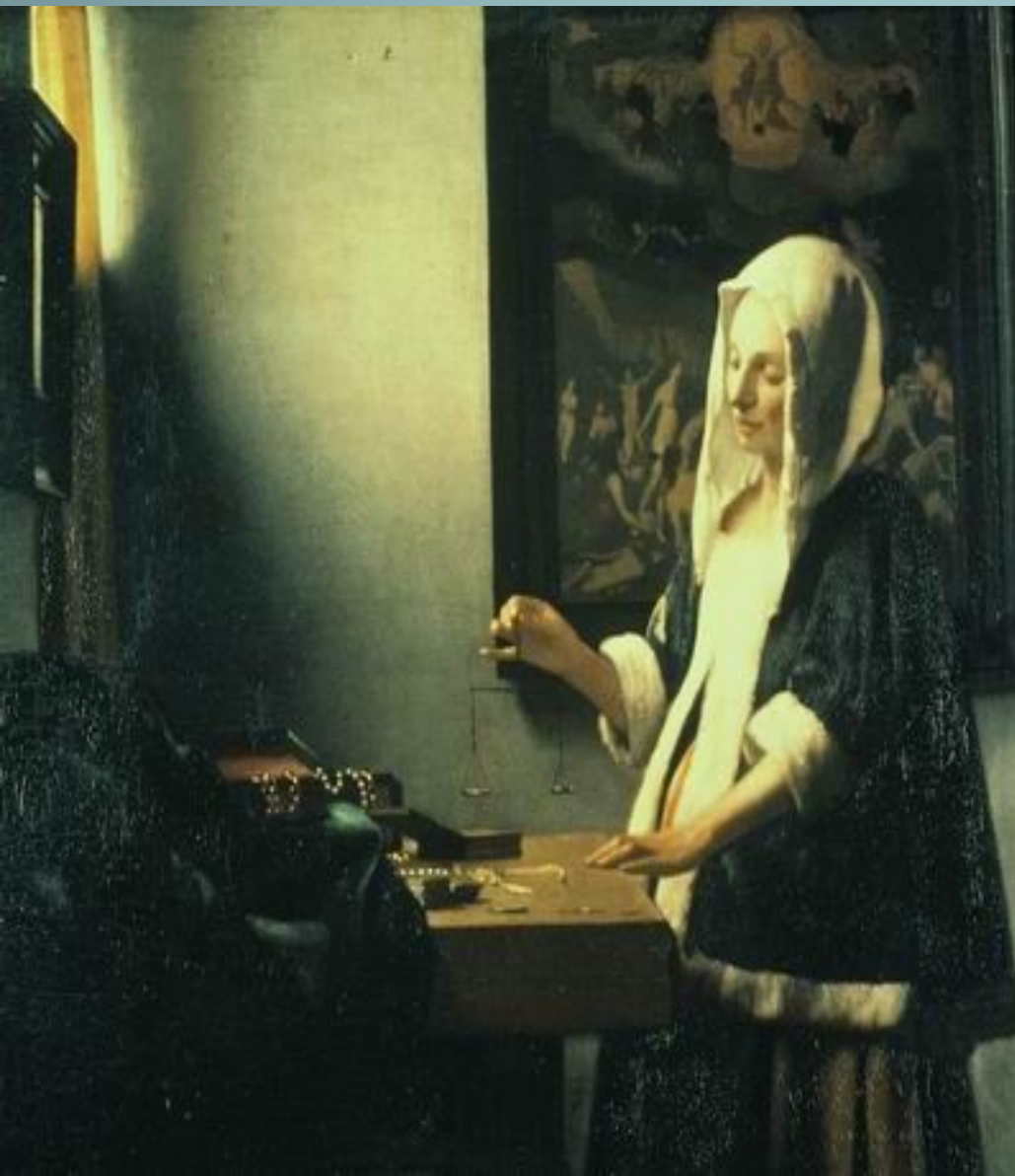
Женщина, взвешивающая жемчуг. Ок. 1662—1664

В отличие от этой ярко освещенной и ясной картины «Женщина, взвешивающая жемчуг» (ок. 1662—1664, Вашингтон, Национальная галерея искусства) написана в полумраке. Небольшое окно занавешено, пространство комнаты кажется замкнутым. Картина принадлежит к самым сложным и поэтически возвышенным произведениям Вермера. Женщина с полузакрытыми глазами изображена беременной, в состоянии глубокой отрешенности от окружающего мира, во власти мерного и медленного взвешивания разбросанного на столе мерцающего жемчуга. Его таинственный серебристый отсвет словно отражен в самом колорите картины. Мотив изображенных в руках женщины весов и висящая на стене большая погруженная в тень картина Страшный суд, где Христос взвешивает души праведников и грешников, связаны, по-видимому, символическим подтекстом. Но зрителя прежде всего захватывает царящее на полотне состояние чего-то неуловимого, влекущего к себе, завораживающего.