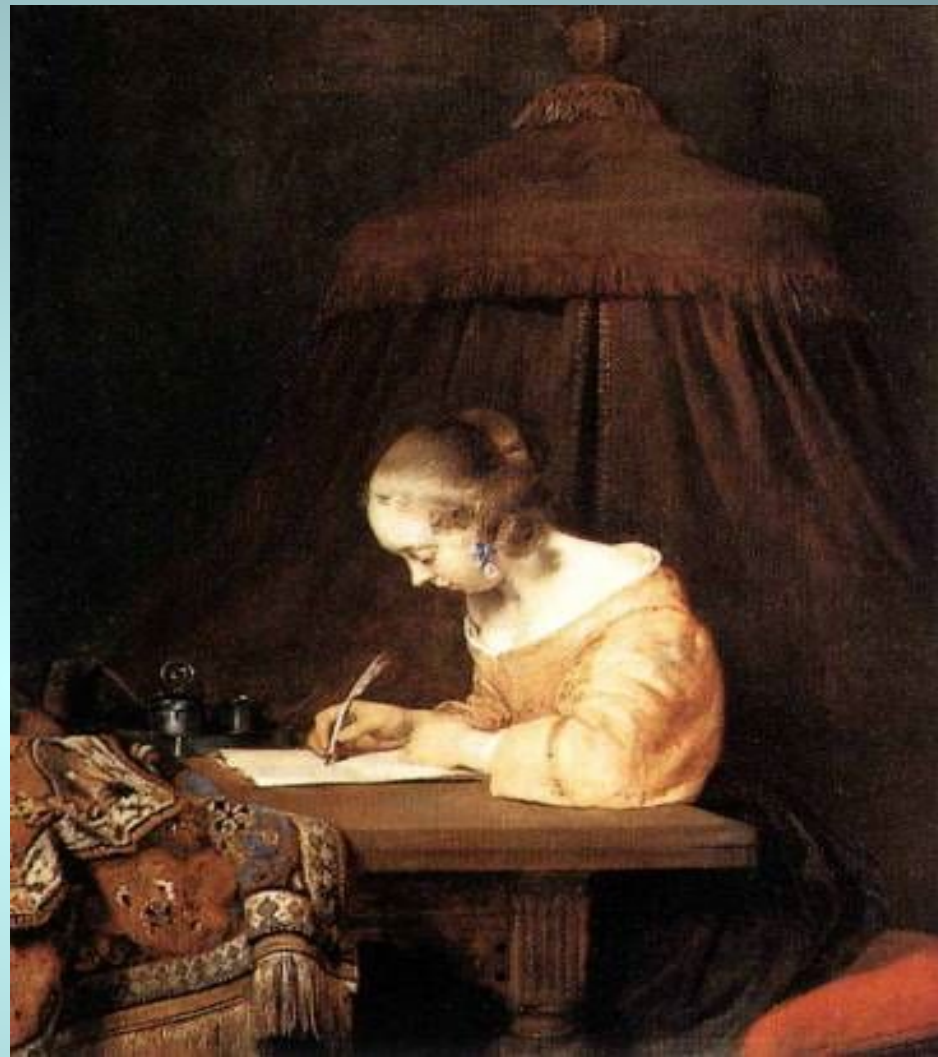
Женщина, пишущая письмо. 1655г. Г. Терборх