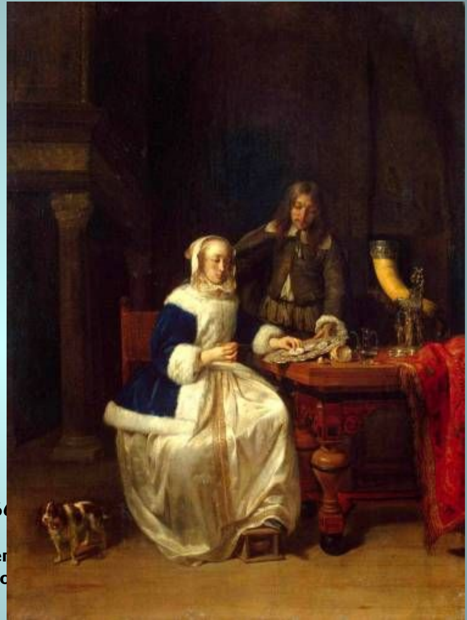
Габриэль Метсю. Завтрак. 1660г.

Ранними работами Габриэля Метсю (1629 - 1667) были исторические и мифологические сцены. Габриэль Метсю так же писал и портреты, но его самые характерные работы - сцены жанра, в которых художник сконцентрировался на сценах благородной жизни среднего класса. Одну из его работ - "Больной ребёнок" часто сравнивают с работами Яна Вермера.