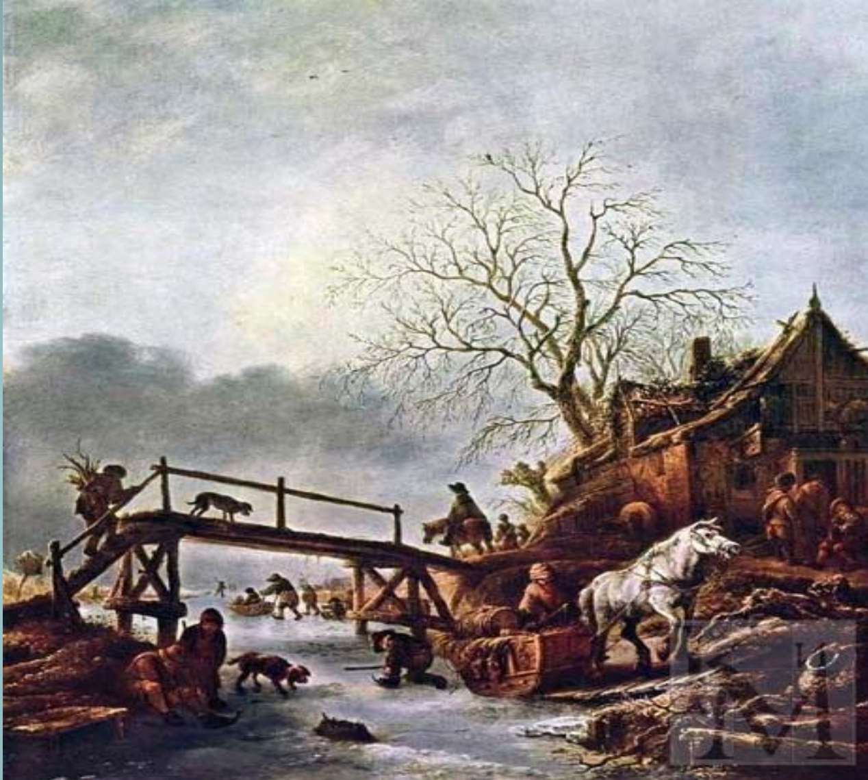
ОСТАДЕ Исаак (Постоялый двор на замерзшей реке)

2) Исаак ван Остаде (1621-49), брат и ученик Адриана ван Остаде. Жанровые сцены на открытом воздухе, зимние пейзажи («Замерзшее озеро», 1642).