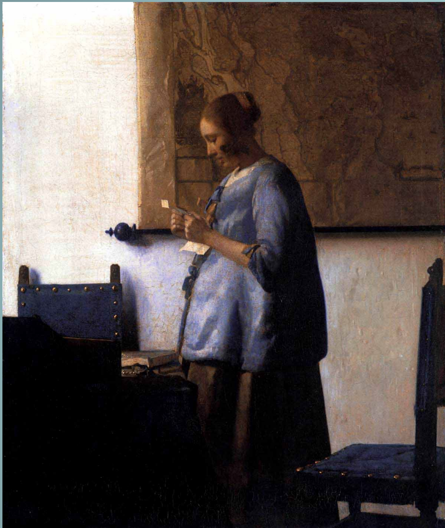
Женщина в синем, читающая письмо. 1664г.