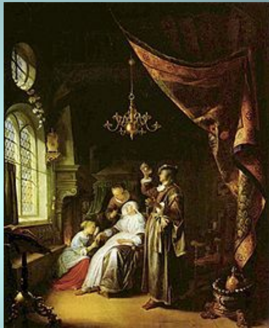
Герард Доу, Автопортрет, Амстердам