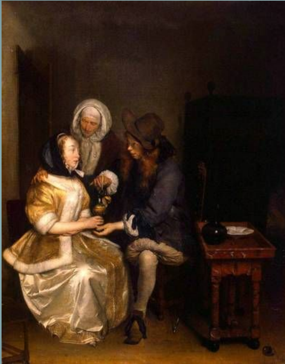
Стакан лимонада. 1655-1660г. Г.