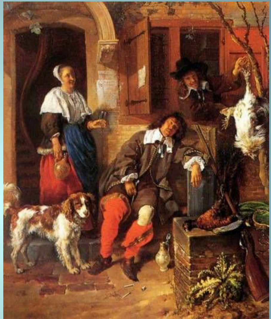
Спящий спортсмен. 1657-1659г.г. Метсю