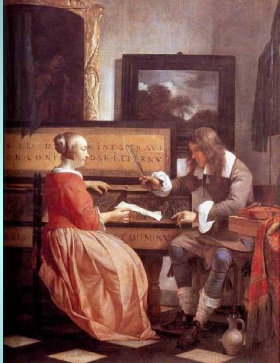
Сидящие мужчина и женщина. 1658-1660г.г.Г.Метсю.