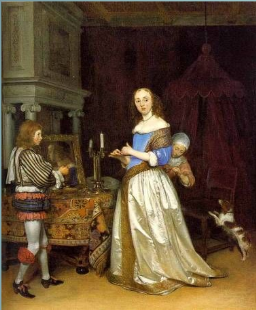
Женщина за туалетом. 1660г. Г. Терборх