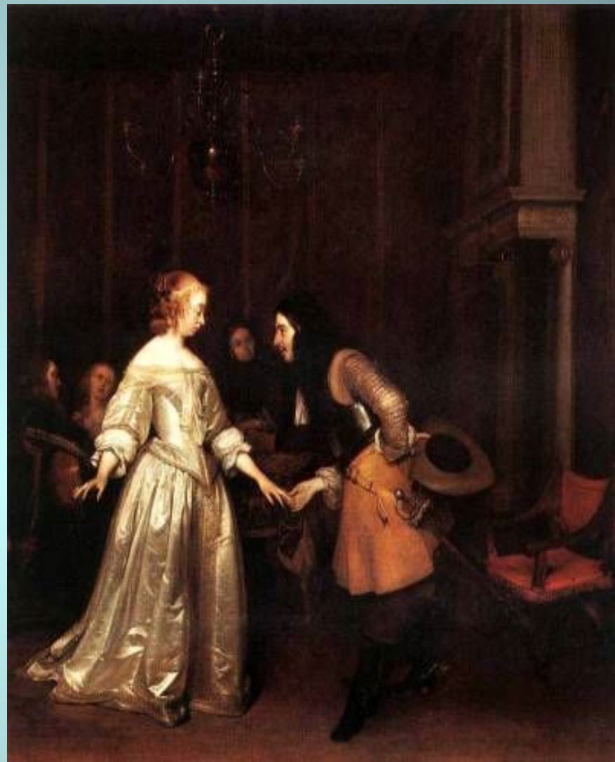
Танцующая пара. 1660г.Г. Терборх