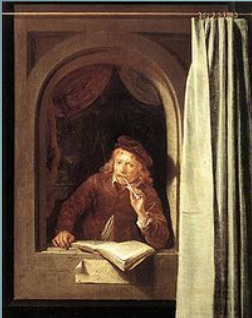
Герард Доу, Автопортрет, Амстердам