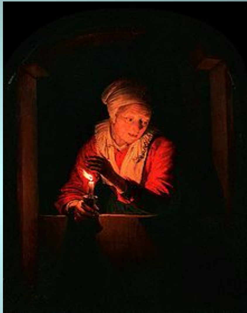
Доу, Старуха со свечой, Кёльн

Герард ДОУ — нидерландский художник, принадлежит к кругу «малых голландцев».