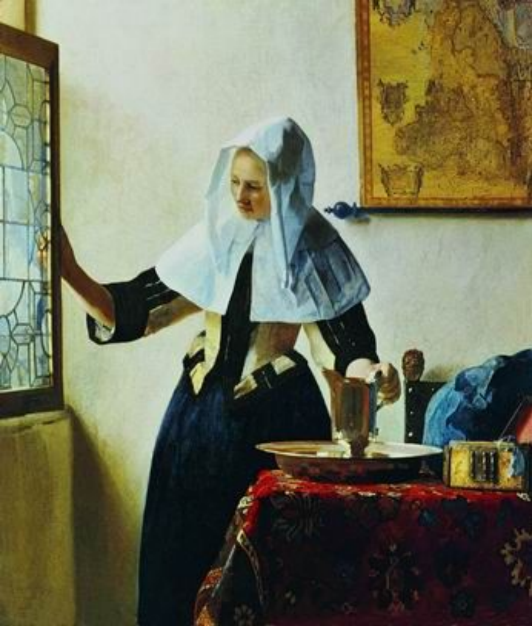
Молодая женщина с кувшином. Ок. 1664—1665

Начиная с 1660-х годов темы и образные идеи Вермера расширяются; появляются новые черты в характеристике персонажей, то более светских, то обыденных. В колорите утверждается редкая по красоте цветовая гамма, построенная на оттенках сине-голубого и желтого и объединенная общей серебристо-жемчужной тональностью; цвет теряет прозрачность, становится матовым, живопись — более ровной и гладкой. В излюбленном изображении одинокой женской фигуры в интерьере особое внимание уделяется колориту. Произведения этого времени более разнородны и художественно неравноценны. Среди них есть подлинные шедевры. Привычный для Вермера мотив «Молодой женщины с кувшином» (ок. 1664—1665, Нью-Йорк, Музей Метрополитен) покоряет своей свежестью. Художника восхищает изящество стройной женской фигуры, женственность жеста, с которым она отодвигает створку окна, и живой солнечный свет входит в комнату. В отличие