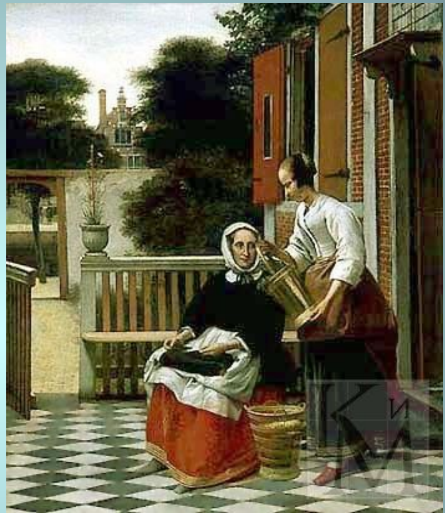
Питер де Хох. «Хозяйка и служанка» (около 1660, Эрмитаж). Голландские живописцы, в том числе и Питер де Хох, в своих картинах стремились воссоздать атмосферу скромного бюргерского быта.