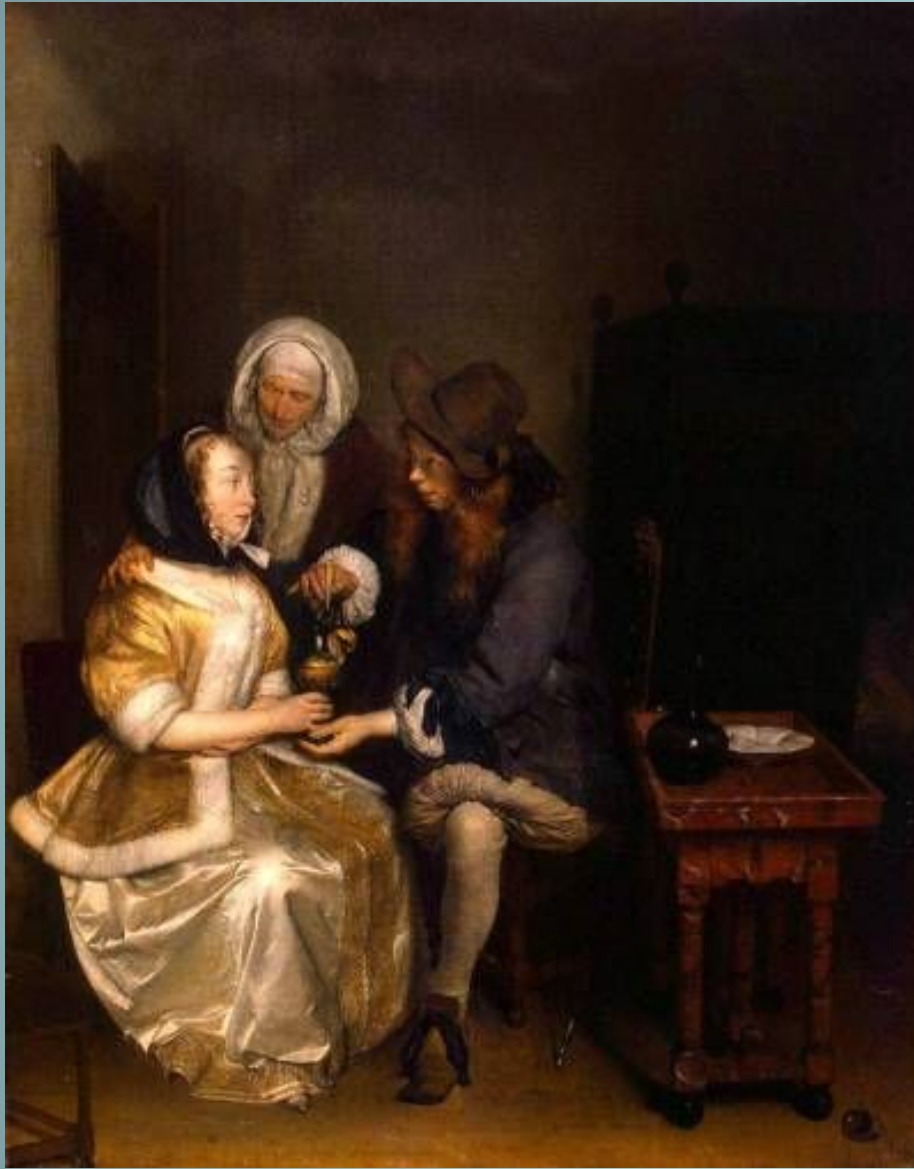
Стакан лимонада. 1655-1660г. Г.