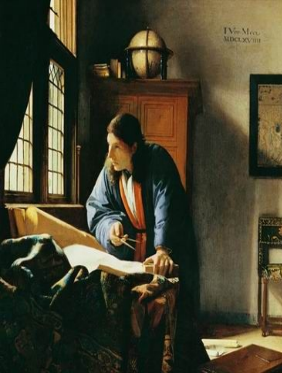
Географ. Ок. 1668—1669