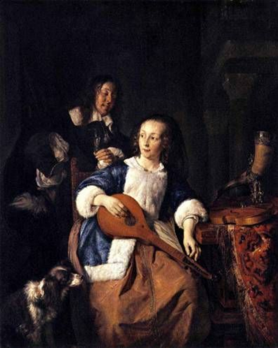
Играющая на цитре. Габриэль Метсю. 1660г.