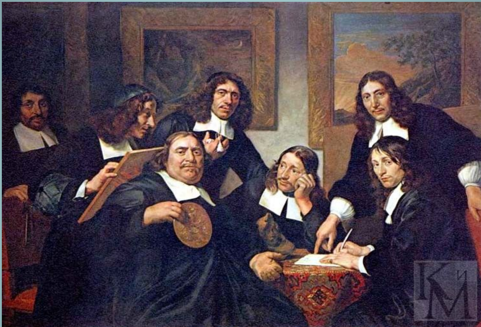
Ян де Брай. Старшины гильдии художников Харлема. 1675 год. Государственный музей в Амстердаме.