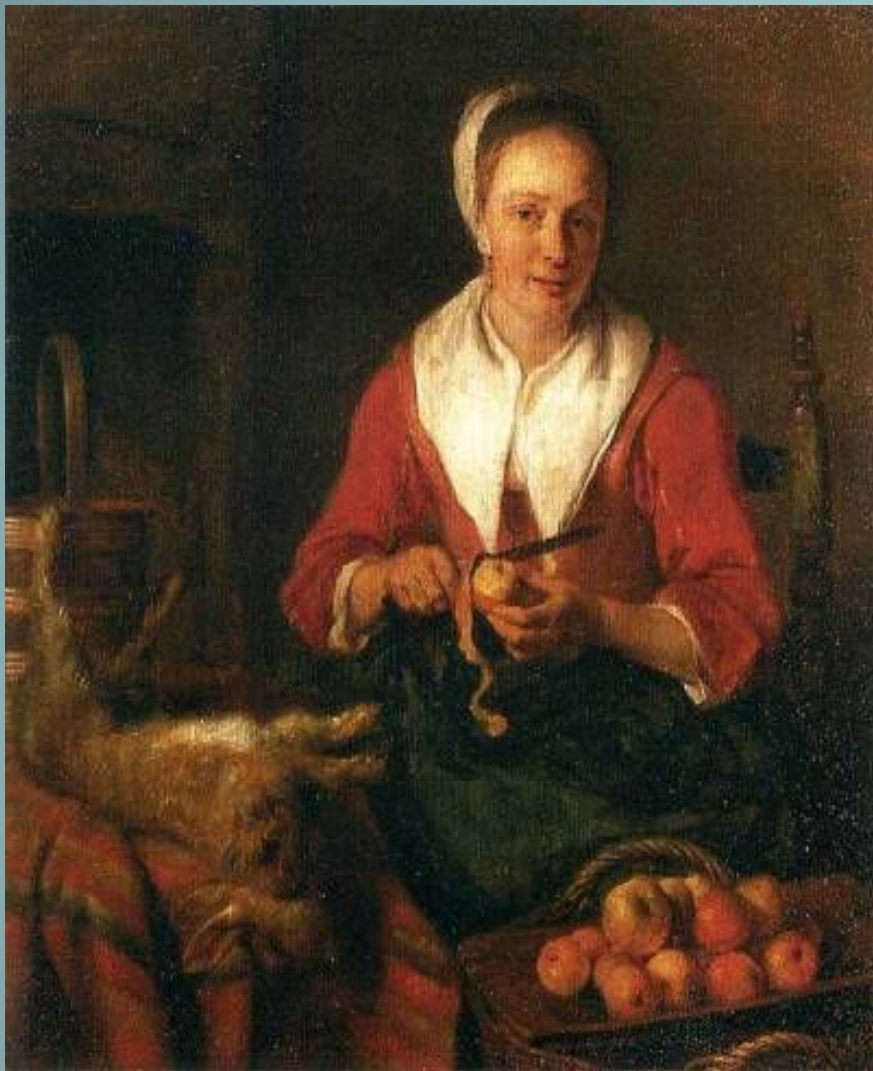
Женщина, чистящая яблоко. 1655-1657г.г.Метсю.