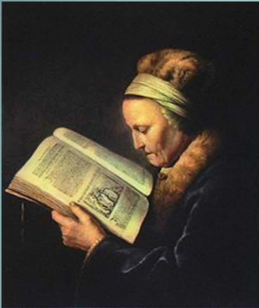
Доу, Старая женщина за книгой (мать Рембрандта), Амстердам

Герард ДОУ — нидерландский художник, принадлежит к кругу «малых голландцев».