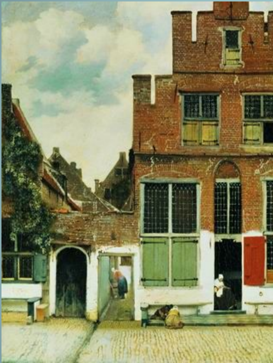
Улочка. Ок. 1657—1658

Если бы Вермер написал только два пейзажа «Улочка» (ок. 1657—1658, Амстердам, Рейксмузеум) и «Вид Делфта» (ок. 1660—1661, Гаага, Маурицхейс), то он уже вошел бы в число великих европейских живописцев. В Улочке изображен частный мотив, возможно, художник увековечил свой собственный дом. Летний пасмурный день. Фасад здания из красного кирпича с побелкой в нижнем этаже и зелеными ставнями занимает правую часть композиции, слева открывающийся проход создает впечатление пространственной глубины. Весомость архитектуры подчеркивает движение проносящихся облаков.