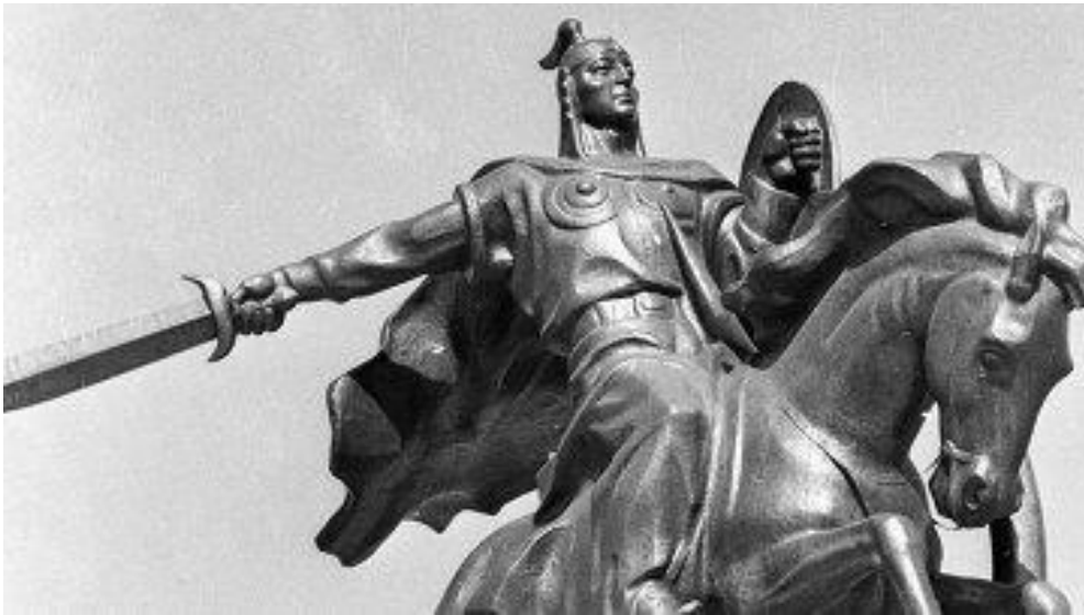
Бишкек. Памятник Манасу - герою киргизского национального эпоса.