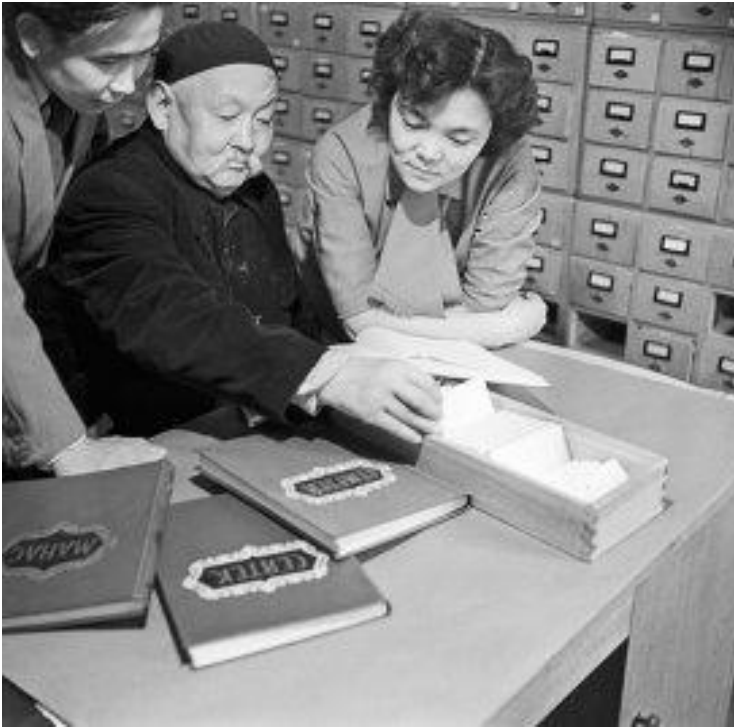
Народный артист Киргизской ССР Саякбай Каралаев - сказитель эпоса "Манас"