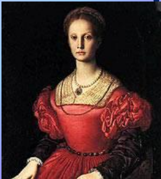
Портрет Лукреции Пачиатичи.