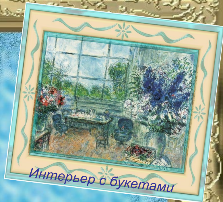
Интерьер с букетами

Часто у Марка Шагала цветы сопровождают влюблённых. В 1920-х годах манера Шагала стала свободнее, и цветы позволяли ему широко использовать яркие и разнообразные фактуры.