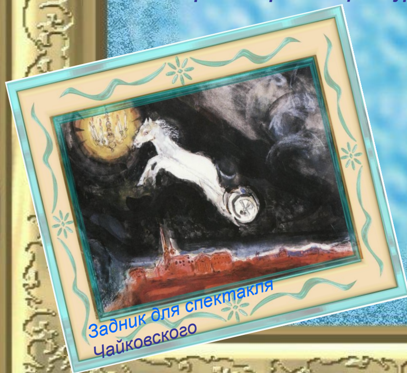
Задник для спектакля Чайковского

В роли театрального оформителя Шагал известен меньше, чем в качестве книжного иллюстратора и витражиста, однако его работы в театре никогда не были провальными.