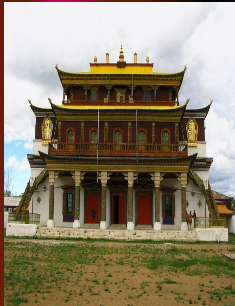
Буддистский храм - дацан

Некоторые индийцы даже ходили со специальной метелочкой, чтобы случайно не раздавить на дороге червяка или букашку.