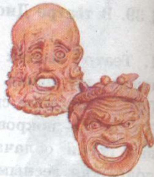
Трагическая и комическая маски.

Со временем число актеров было увеличено до двух, а затем и до трех человек. Актерами были только мужчины. Они играли все роли, в том числе и женские. Для того, чтобы зрителям было ясно, кого именно они изображают, актеры надевали большие ярко раскрашенные маски.