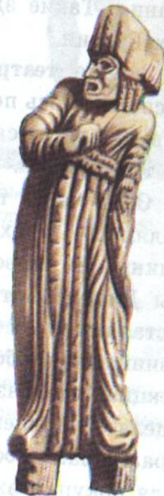
Трагический актер. Древняя статуэтка из слоновой кости.

Некоторые из греческих театров вмещали более 20 тысяч зрителей. Первоначально в представлении участвовал лишь один человек и хор из 15 человек.