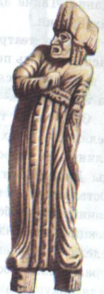
Трагический актер. Древняя статуэтка из слоновой кости.

Некоторые из греческих театров вмещали более 20 тысяч зрителей. Первоначально в представлении участвовал лишь один человек и хор из 15 человек.