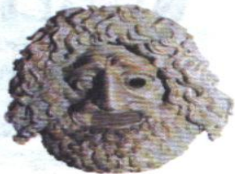
Бронзовая маска актера

Со временем число актеров было увеличено до двух, а затем и до трех человек. Актерами были только мужчины. Они играли все роли, в том числе и женские. Для того, чтобы зрителям было ясно, кого именно они изображают, актеры надевали большие ярко раскрашенные маски.