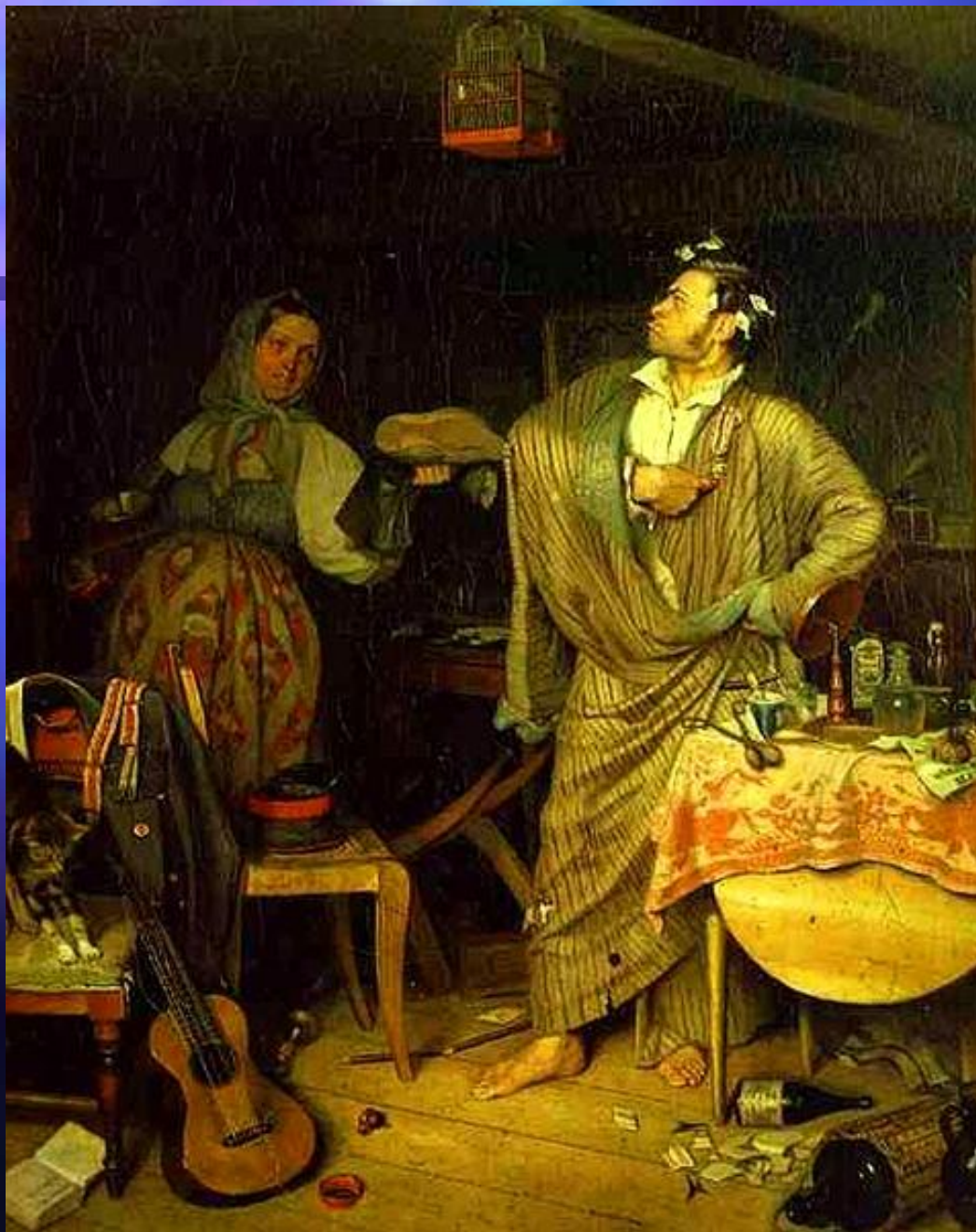
П. А. Федотов. «Свежий кавалер». 1846. Третьяковская галерея.