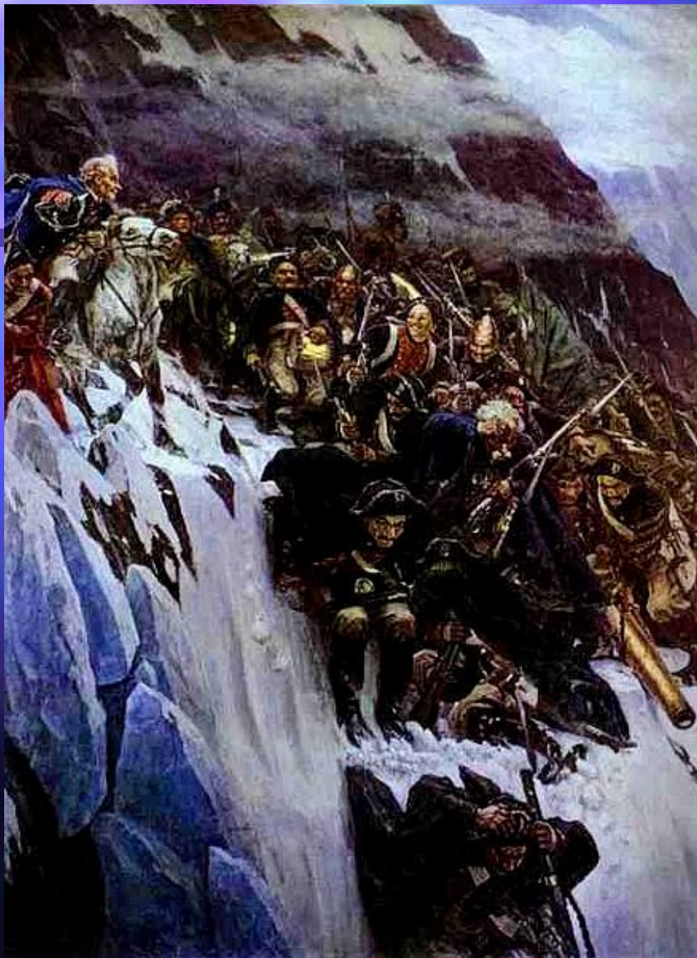
В.И.Суриков. Переход Суворова через Альпы в 1799 г. 1899г.