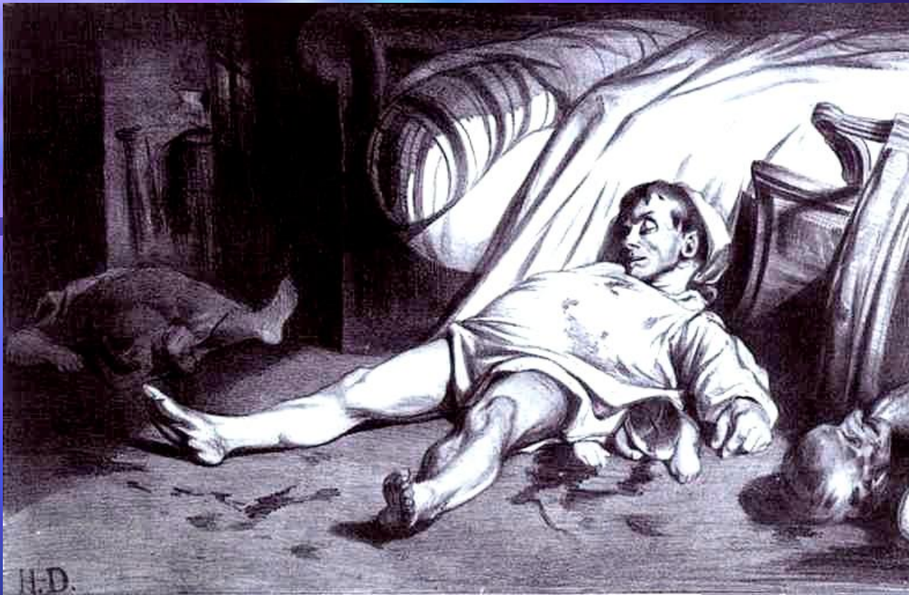
Оноре Домье. Улица Транснонен. 1834 г. Британский музей. Лондон.

Выдающийся мастер литографии (разновидность графики) французский художник Оноре Домье, который ненавидел угнетение и насилие, всегда откликался на злободневные вопросы давая им свою оценку. «Улица Транснонен» была воспринята как протест против террора и насилия. В основу картины легли реальные события революции 1834 г. Из дома №12 по улице Транснонен кто-то выстрелил в солдат, разгоняющих демонстрацию. В ответ солдаты убили всех жильцов дома.