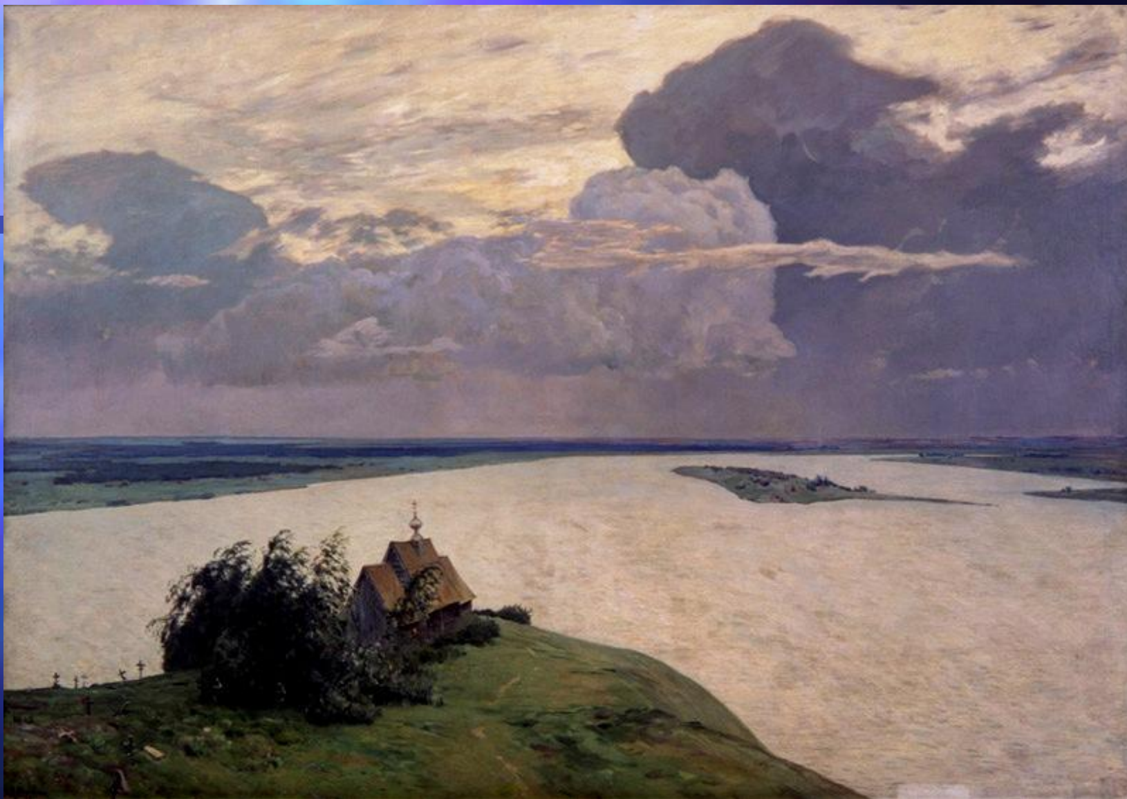
И. И. Левитан. «Над вечным покоем». 1894 год. Третьяковская галерея.