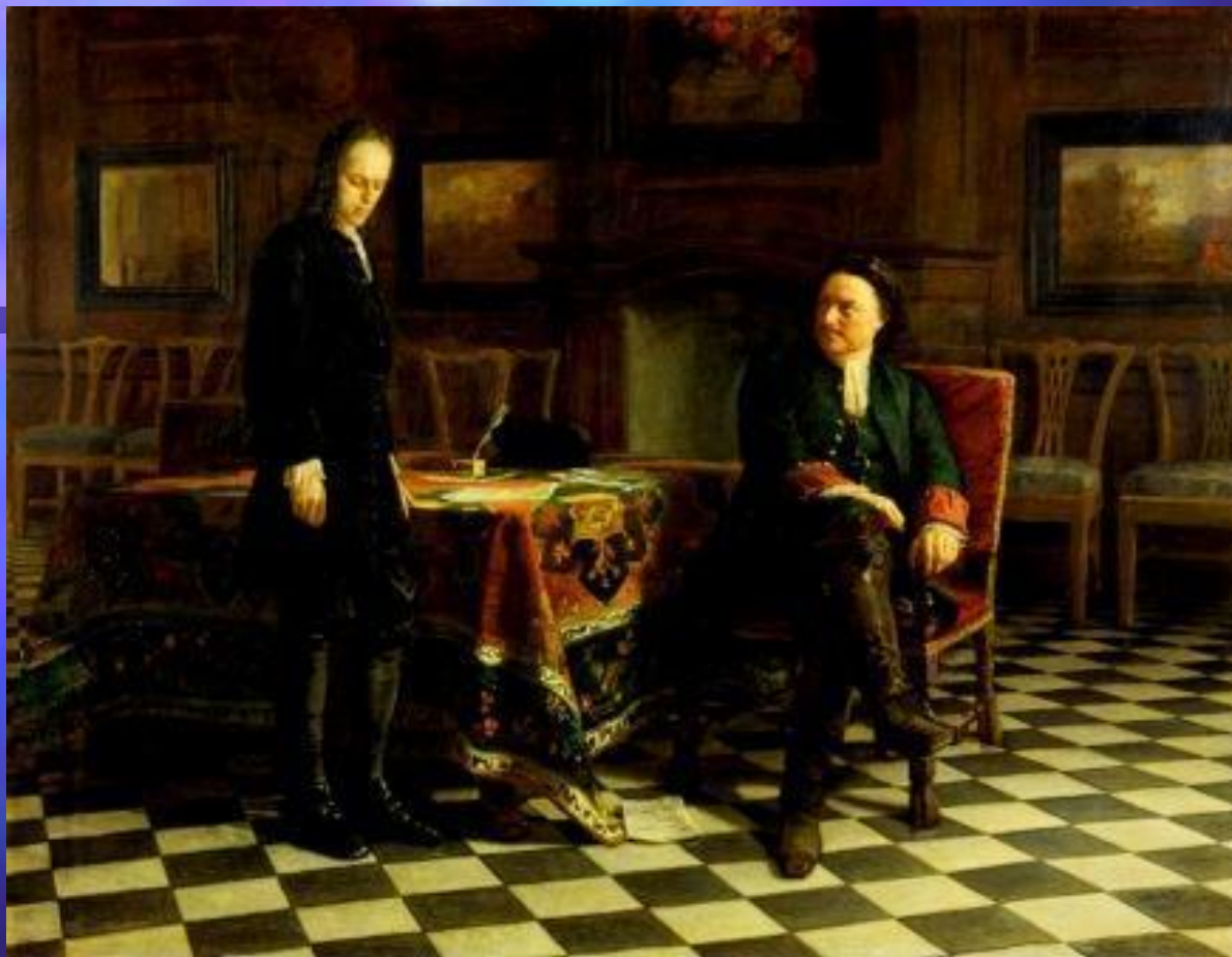
Н.Н.Ге. «Петр 1 допрашивает царевича Алексея Петровича в Петергофе». 1871 г. ГРМ, Санкт-Петербург.

Важнейшей вехой в этом отношении стала картина Н.Н. Ге «Петр 1 допрашивает царевича Алексея Петровича в Петергофе». Содержательный анализ этой картины принадлежит русскому писателю М. Е. Салтыкову-Щедрину:»Тем не менее всякий, кто видел эти две простые, вовсе не эффектно поставленные фигуры Петра I и царевича Алексея, должен будет сознаться, что он был свидетелем одной из тех потрясающих драм, которые никогда не изглаживаются в памяти».