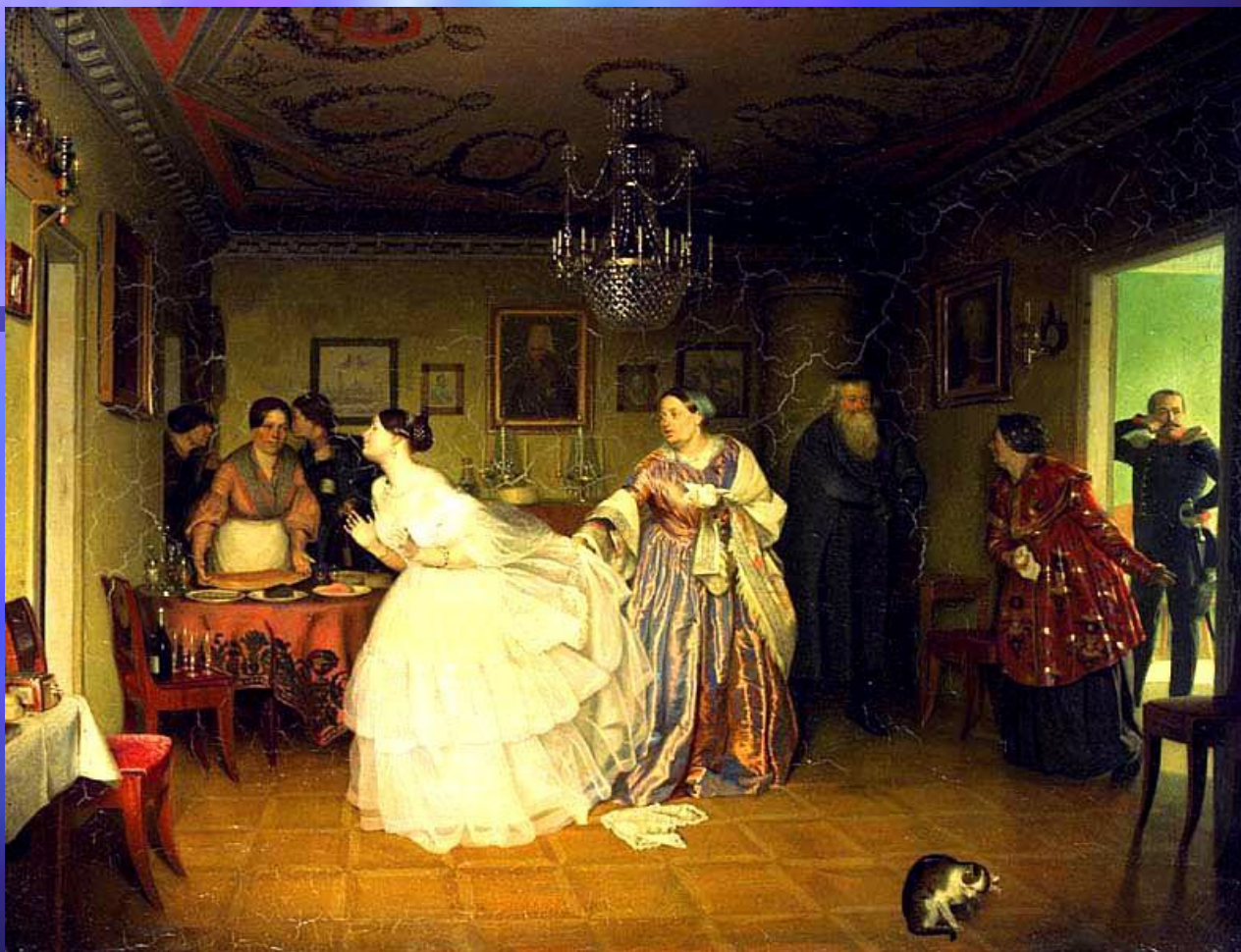
П. А. Федотов. «Сватовство майора». 1848 год. Третьяковская галерея.