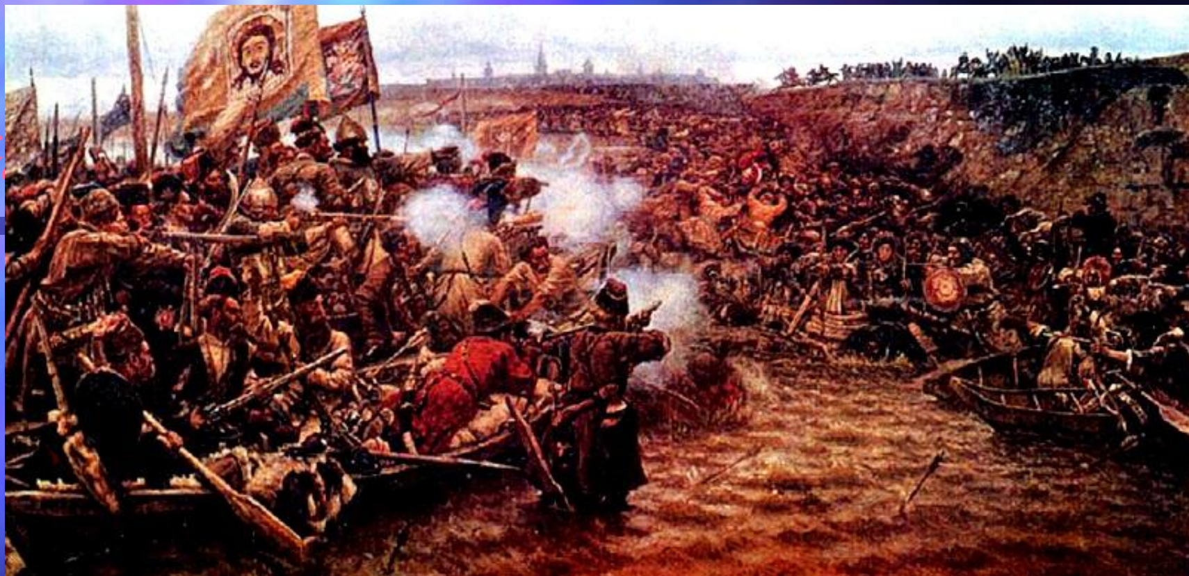
В.И. Суриков. Покорение Сибири Ермаком. 1895 г. Русский музей, Петербург.

«Я не мыслю себе действия одной исторической личности без народа. Главная моя задача — вытащить народ на улицу», — говорил художник. Именно народу, его мужеству и храбрости посвятил Суриков картину «Покорение Сибири Ермаком».