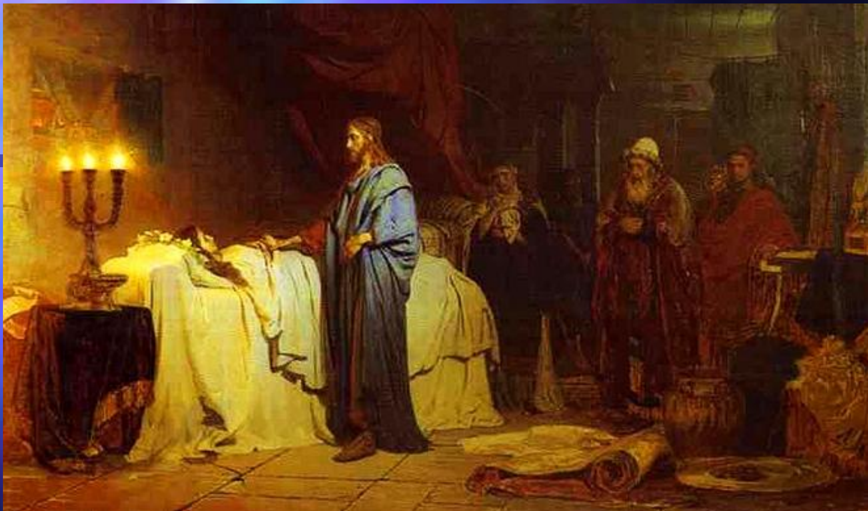
И.Е.Репин. Воскрешение дочери Иаира. 1871