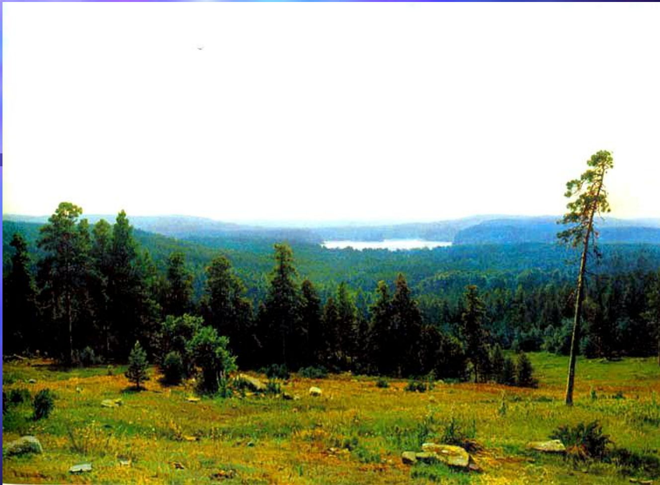
И.И.Шишкин. Лесные дали. 1884 г. Третьяковская галерея, Москва.

Мерно, подобно волнам моря, колышутся вершины сосновых лесов, убегающих в голубую даль горизонта на картине «Лесные дали». Величественная панорама лесных массивов показана как бы с высоты птичьего полета. Справа, слегка наклонясь, стоит одинокая сосна, рядом две каменные глыбы. Пробежав взглядом небольшую солнечную полянку, погружаемся в глухие дебри девственного бора. Где-то вдалеке, среди темной зелени, голубеет лесное озеро.