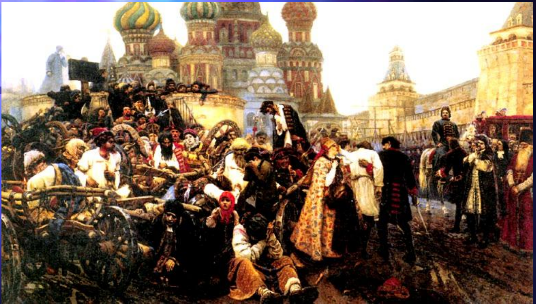
В.И. Суриков. Утро стрелецкой казни. 1881 год.