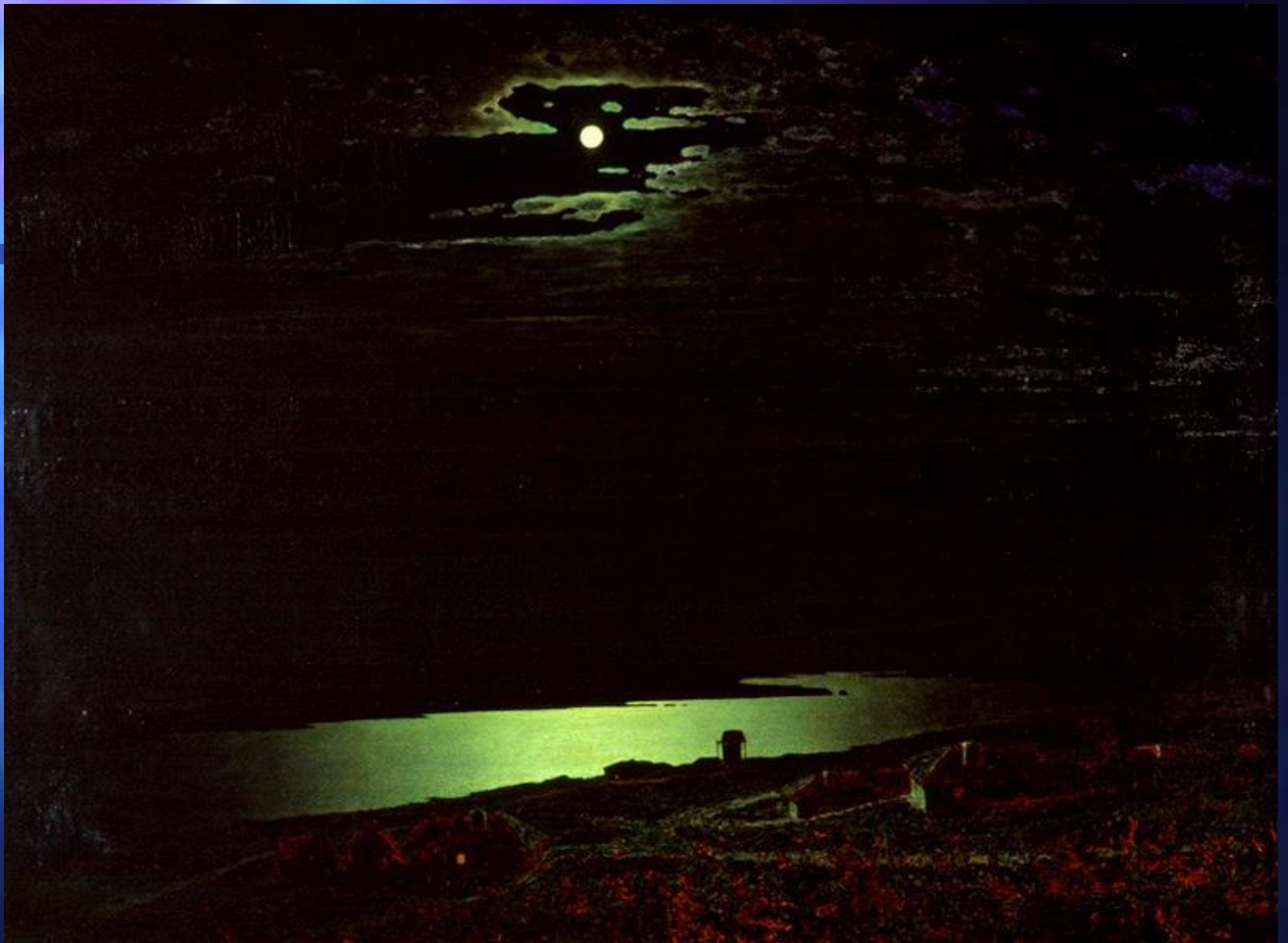
Куинджи А.И. Ночь на Днепре. 1880