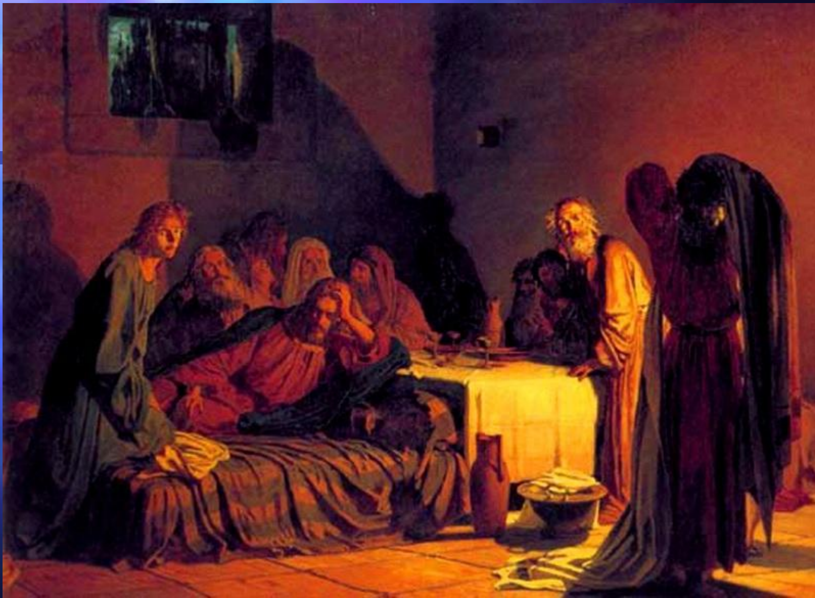
Н.Н.Ге. Тайна вечера