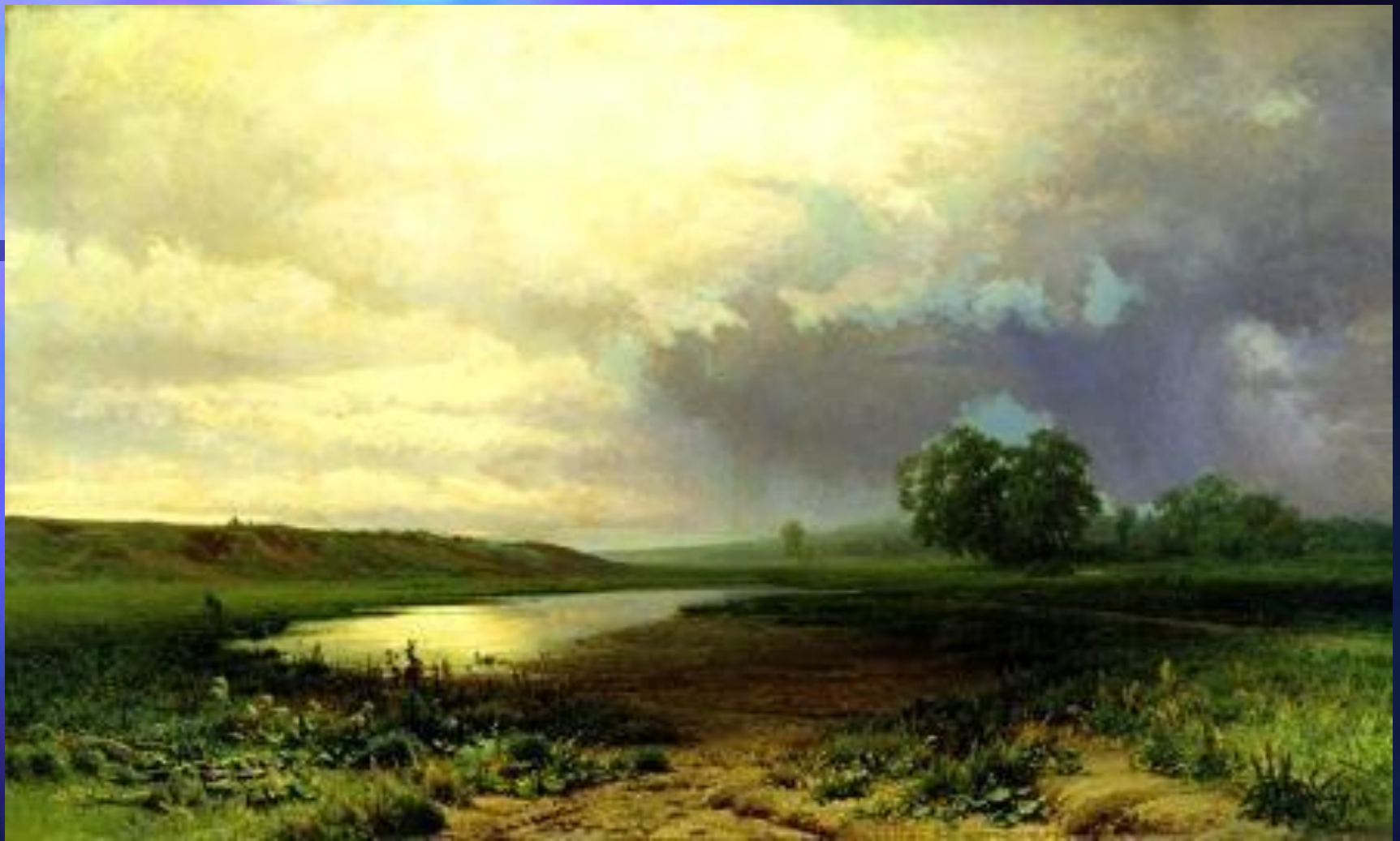
Ф. А. Васильев. «Мокрый луг». 1872. Третьяковская галерея.