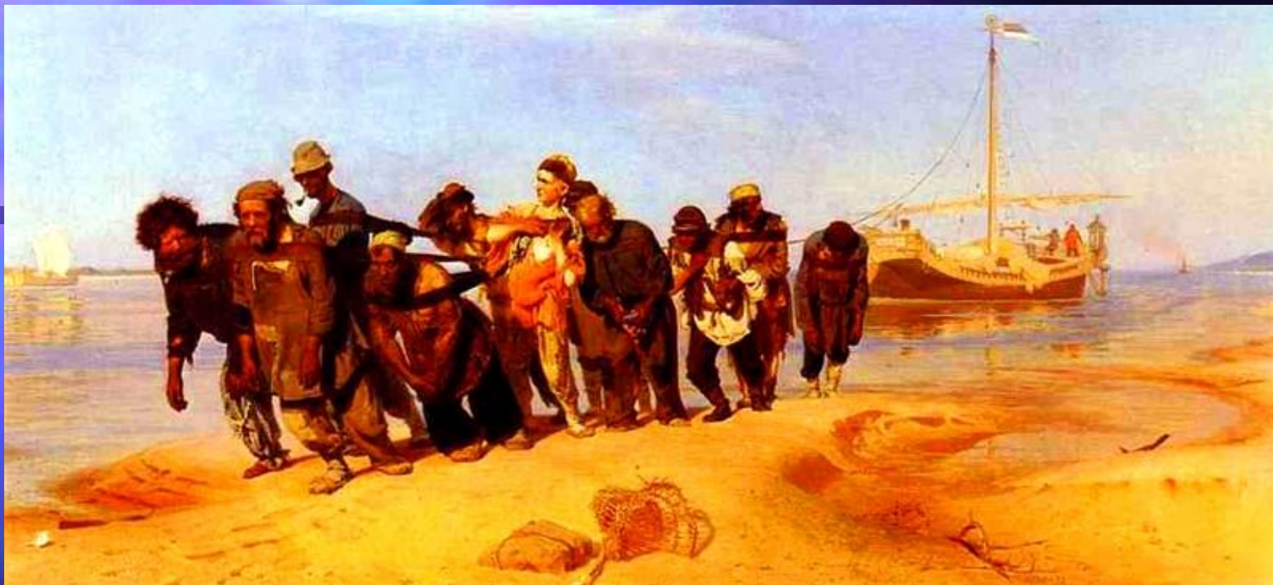
И.Е.Репин Бурлаки на Волге.