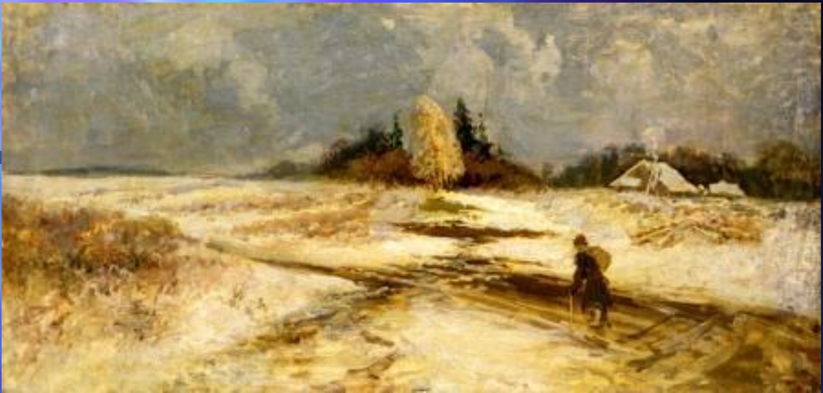
Ф. А. Васильев. Оттепель. 1871 г. Государственная Третьяковская галерея, Москва

Именно такие чувства пробуждает картина Федора Александровича Васильева «Оттепель». Сумрачен и неприветлив заиндевелый от инея лес. Снег уже утратил свою белизну, и на дальние поля легли синеватые тени. Резкие порывы ветра сгибают голые ветви деревьев. Талая вода залила узкую проселочную дорогу. даже луч солнца, сумевший прорваться сквозь мрачные тучи, не в силах изменить тоскливый облик пейзажа. Зброшенной и сиротливой кажется одинокая крестьянская избушка, стоящая в стороне от дороги. Как мучительно медленно пробуждается природа от тяжелого зимнего сна! Но к чувству бесприютности одновременно присоединяется и надежда на скорое весеннее пробуждение жизни. Все потеплело, оттаяло в природе. Пришла долгожданная оттепель..