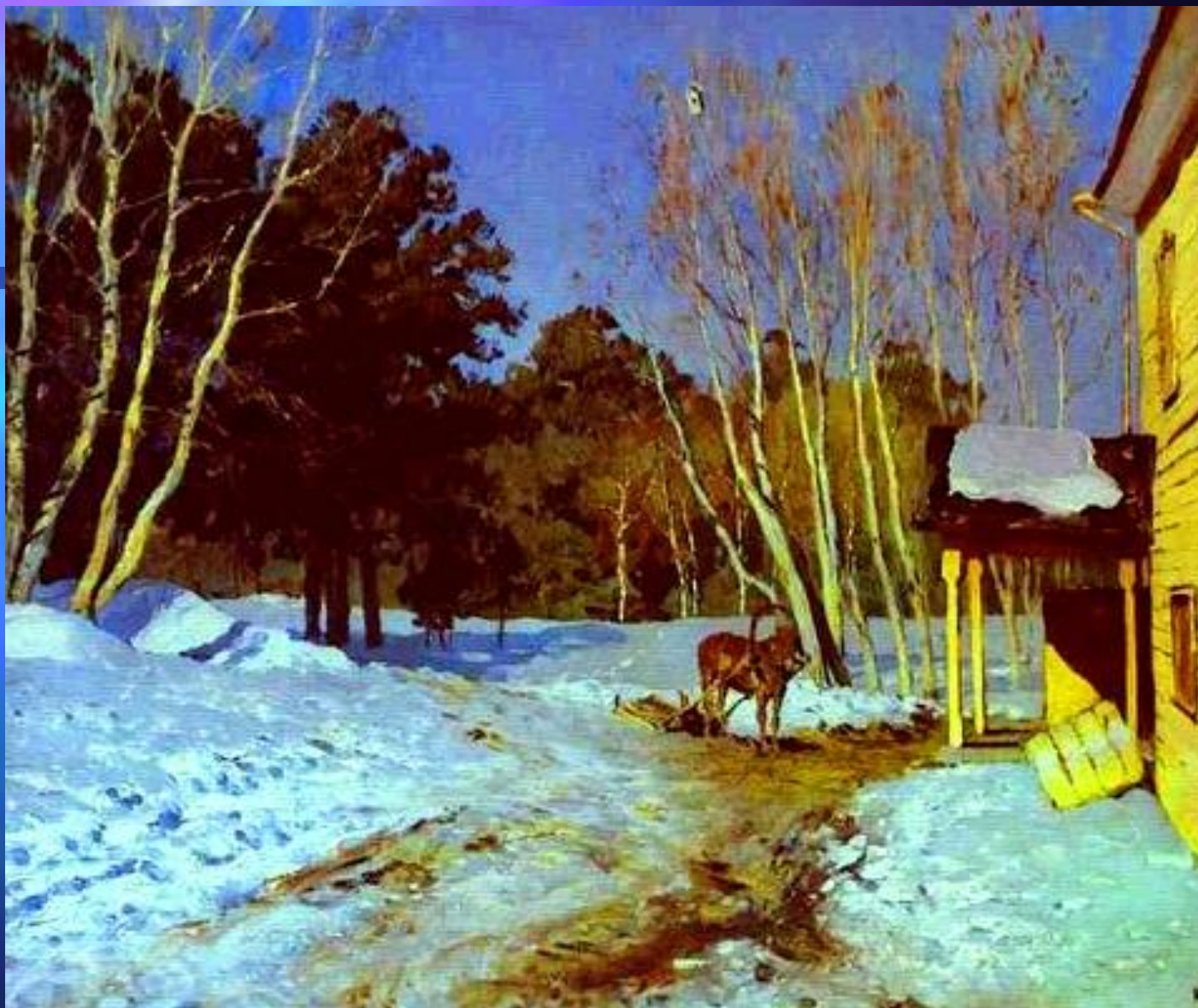
И. И. Левитан. «Март». 1895 год. Третьяковская галерея.