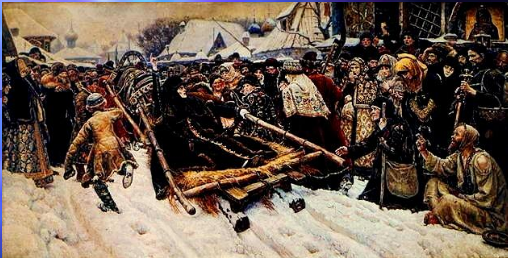
В. И. Суриков. «Боярыня Морозова». 1886 год. Третьяковская галерея.