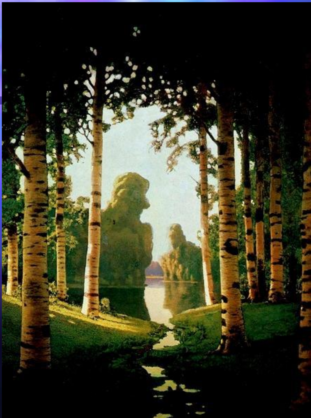
Куинджи А.И. Березовая роща. 1879 г.