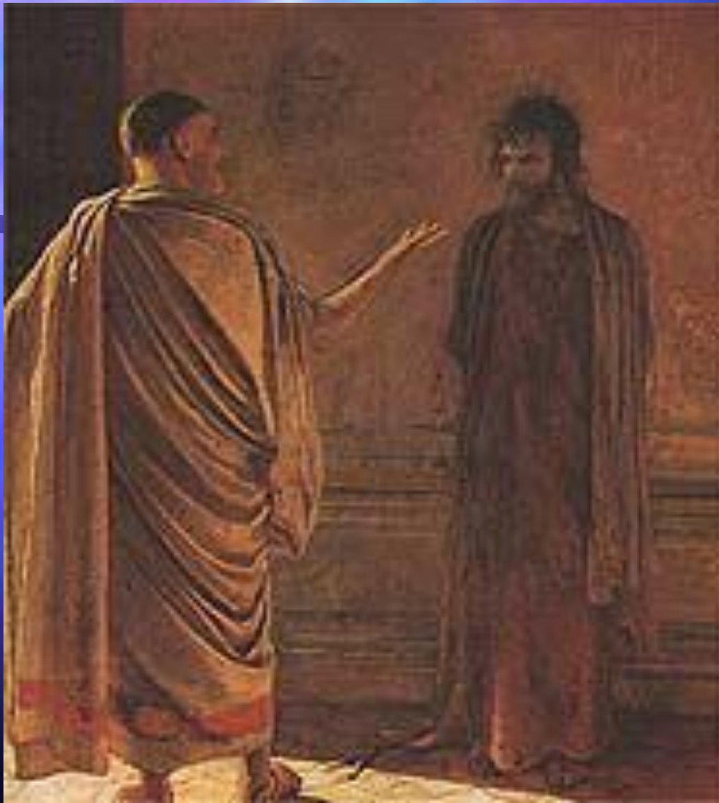
Н.Н. Ге. «Что есть истина?» (Понтий Пилат и Христос). 1890 год. Третьяковская галерея