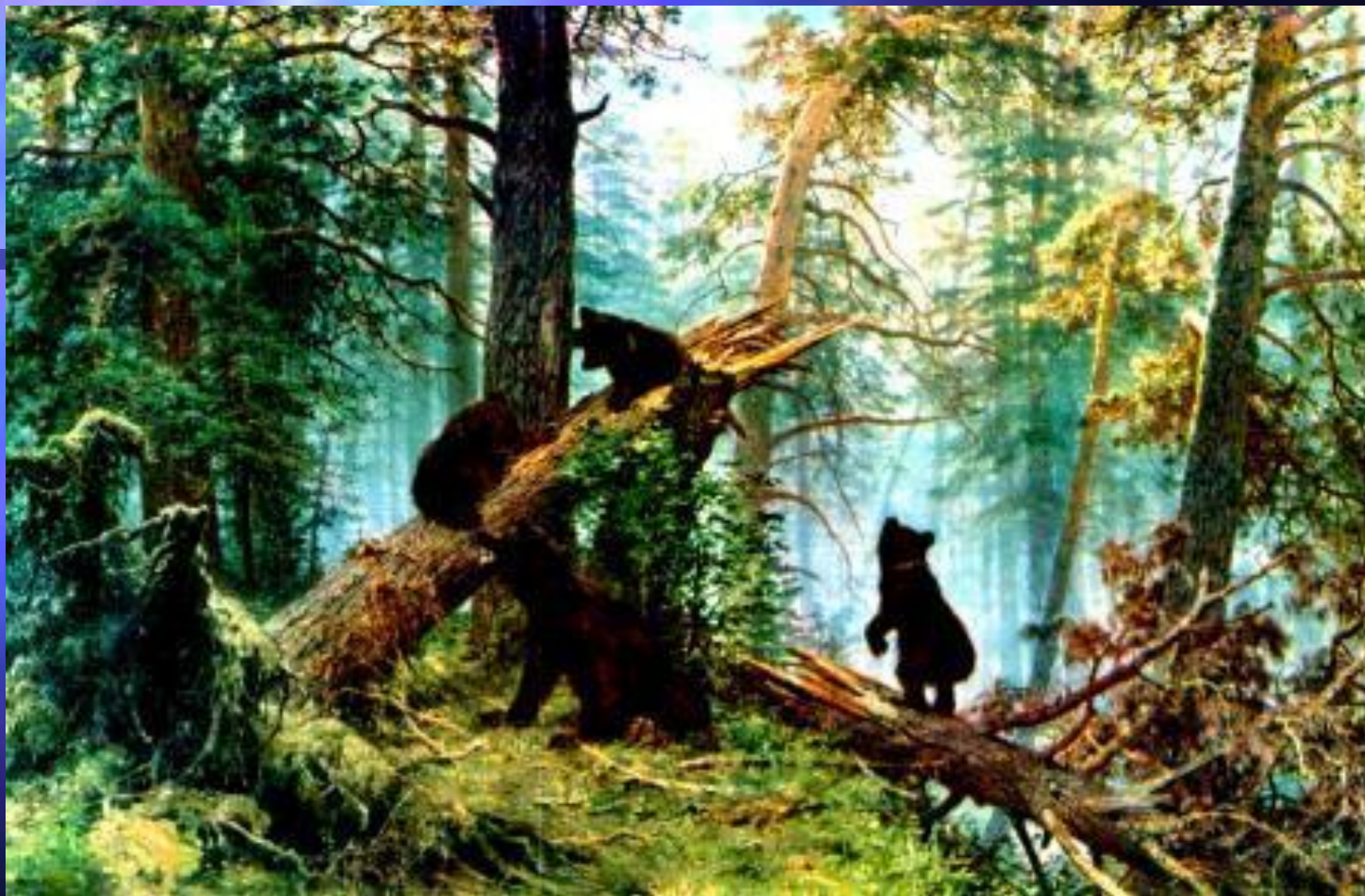
И. И. Шишкин. «Утро в сосновом лесу». 1889. Третьяковская галерея.