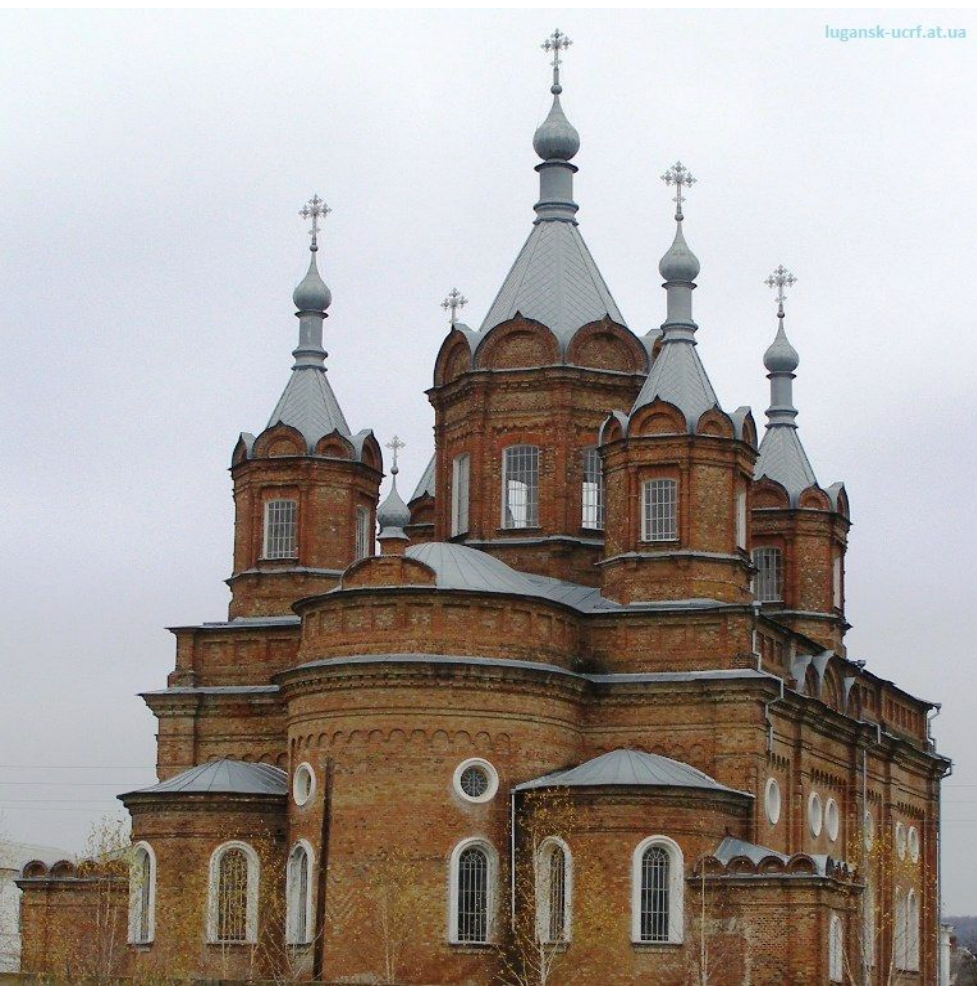
Рис. Храм Старобельська