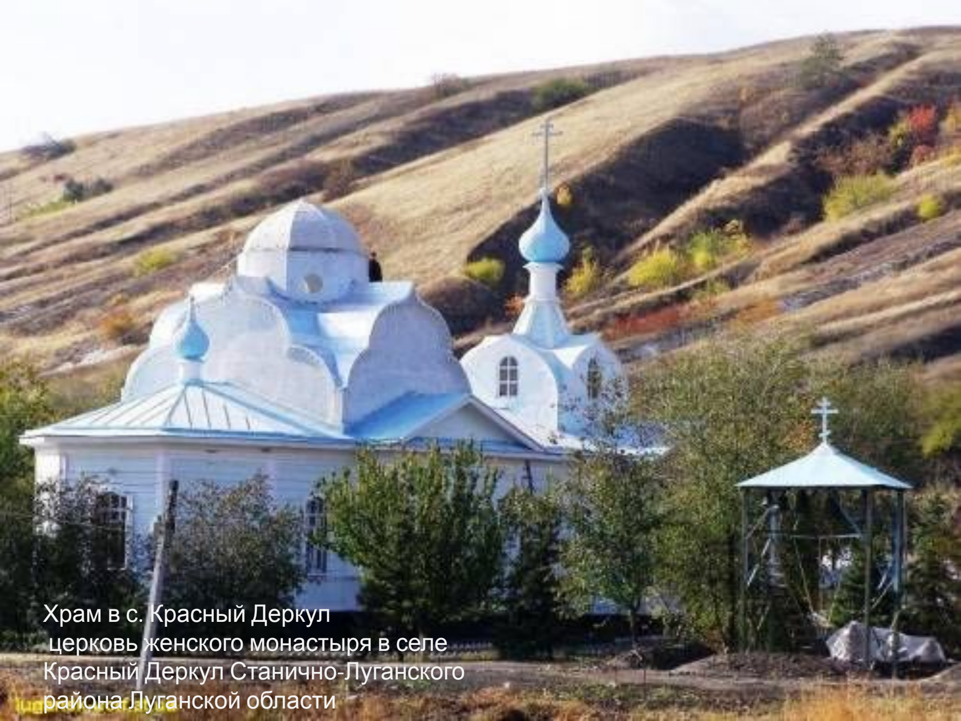
Храм в с. Красный Деркул церковь женского монастыря в селе Красный Деркул Станично-Луганского района Луганской области