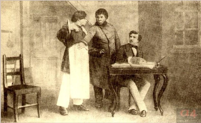
«Ревизор». Действие 2, явление 04. Спектакль Московского Малого театра. Фото 1886