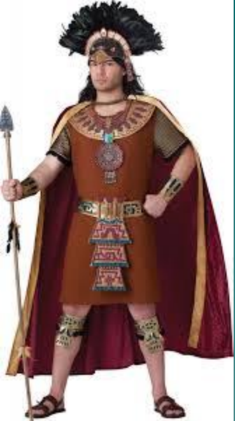
Костюм короля Мая