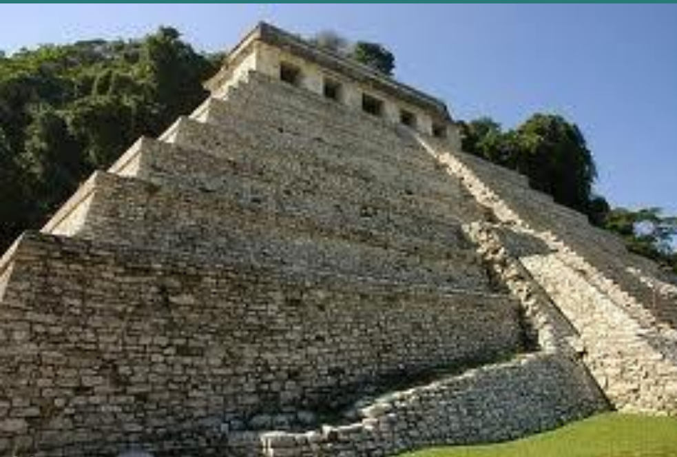
Храм в Паленке.