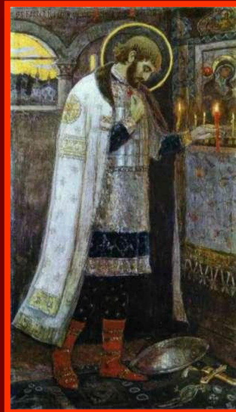
М. Нестеров Святой благоверный Князь А. Невский