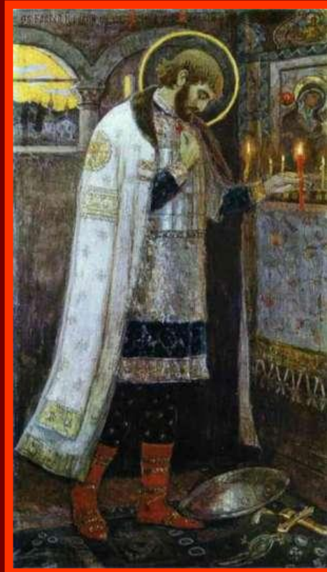
М. Нестеров Святой благоверный Князь А. Невский