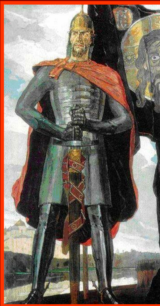
Павел Корин «А. Невский», часть триптиха