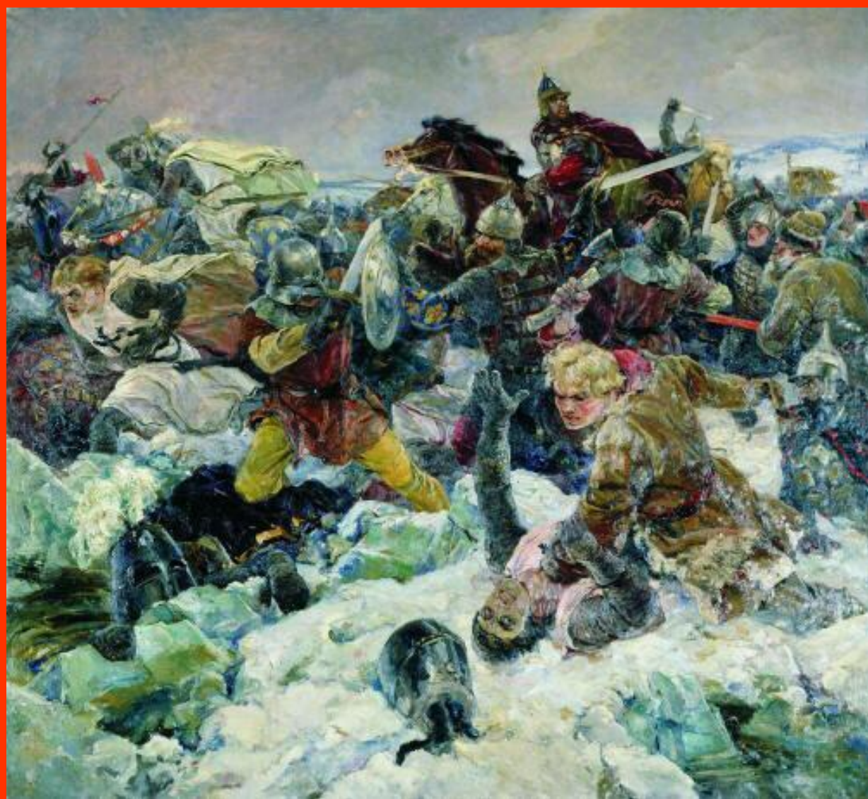
В. А. Серов. Ледовое побоище