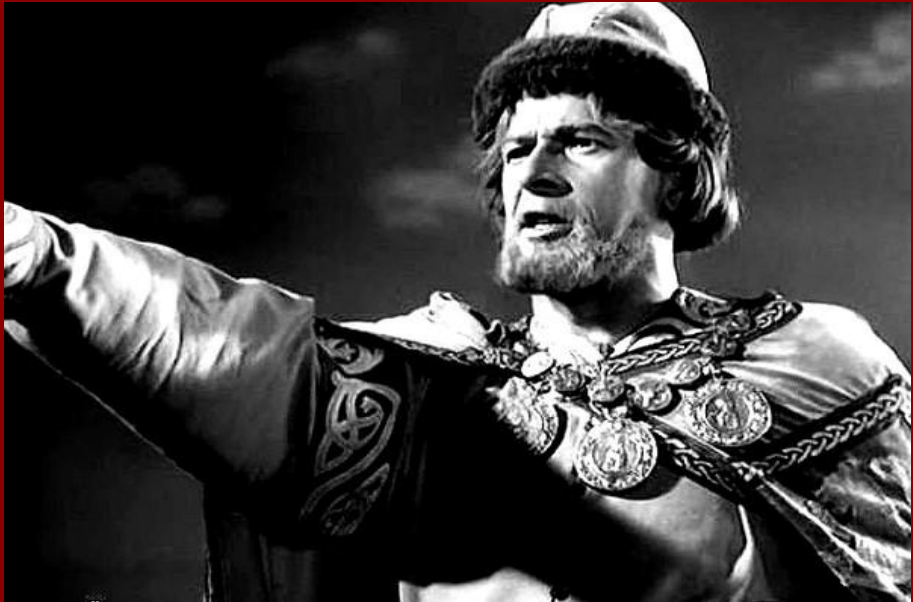
Кадр из фильма «Александр Невский» Реж. С. Эйзенштейн