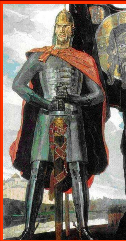
Павел Корин «А. Невский», часть триптиха