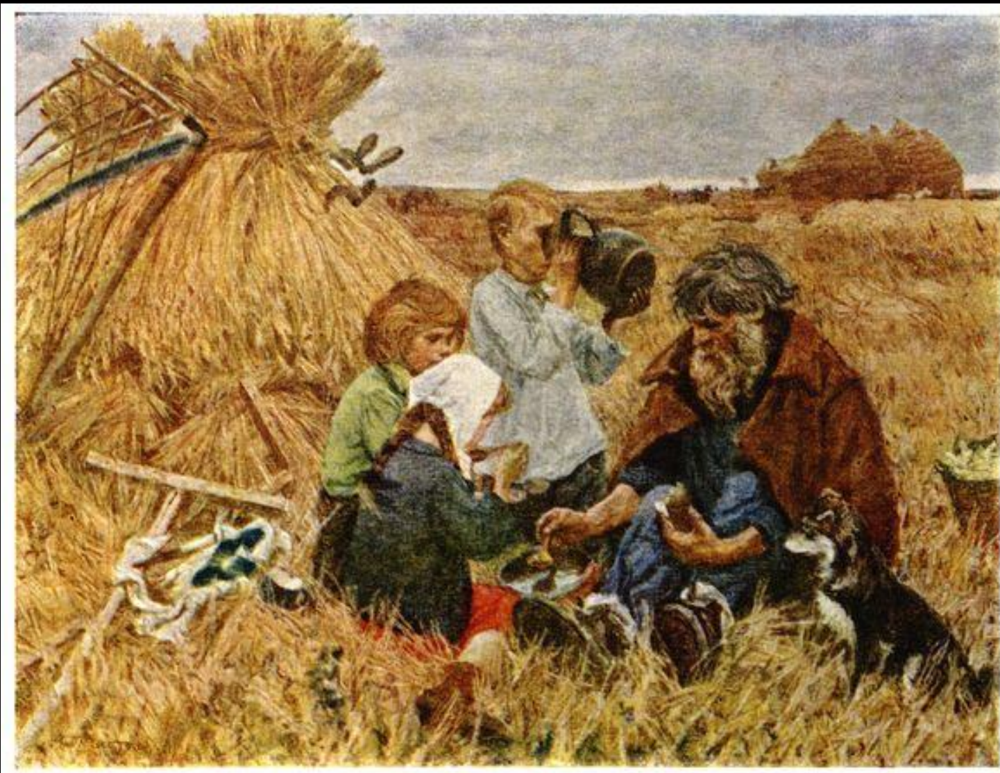
А.А.Пластов. Жатва (1945)