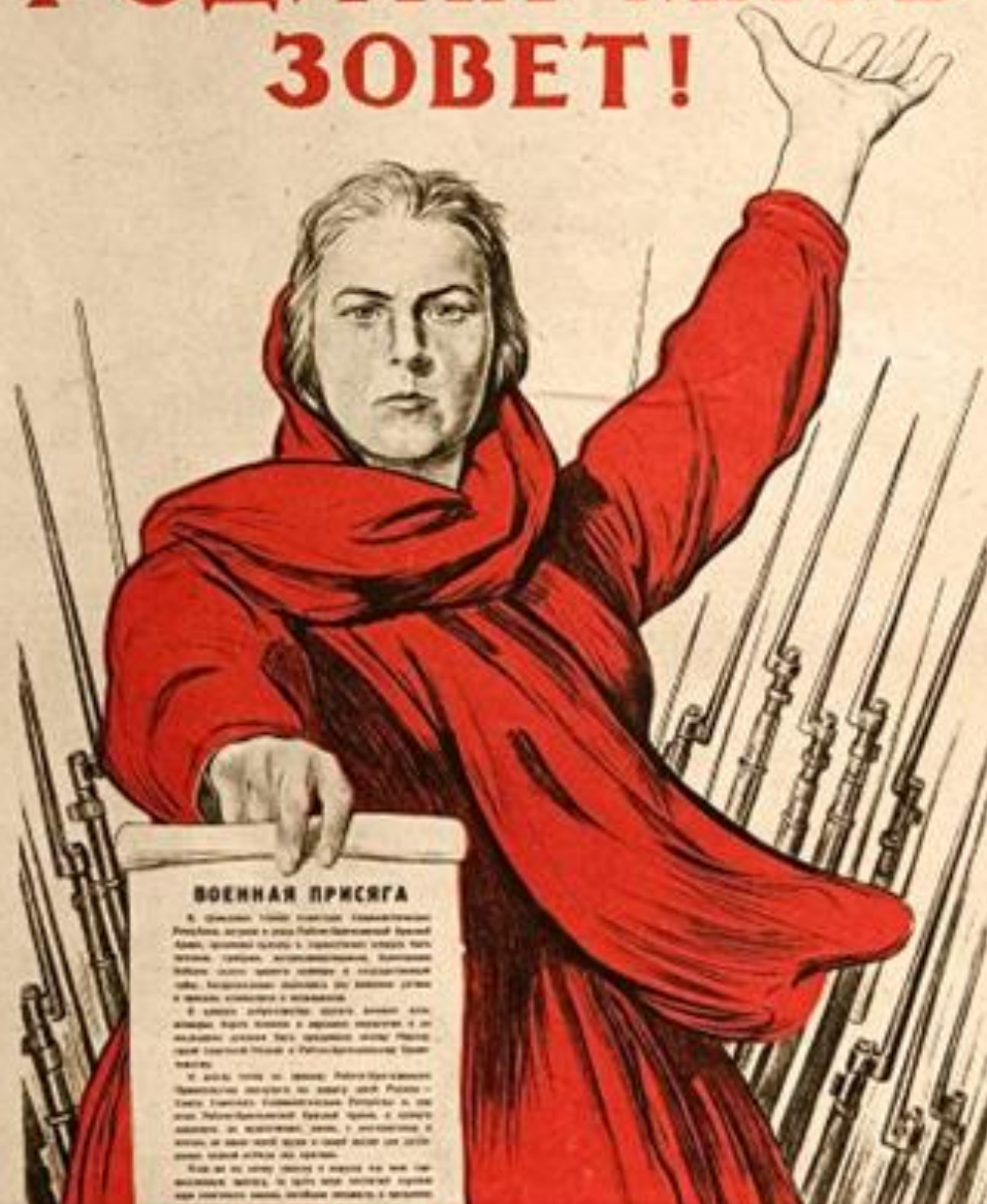
М.И. Тоидзе. "Родина-мать зовет"