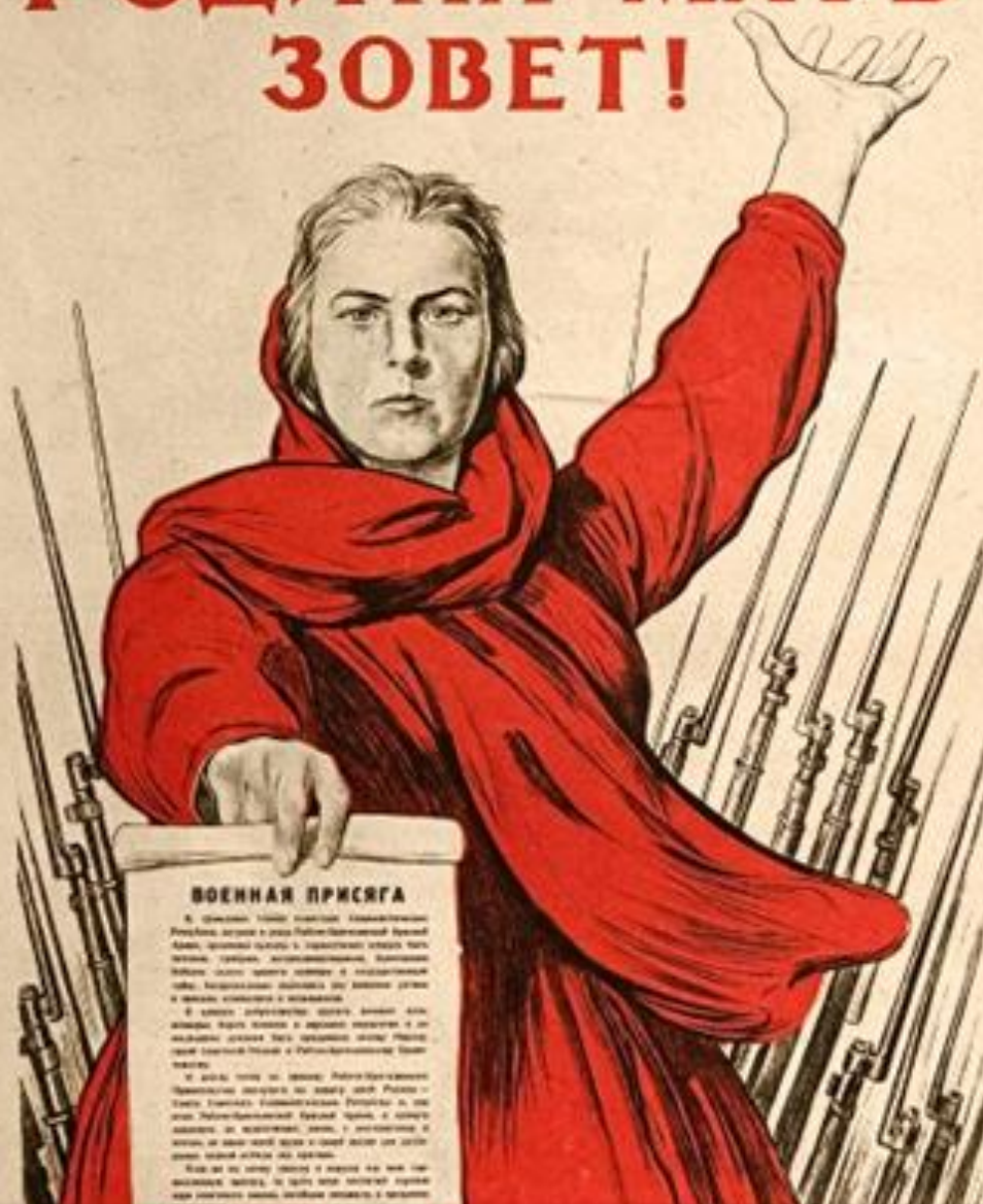
М.И. Тоидзе. "Родина-мать зовет"