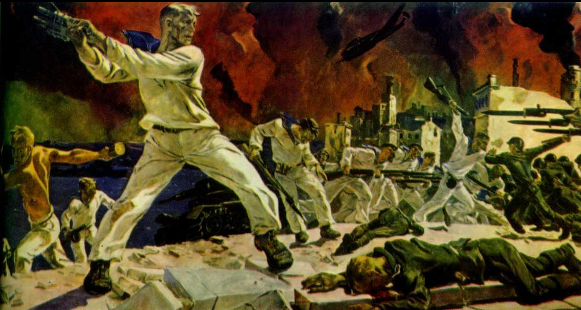
А.А. Дейнека. Оборона Севастополя" (1942)