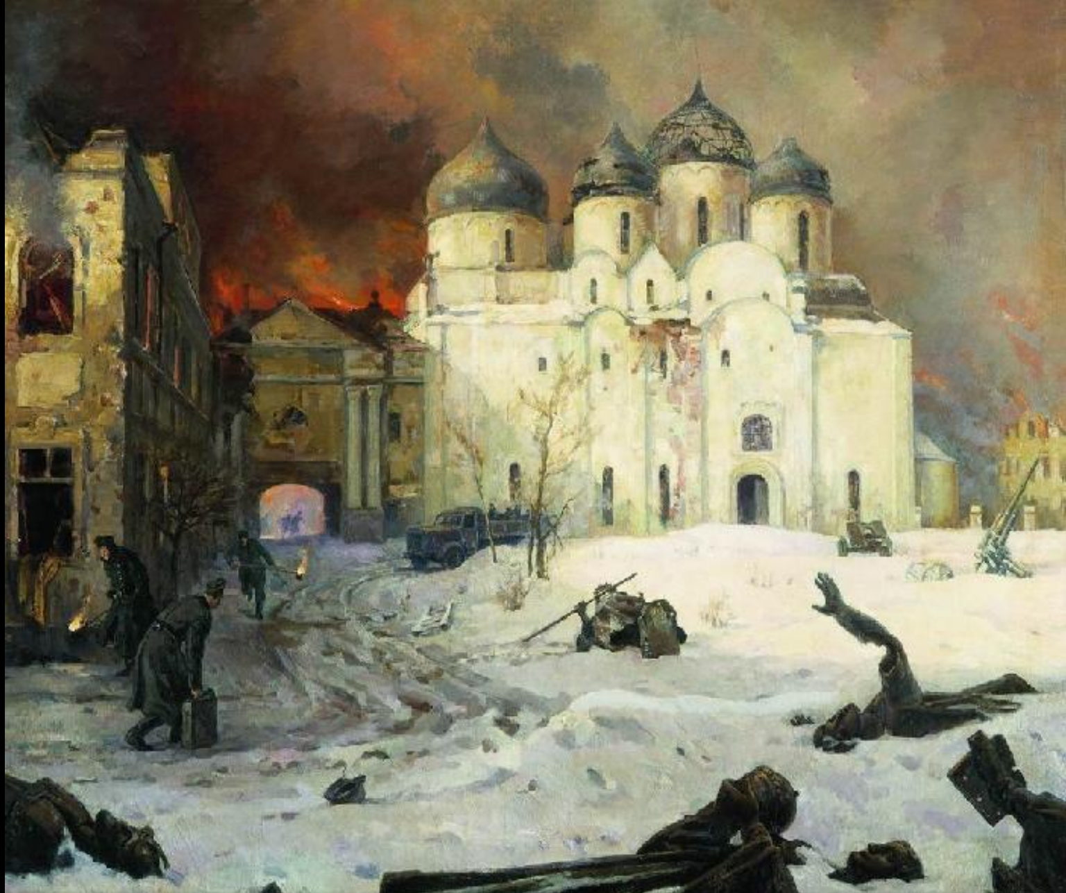
Кукрыниксы. Бегство фашистов из Новгорода (1944 – 1946)