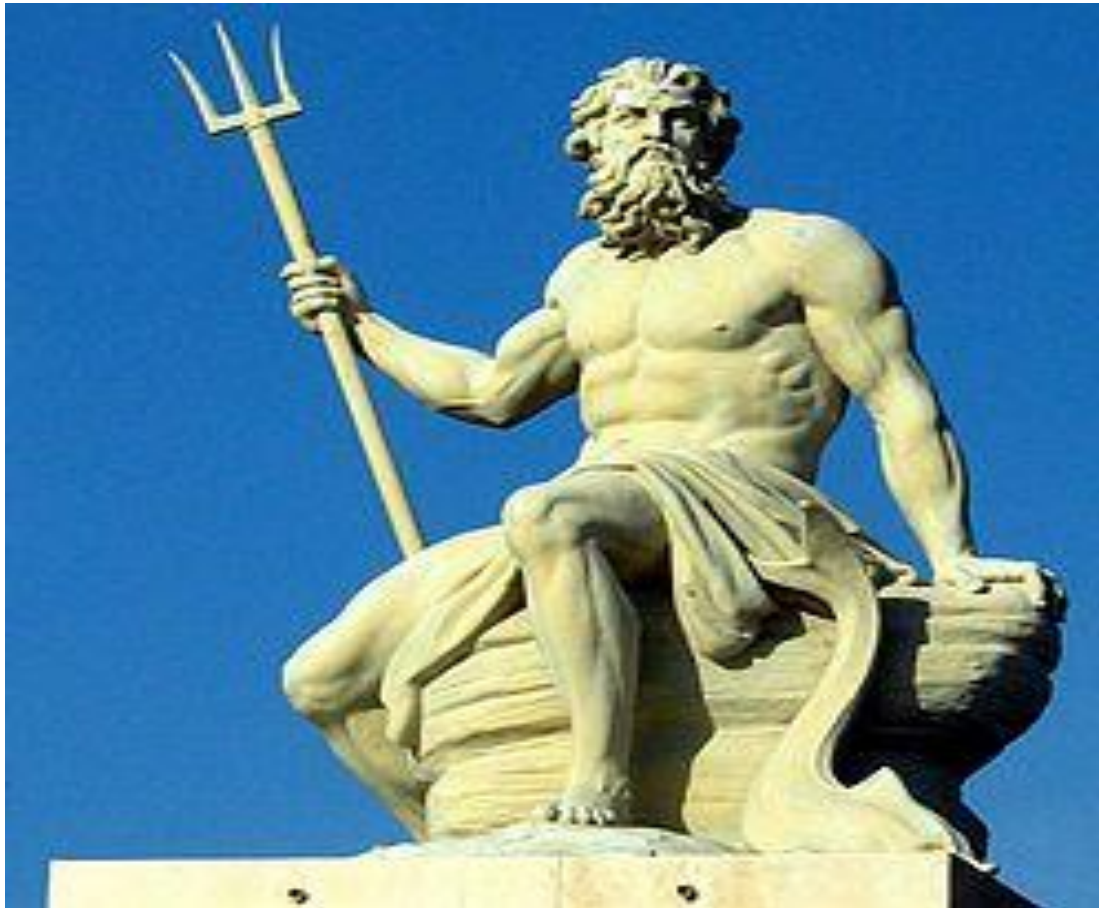
Посейдон (бог морей). Копенгаген. 2005.