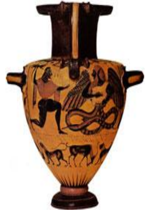
Битва Зевса Битва Зевса с Тифоном