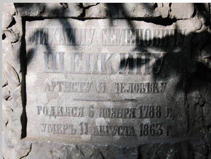
надпись на надгробном камне М.С Щепкина

11 августа 1863 года в Ялте, он похоронен на Пятницком кладбище в Москве.