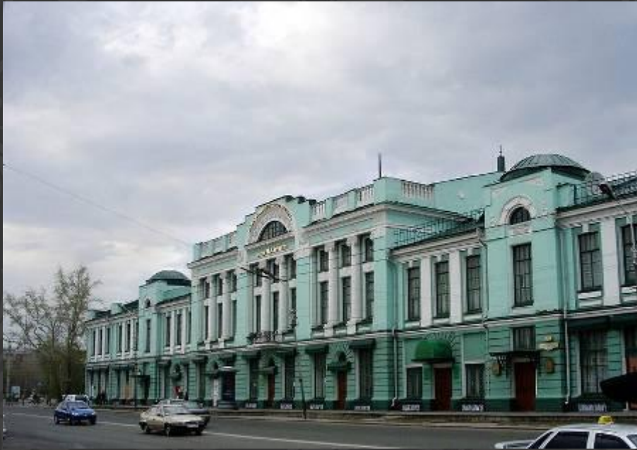
Музей изобразительных искусств им. Врубеля. Омск

В Омске на левом берегу Оми есть сквер Врубеля. Памятник в Омске возле Музея изобразительных искусств.