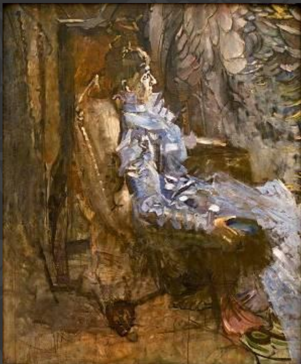
Дама в лиловом. Портрет Н. И. Забелы -Врубель