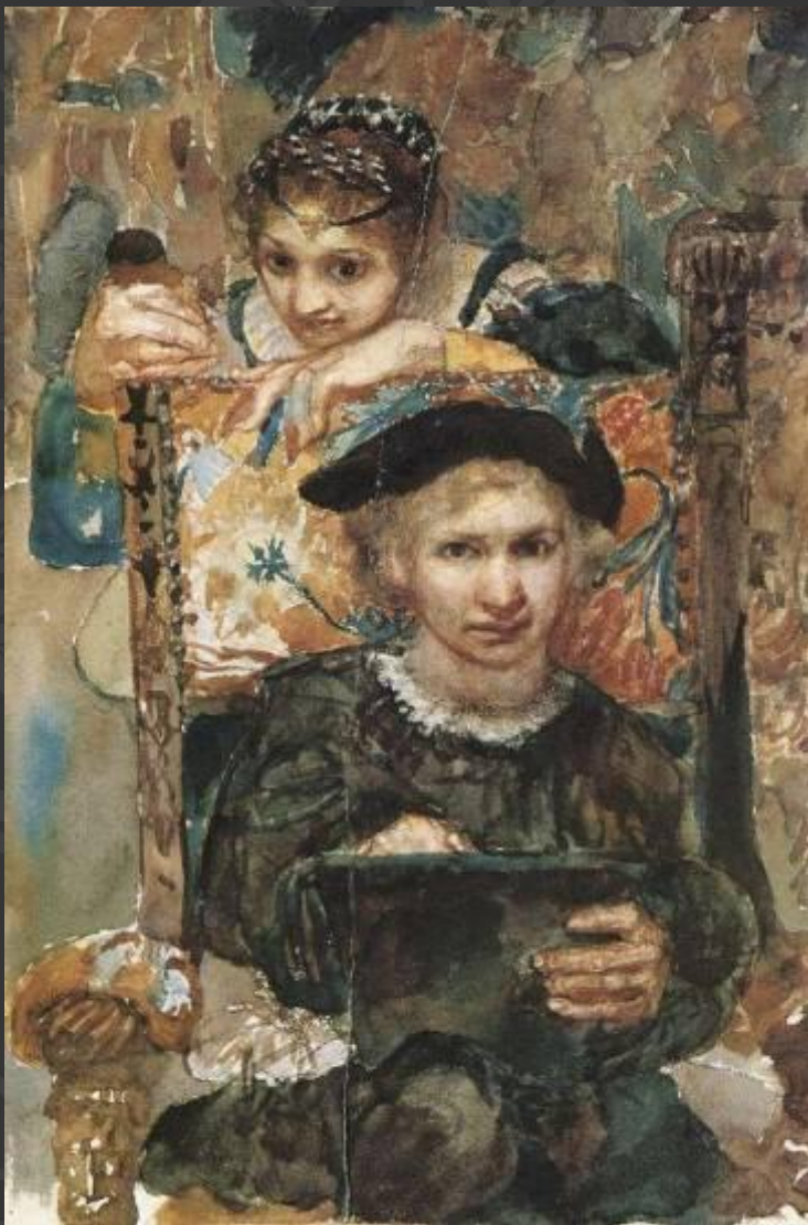
Гамлет и Офелия