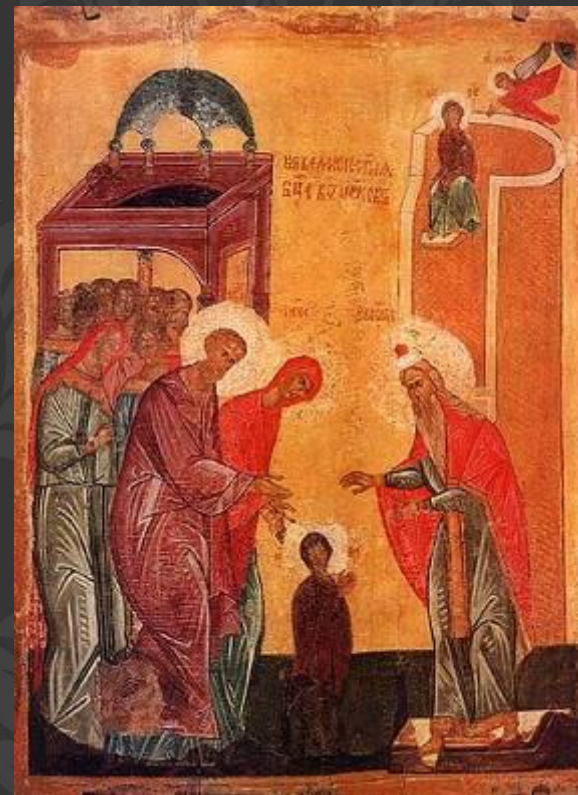
«Введение во храм»

Осенью 1880 года Михаил был зачислен вольнослушателем в Императорскую Академию художеств. Он сразу начал выделяться среди прочих студентов необычностью стиля и оригинальным взглядом на классические сюжеты — достаточно посмотреть на его первые акварели — «Введение во храм» и «Пирующие римляне». Познакомился и сблизился с Валентином Серовым. Наравне с Серовым, Врубель был одним из самых преданных и одним из самых отличаемых учеников.