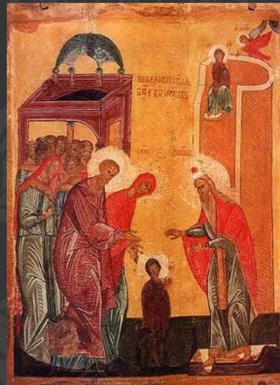
«Введение во храм»

Осенью 1880 года Михаил был зачислен вольнослушателем в Императорскую Академию художеств. Он сразу начал выделяться среди прочих студентов необычностью стиля и оригинальным взглядом на классические сюжеты — достаточно посмотреть на его первые акварели — «Введение во храм» и «Пирующие римляне». Познакомился и сблизился с Валентином Серовым. Наравне с Серовым, Врубель был одним из самых преданных и одним из самых отличаемых учеников.