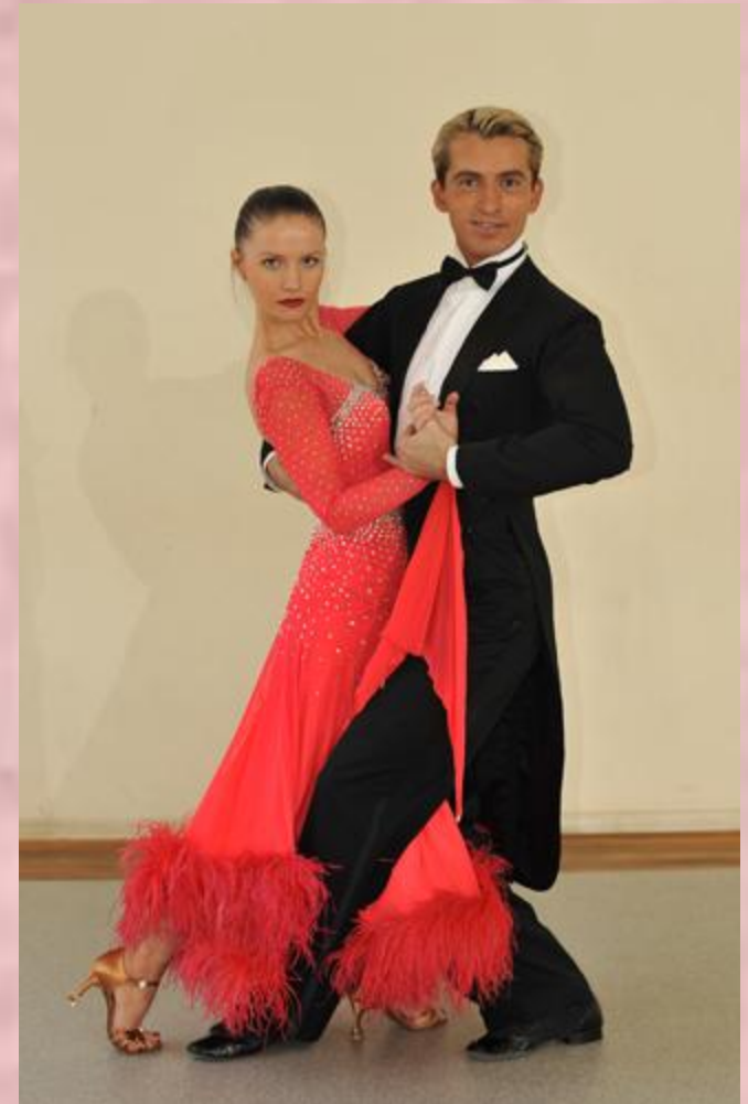
Бальные наряды европейской программы