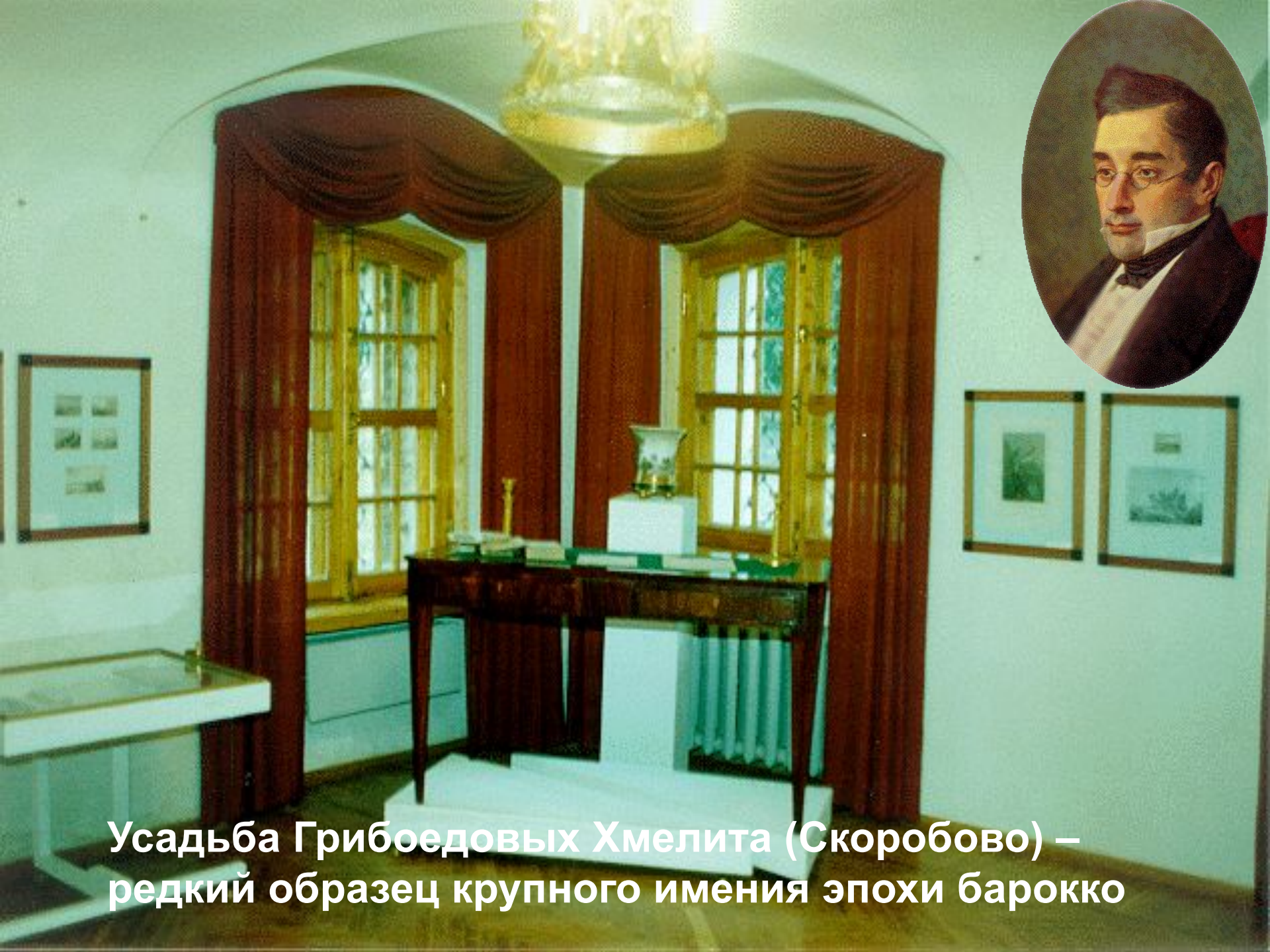
Усадьба Грибоедовых Хмелита (Скоробово) – редкий образец крупного имения эпохи барокко