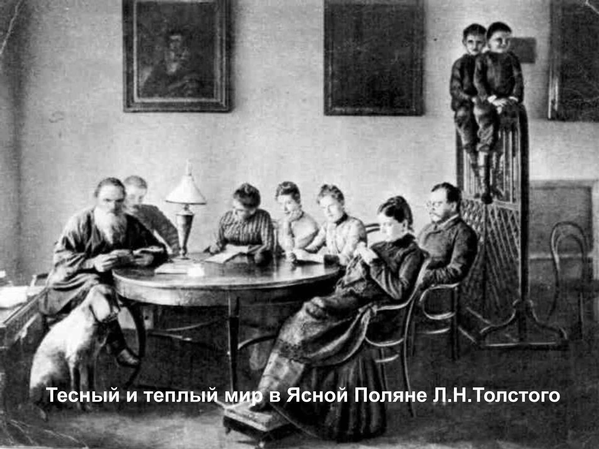
Тесный и теплый мир в Ясной Поляне Л.Н.Толстого