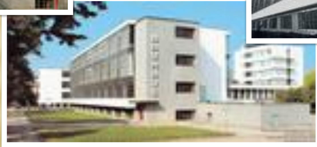
Здание Баухауза в Дессау, арх. В. Гропиус