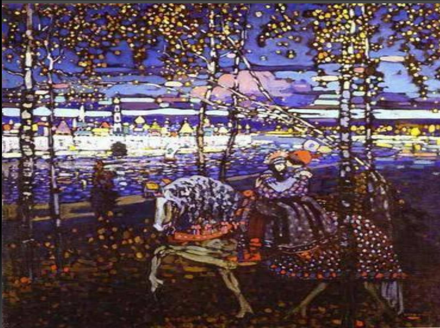
Кандинский Василий «Двое на лошади» 1906 г.