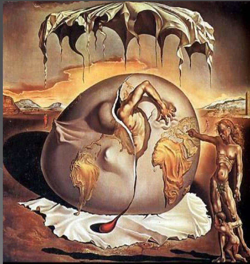
Геополитический младенец, наблюдающий рождение нового человека, 1943. Холст, масло.

Сальвадор Дали «Геополитический младенец наблюдающий рождение нового человека» 1943г.