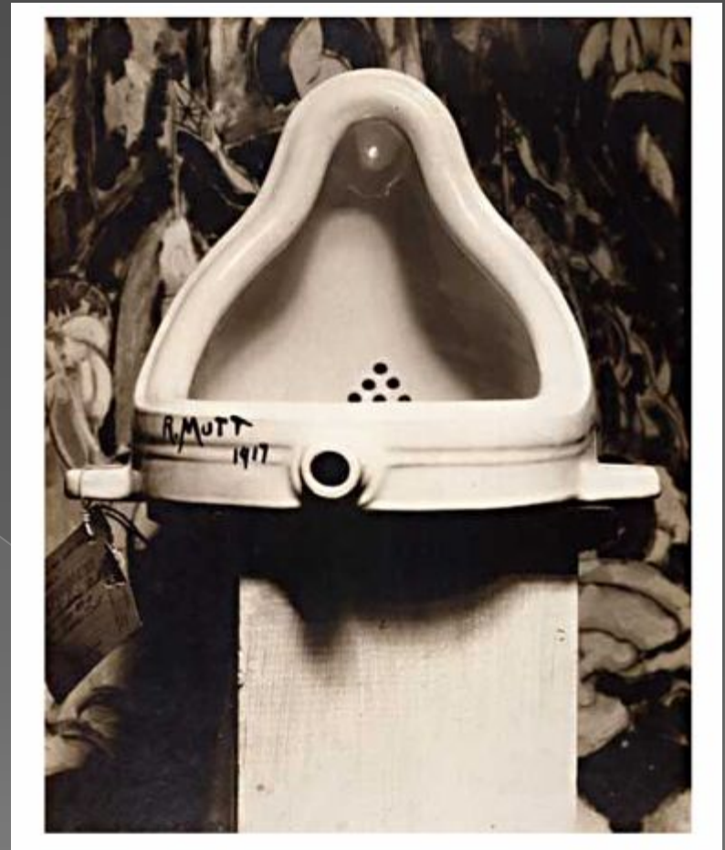
Марсель Дюшан «Фонтан»