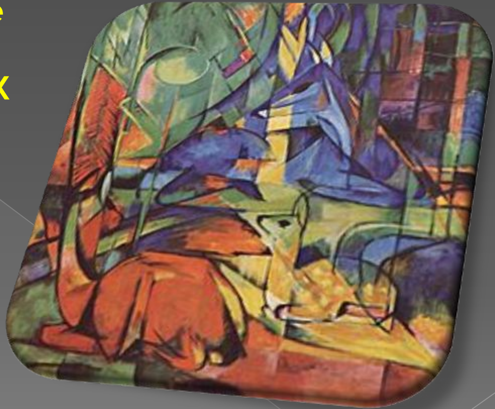
Франц Марк «Олени в лесу».