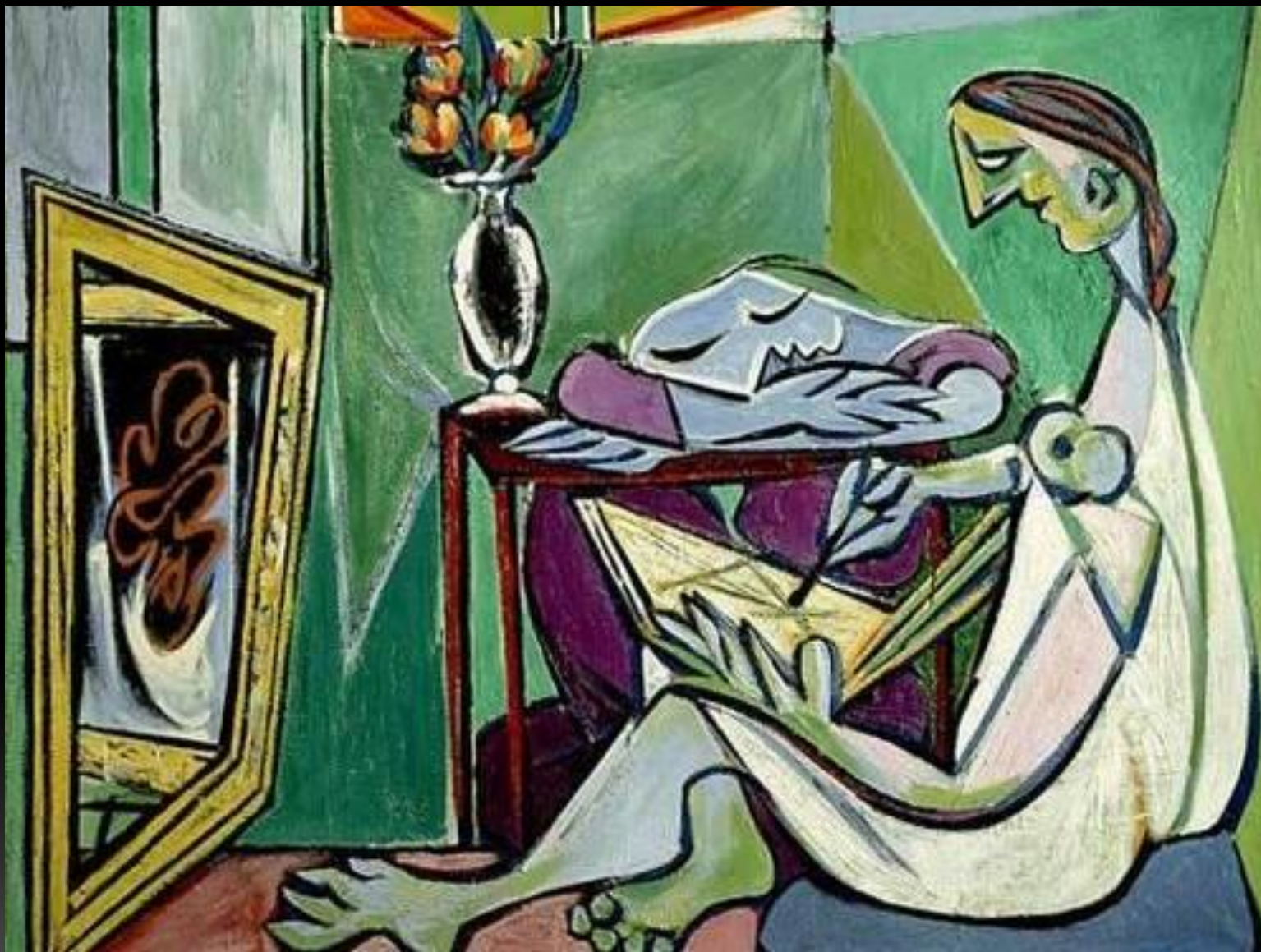
Пикассо Пабло «Муза».