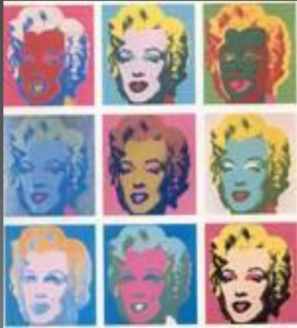
Энди Уорхол «Мэрлин Монро» 1967г.