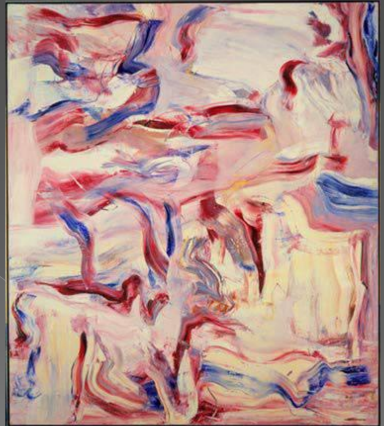
Виллем де Кунинг Без названия