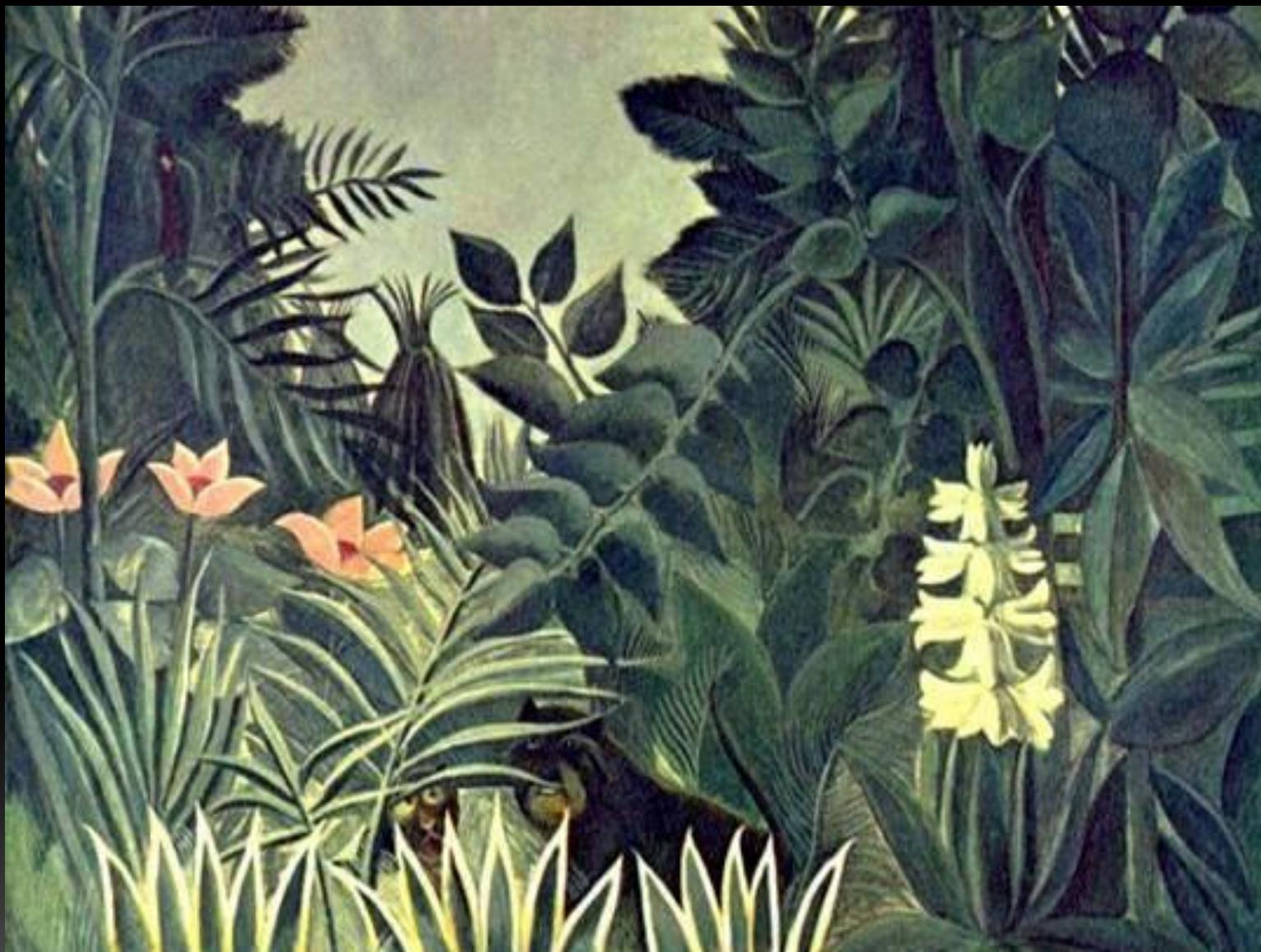
Анри Руссо «Экваториальные джунгли»