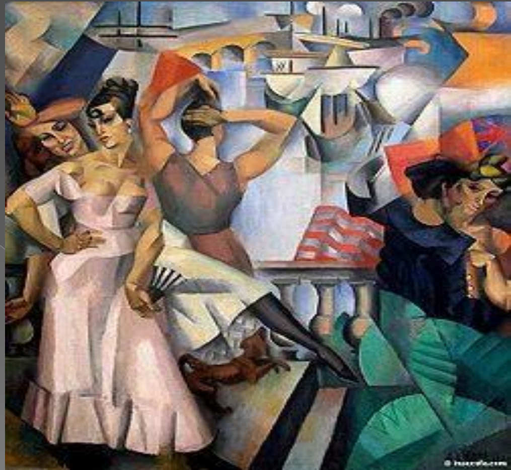
Андре Лоте «Париж»