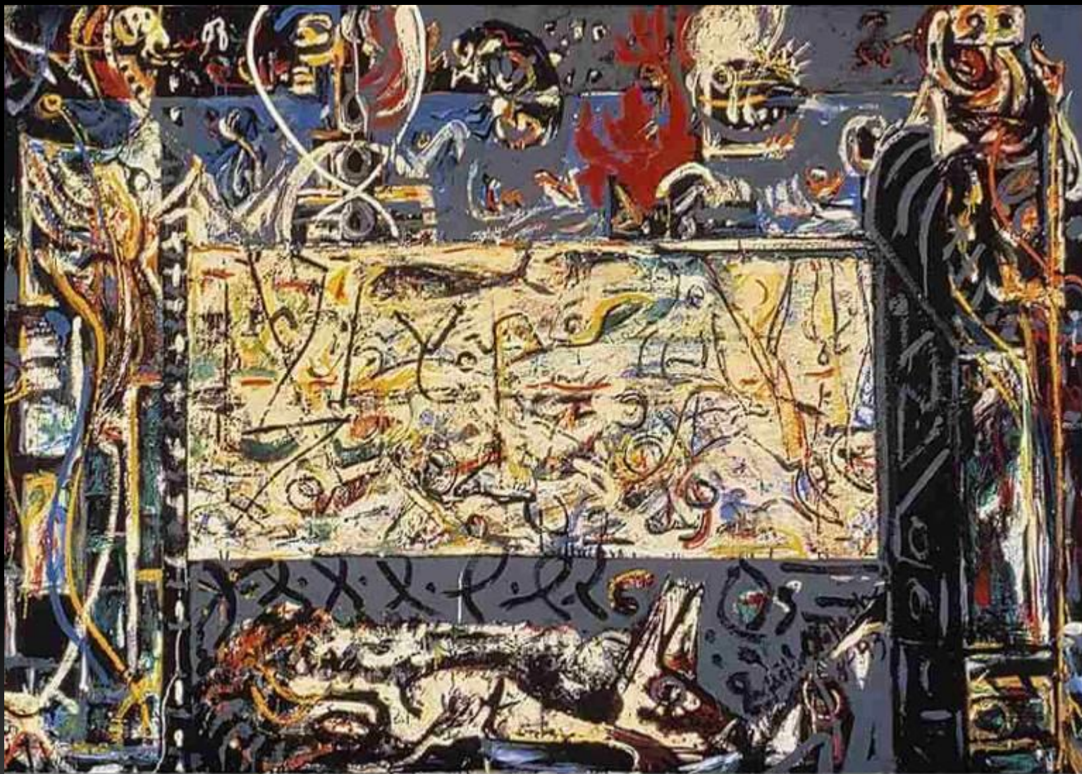
Jackson Pollock - Guardians of the Secret , 1943; 48 3/8 in. x 75 3/8 in.; oil on canvas; Collection SFMOMA; Albert M. Bender Collection, Albert M. Bender Bequest Fund purchase; © Pollock-Krasner Foundation / Artists Rights Society (ARS), New York.