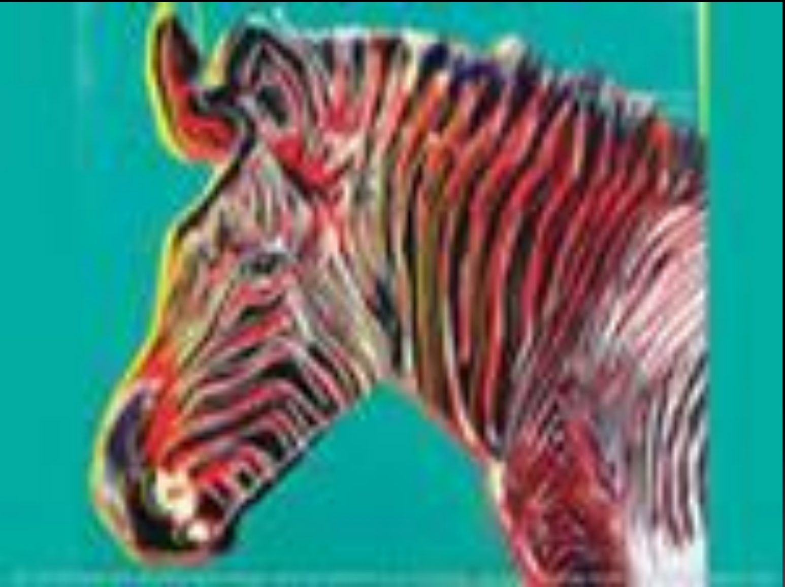
Энди Уорхол «Зебра» 1983г.