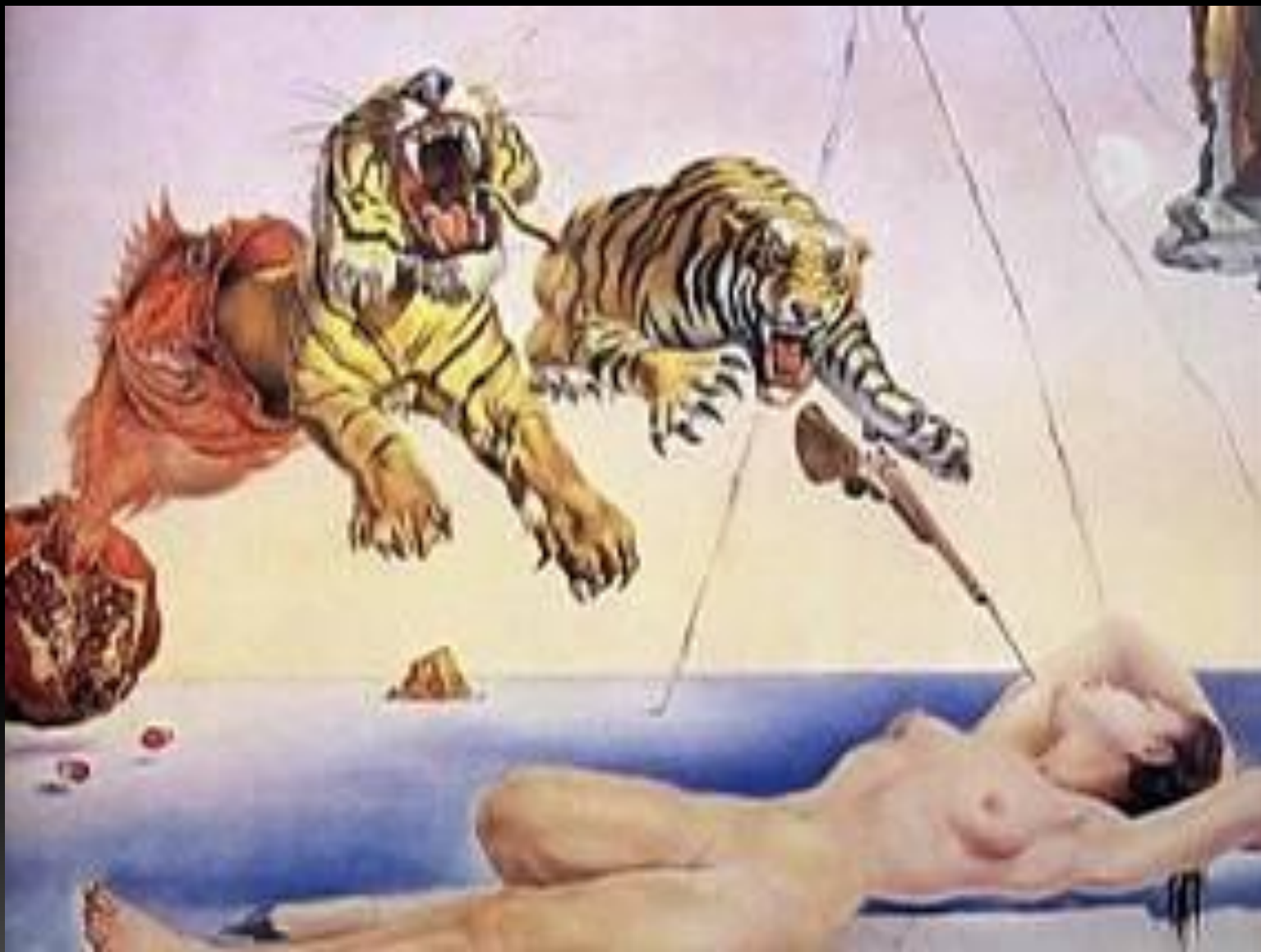
Сальвадор Дали «Сон, навеянный полётом пчелы вокруг граната, за миг до пробуждения» 1943г.