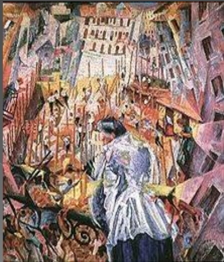
Умберто Боччони «Улица входит в дом» 1911г.