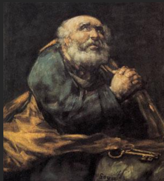
Ф. Гоя. Раскаяние святого Петра. 1825