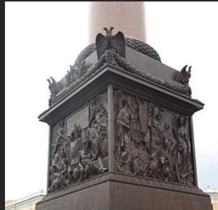
О. Монферран. Александровская колонна. Фрагменты постамента. 1834