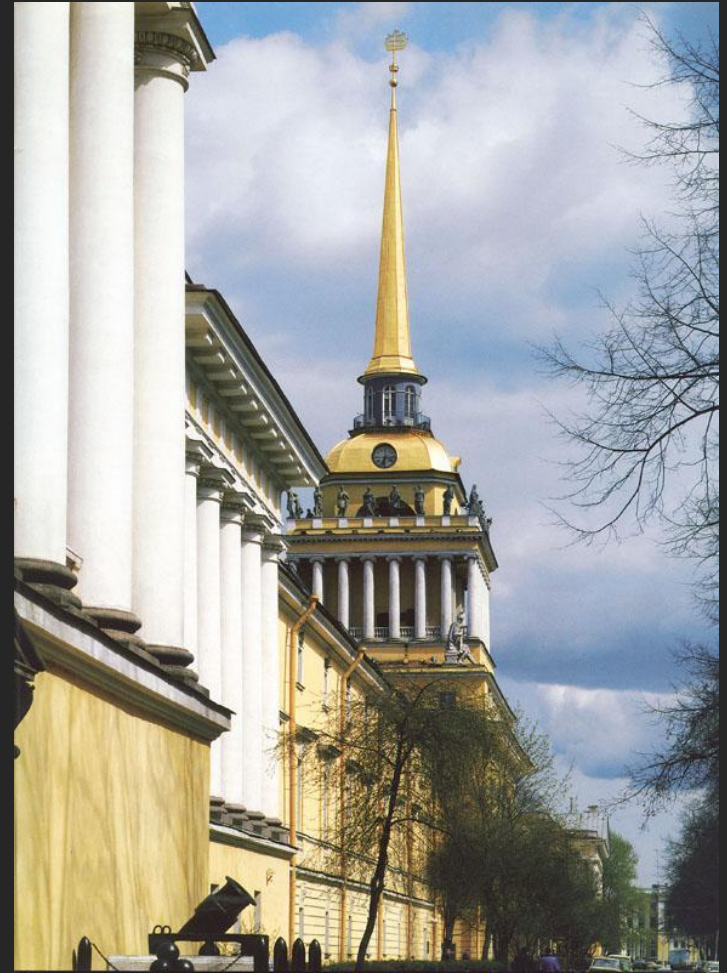
Коробов, А. Захаров, скульпторы И. Тербенев, Ф. Щедрин Адмиралтейство. 1728–1823