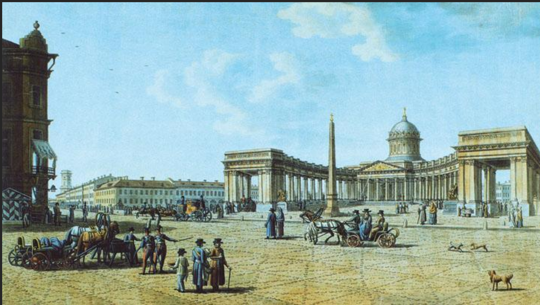
Б. Патерсен. Вид Казанского собора со стороны Невского проспекта. Конец XVIII в.