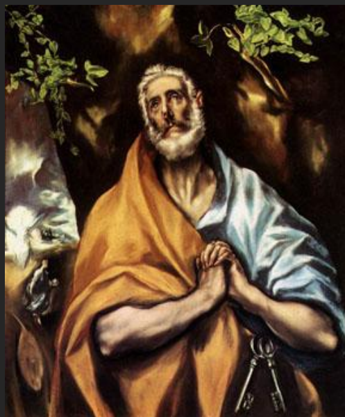
Эль Греко. Раскаяние святого Петра. 1605

Количество ключей у святого Петра – это метафора, с помощью которой творцы искусства пытаются подсказать нам, что путь в райские кущи не один.