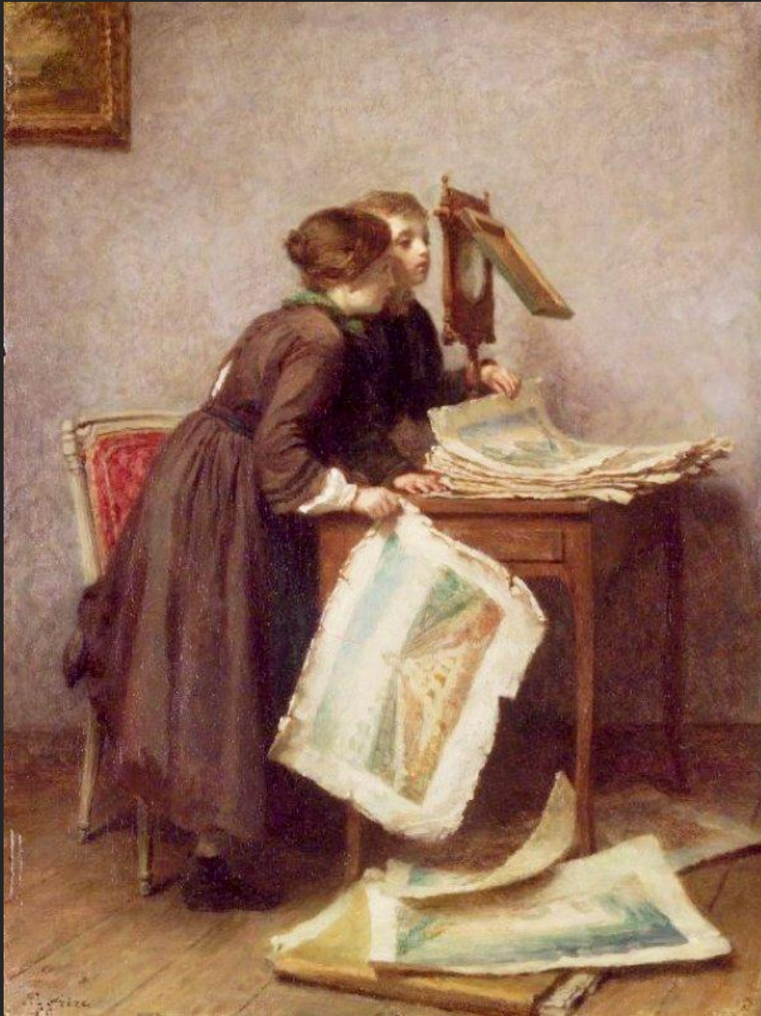
Э. Фрер. Дети, рассматривающие гравюры. 1855

Многоканальная модель освоения культурного наследия