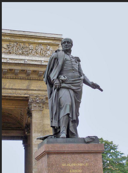
Б. Орловский, архитектор В. Стасов Памятник М.Б. Барклаю де Толли 1837