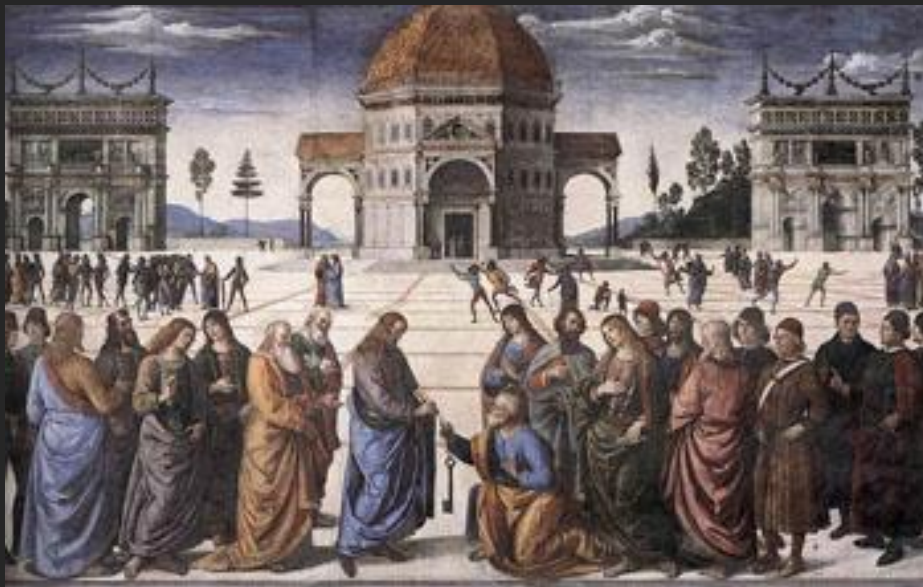
П. Перуджино Передача ключей апостолу Петру 1482

Количество ключей у святого Петра – это метафора, с помощью которой творцы искусства пытаются подсказать нам, что путь в райские кущи не один.