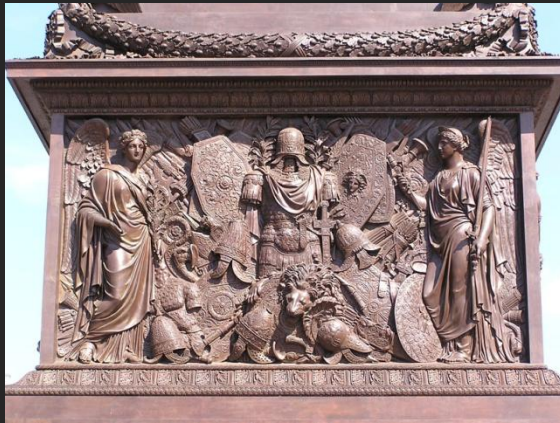
О. Монферран. Александровская колонна. Фрагменты постамента. 1834