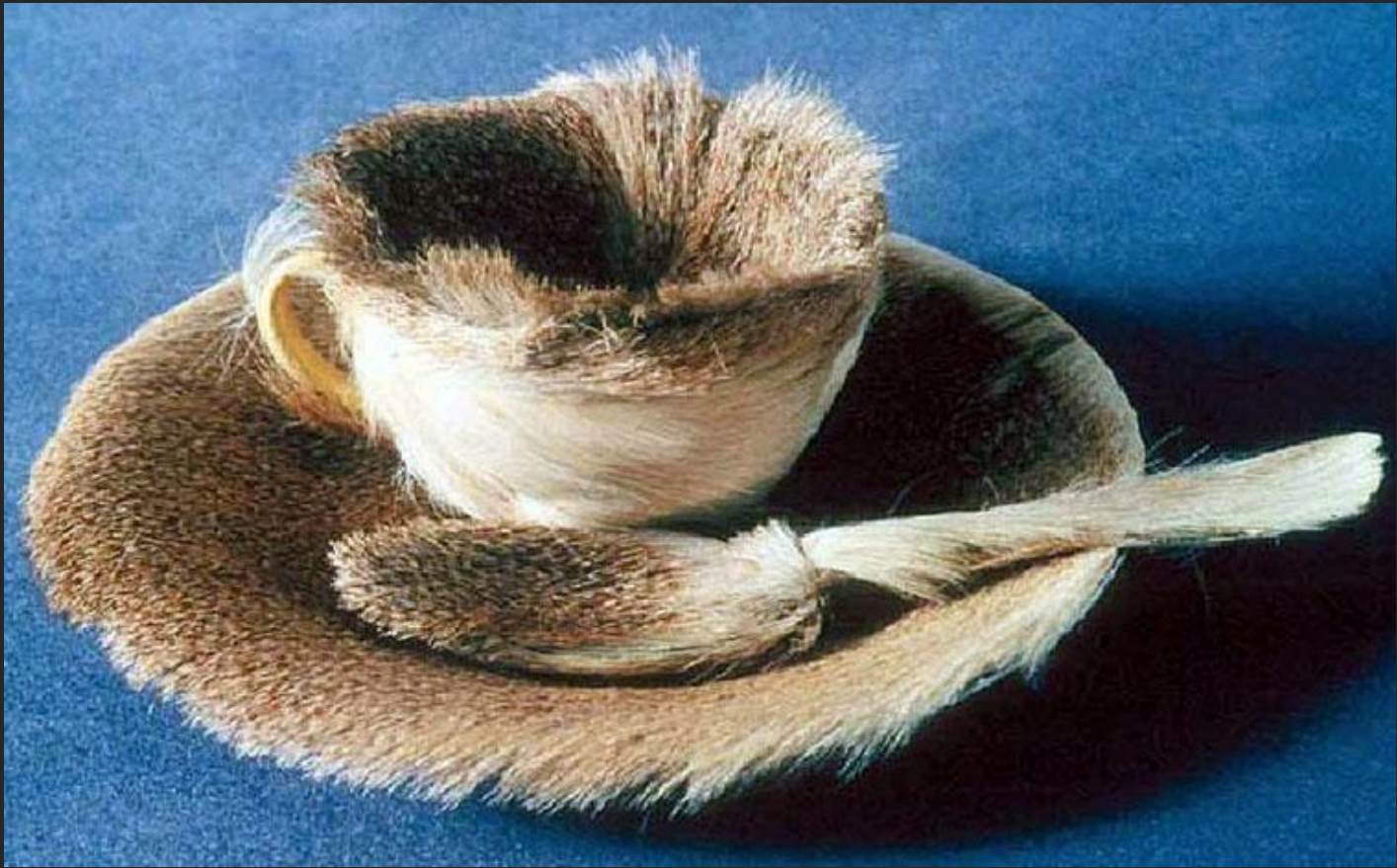
М. Оппенгейм. Покрытая мехом чашка. 1936

«Общение» с произведениями искусства подсказывает, что для произведений искусства на первый план выступает не утилитарная, а символическая функция.