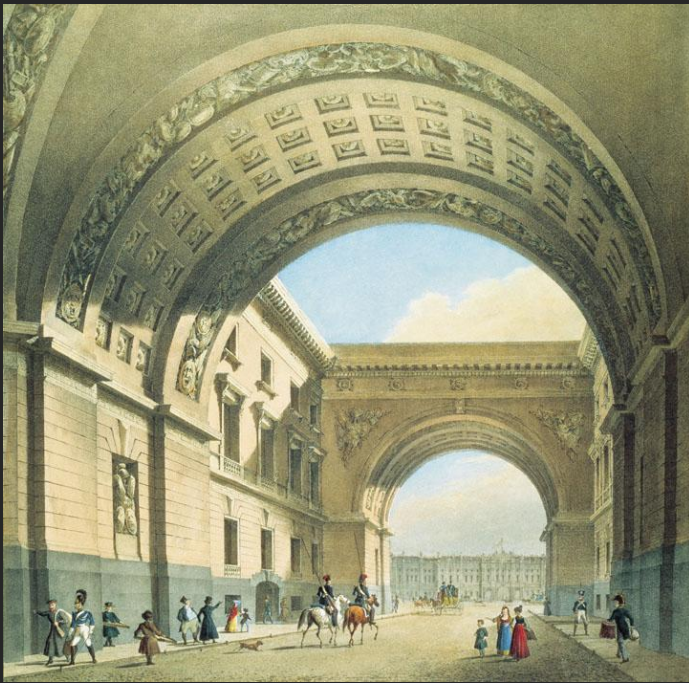
К. Бегров Вид на арку Главного штаба 1820