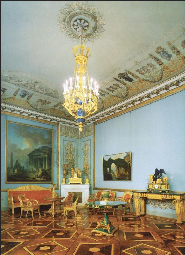
К. Росси. Генеральный штаб. Жилые апартаменты К. Нессельроде. 1823

Группа 2. Музейное пространство (выставка «Под знаком орла. Искусство ампира» в Государственном Эрмитаже)