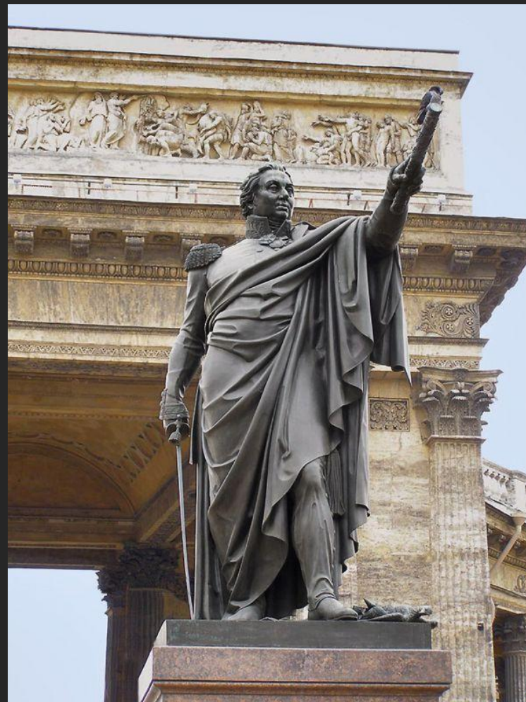
Б. Орловский, архитектор В. Стасов Памятник М.И.Кутузову. 1837