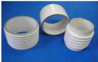
Изоляторы для вакуумных дугогасительных камер