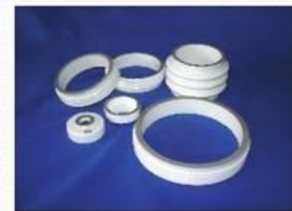
Изоляторы для корпусов силовых полупроводниковых приборов