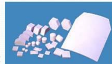
Керамические пластины для бронежилетов и бронетехники