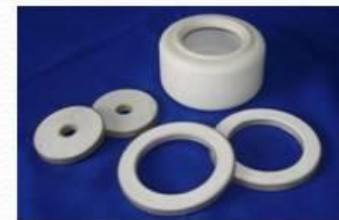
Керамика для СВЧ-изделий