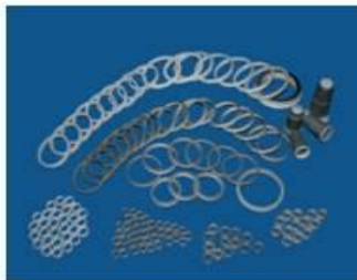
Изоляторы для электронно-оптических преобразователей приборов ночного видения