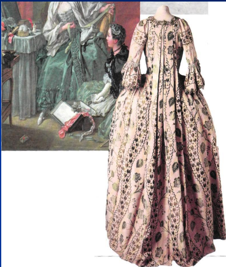
Платье на панье со складкой Ватто. 1755—1760 гг. Музей моды и костюма. Париж.