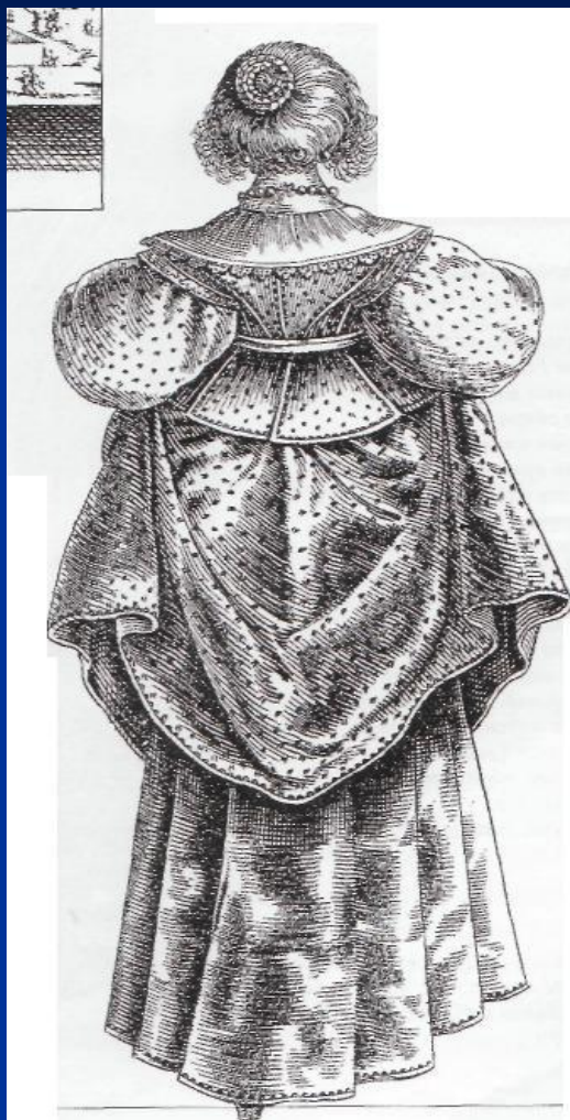
Жан де Сен - Ини. Женский костюм эпохи Людовика XIII. 1630 г. Национальная библиотека. Париж.