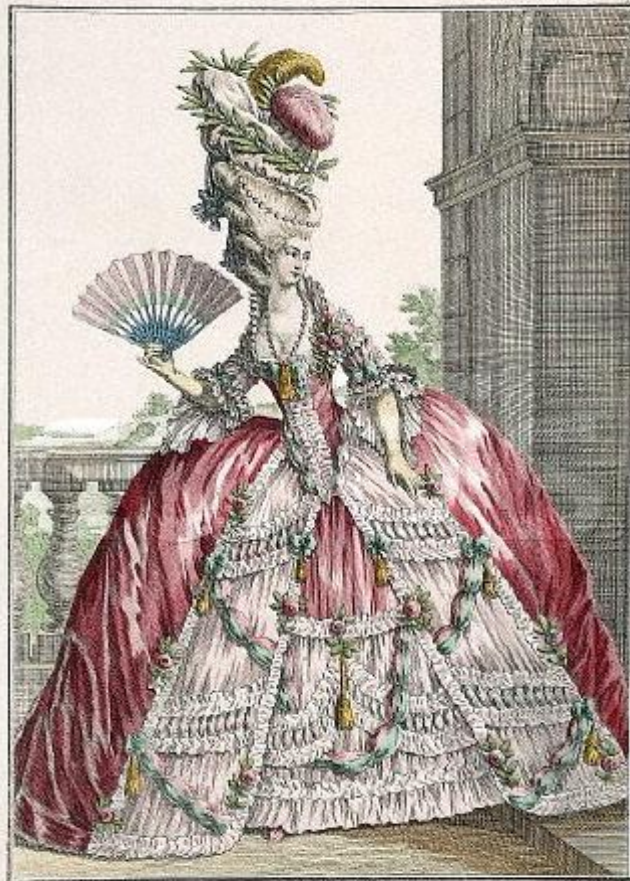
Jeune Dame de Qualité en grande Robe coiffée avec un Bonnet ou Poul elegant dit la Montagne.

A Paris chez les Comtesse et Marquis à la Ville de Commerce rue d'Anjou. A. P. D. R.