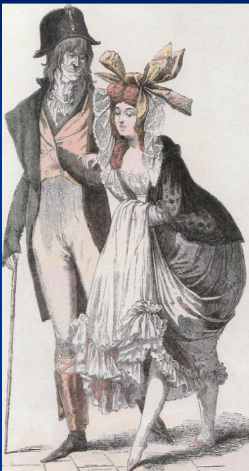
Карл Верне. Мервейёз. 1797 г. Национальная библиотека. Париж.