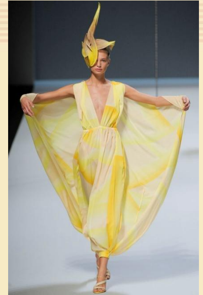
Шляпка в форме экзотической птицы 2011

Презентация подготовлена Е. Князевой по материалу А. Грачевой Журнал «Искусство» № 7–8/2014