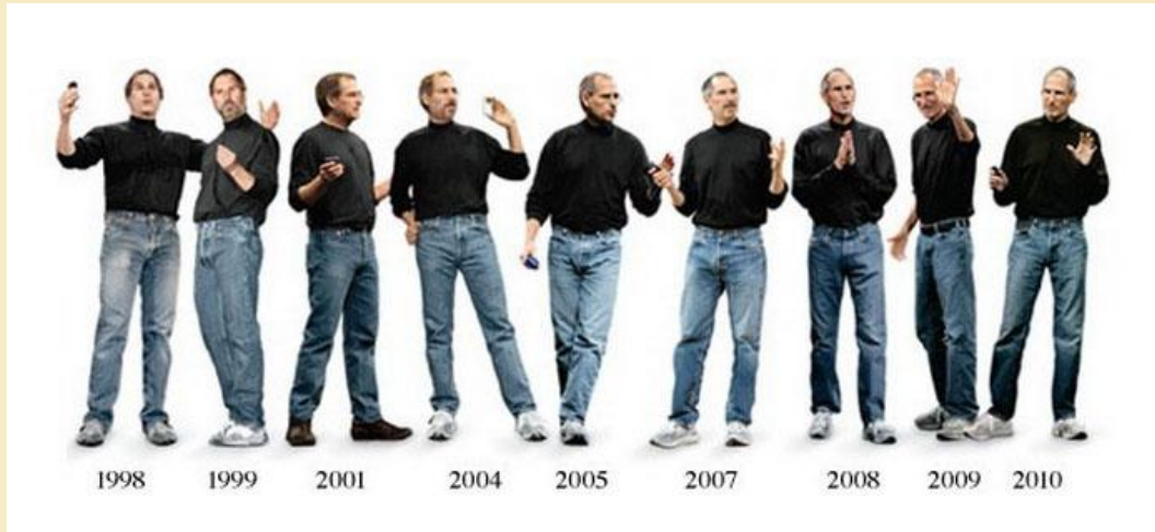
Стиль Стива Джобса

Черная водолазка Мияке, с которой не расставался Стив Джобс, вошла в энциклопедию моды, как маленькое черное платье Коко Шанель.