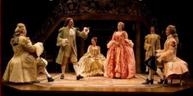
The Misanthrope at the Stratford Shakespeare Festival August 2011