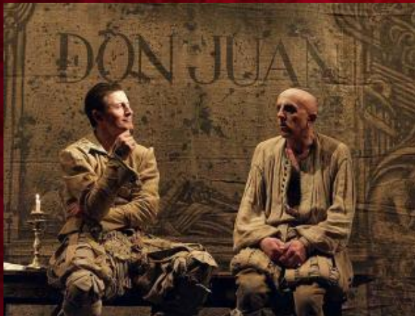
Kyiv Young Theatre, 1997

В основу пьесы Мольер положил испанскую легенду о Дон Жуане — неотразимом обольстителе женщин, попирающем законы божеские и человеческие. Образ Дон Жуана Мольер наделил бытовыми чертами французского аристократа XVII века — титулованного развратника, беспринципного, лицемерного, наглого и циничного.