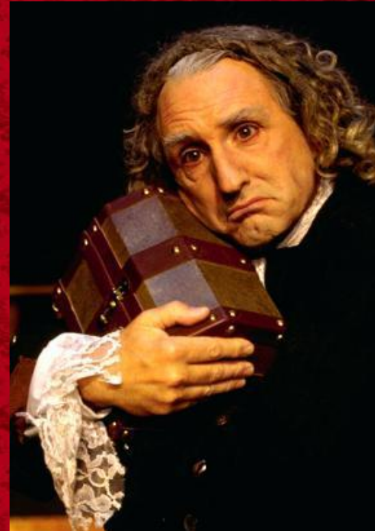
“The Miser” Shakespeare Theatre Company, Washington