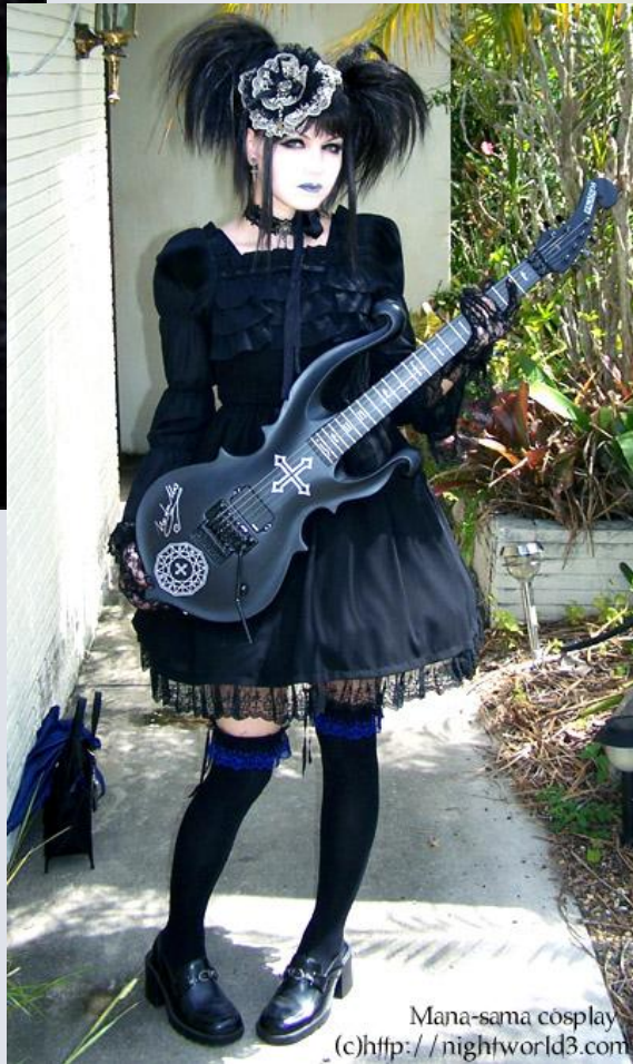
Mana-sama cosplay