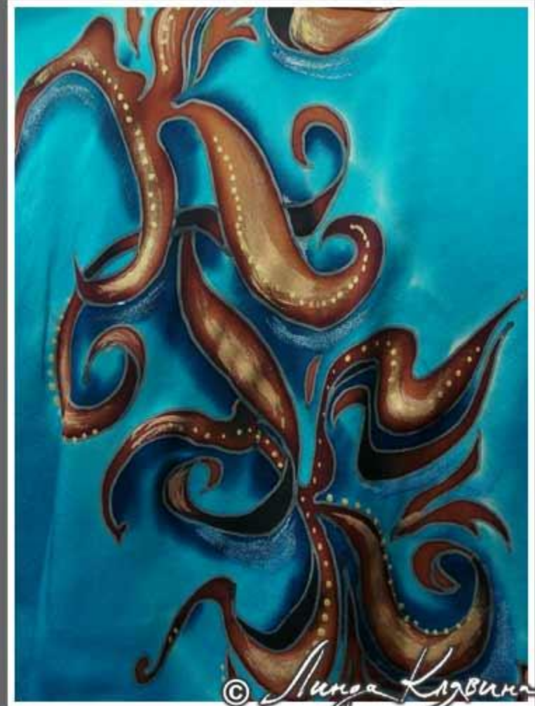
костюм для отдыха «Монограмма»