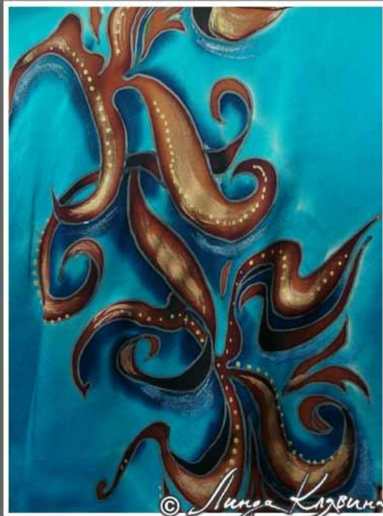
костюм для отдыха «Монограмма»