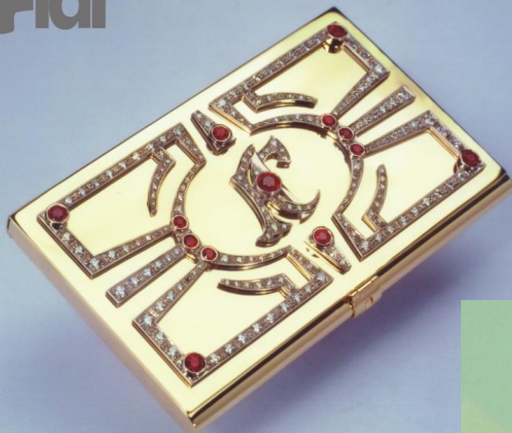
Визитница с Материалы: золото