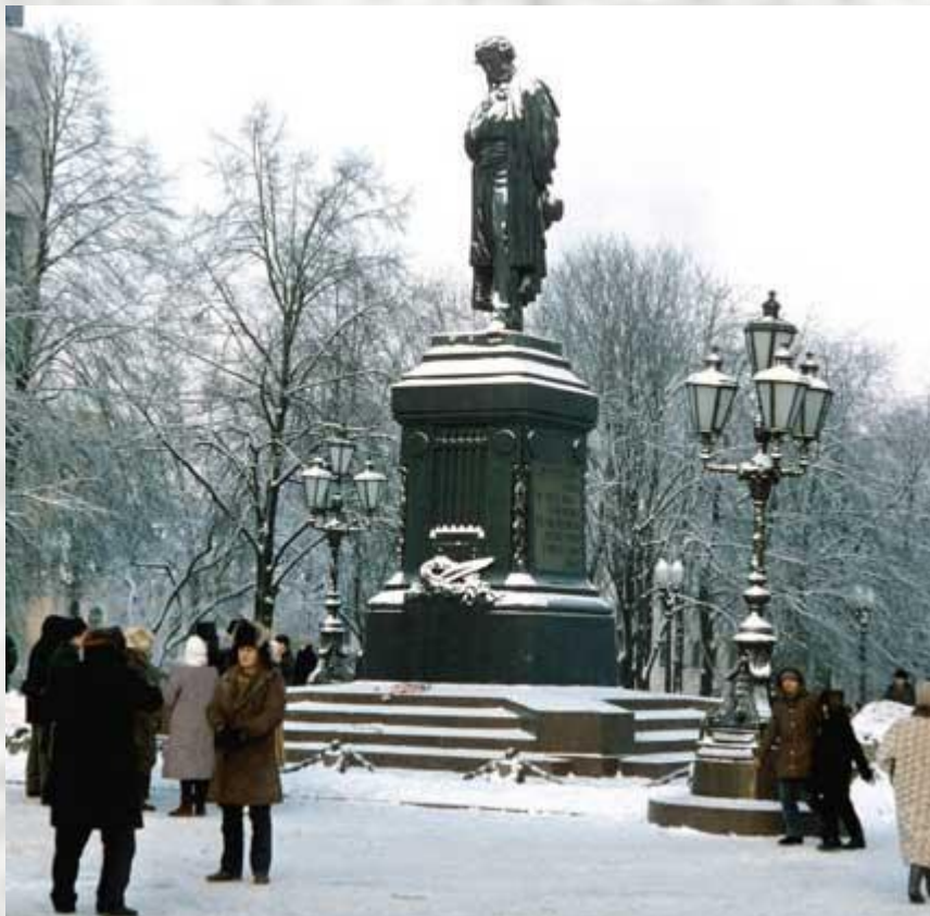
А. Опекушин. Памятник А.С.Пушкину (Москва)