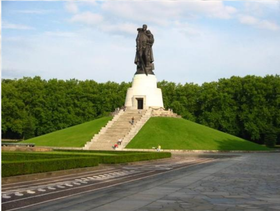
Е. Вучетич. Воин-освободитель в Трептов-парке (Берлин)