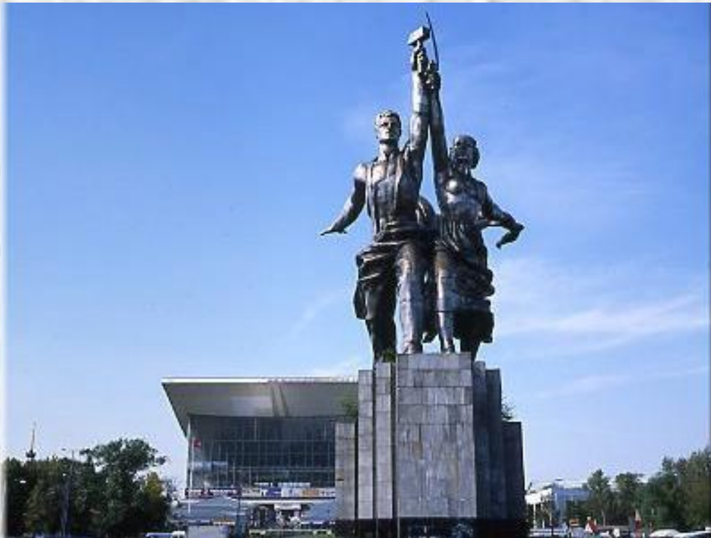
В.Мухина. Рабочий и колхозница (Москва)