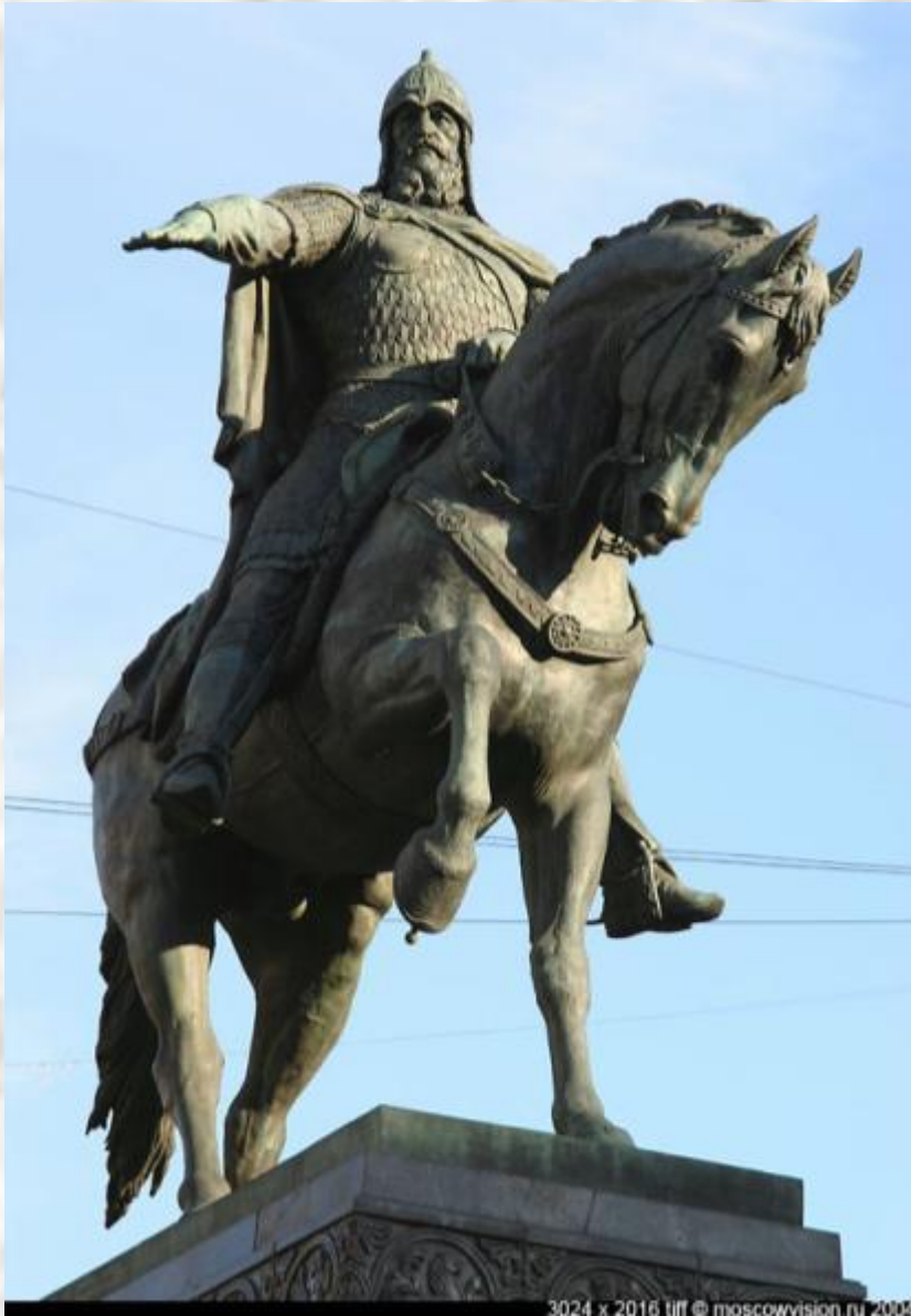
С. Орлов. Памятник Юрию Долгорукому (Москва);