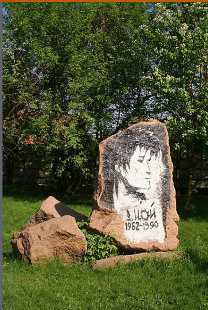
Сквер на пр.Свободный.