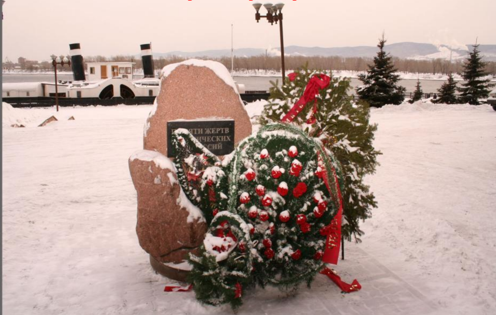
Памяти Жертв политических репрессий.