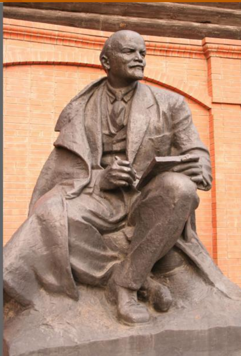
Памятник В. И. Ленину.