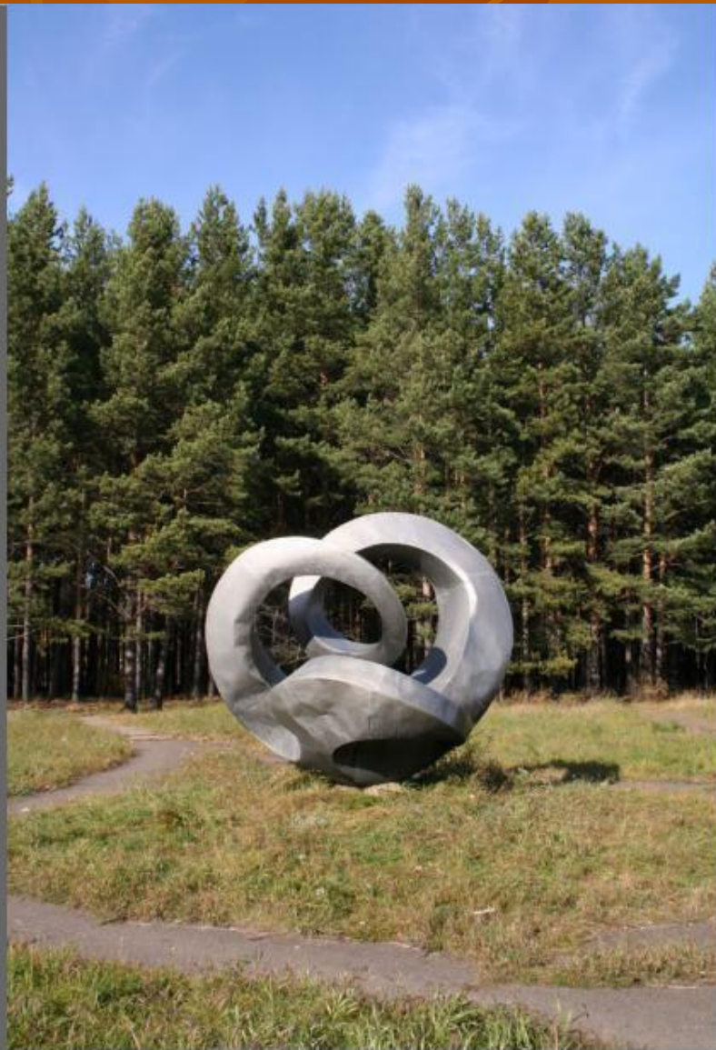
“Фантазия жестянщика”. Академгородок.