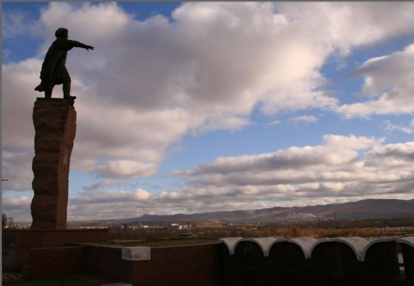
Памятник основателю города Воеводе А. Дубенскому.