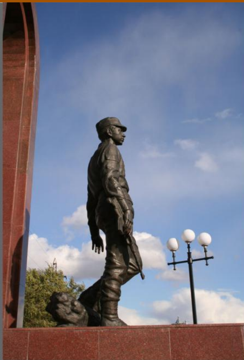
Мемориал Воинам -Интернационалистам.