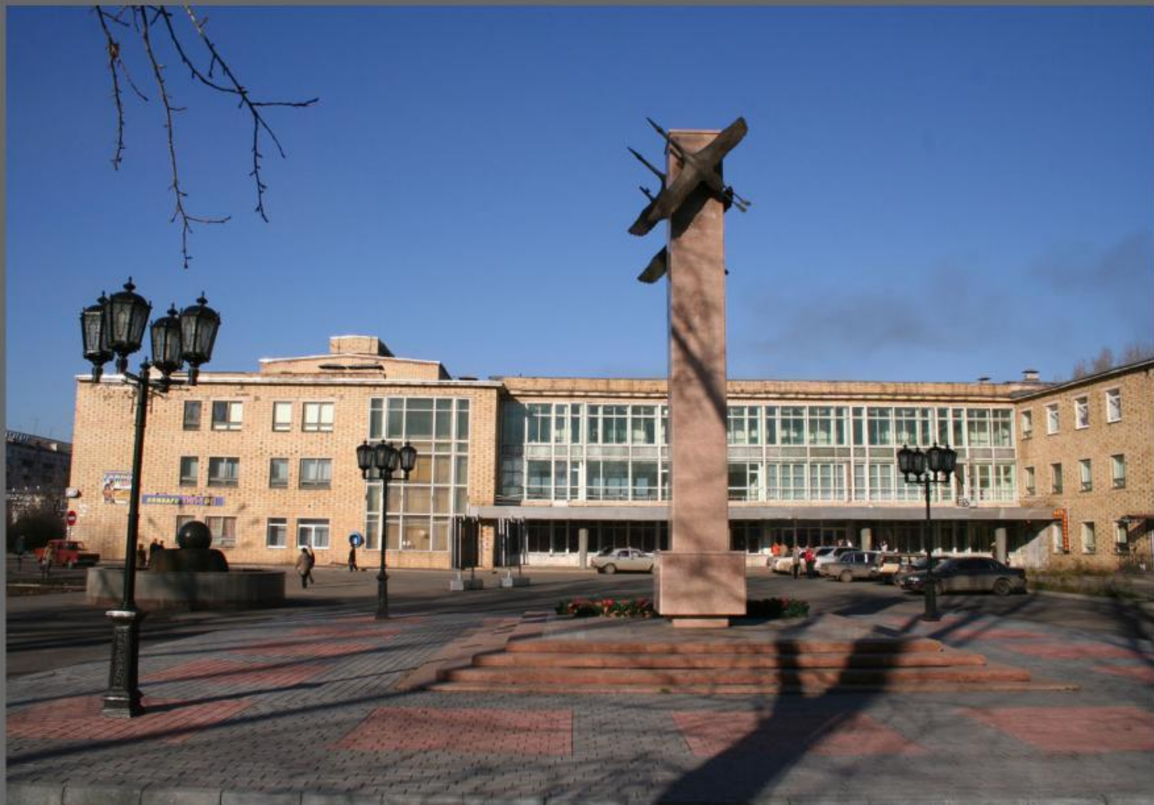
Площадь у Гор.Д.К.