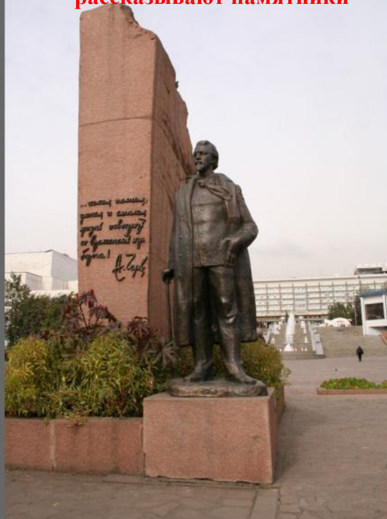
Памятник А. Чехову.

В нашей истории много было замечательных людей, о них также рассказывают памятники