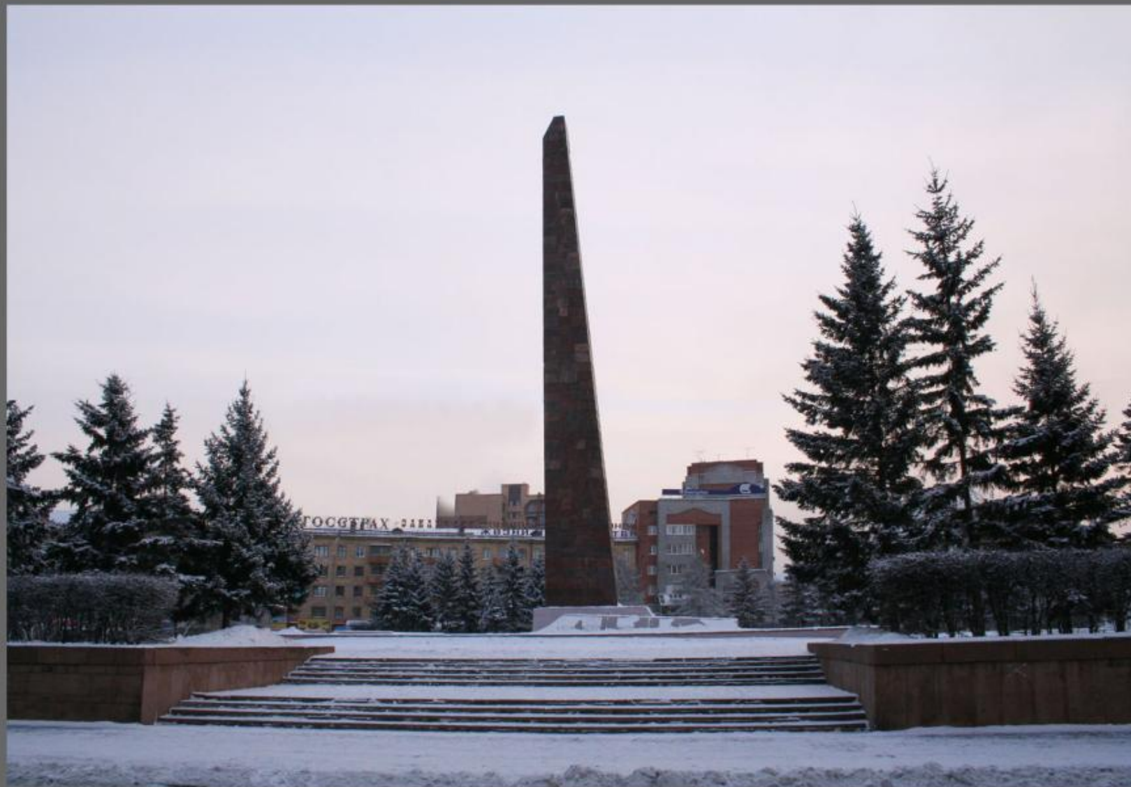
Павшим в борьбе за Советскую Власть.