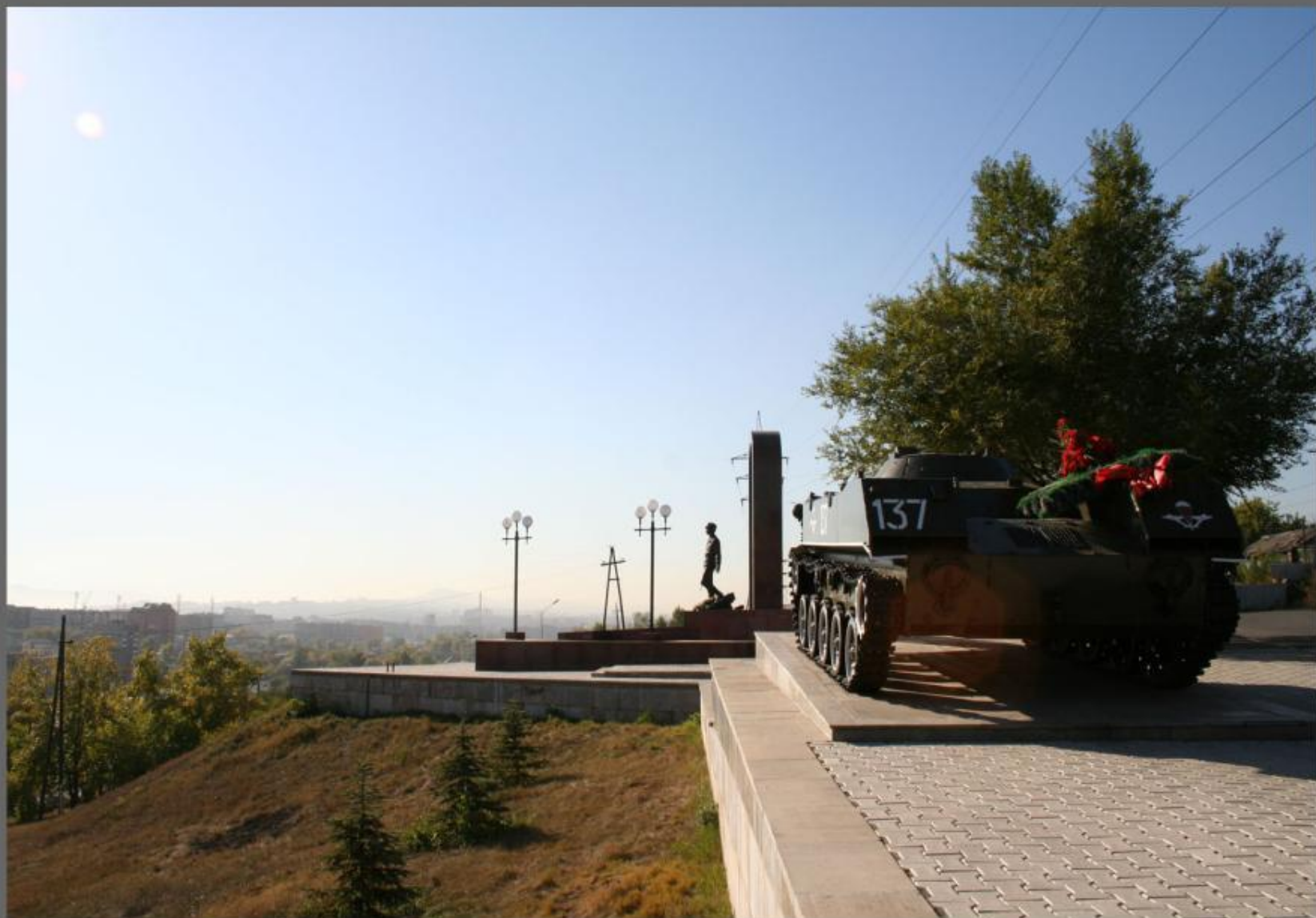
Мемориал Воинам -Интернационалистам.