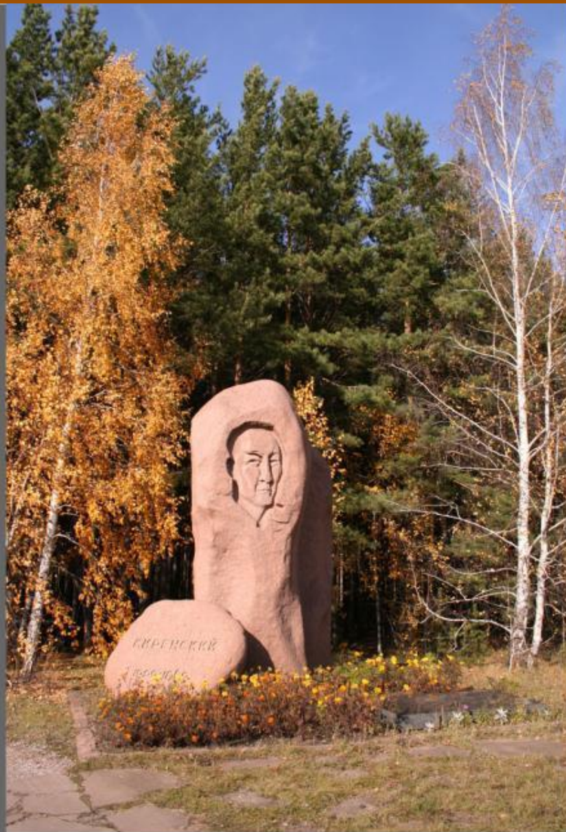
Памятник Академику Киренскому.