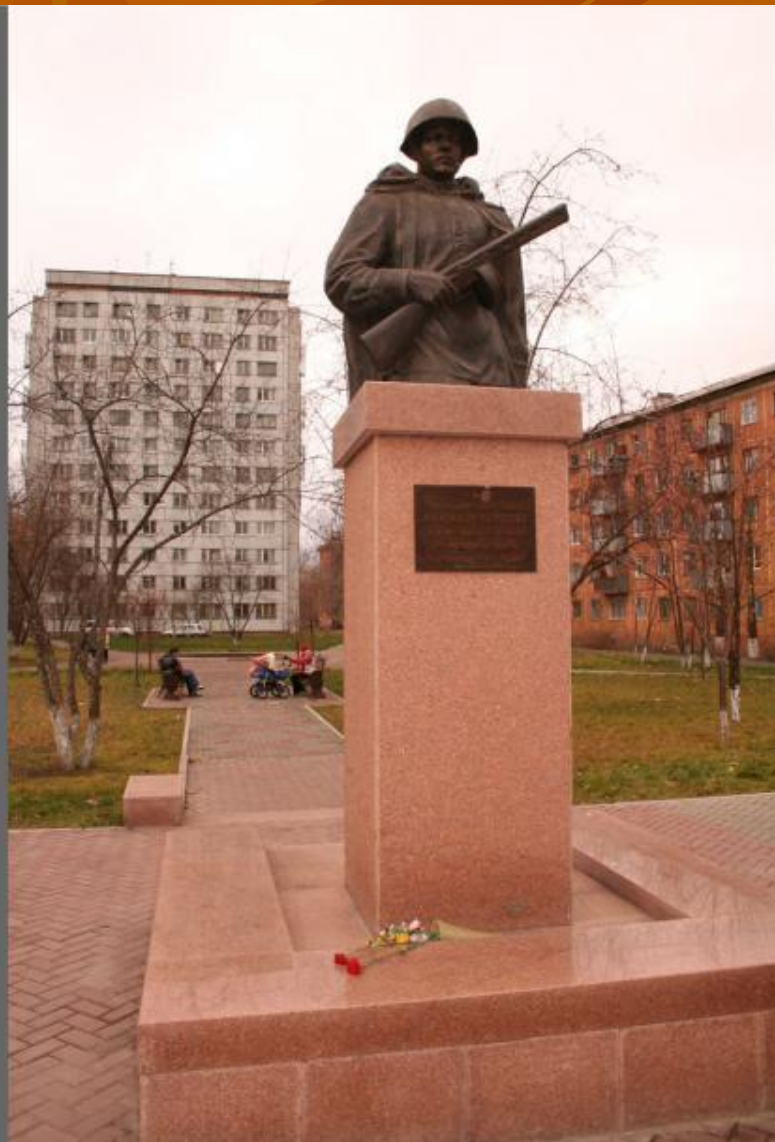
Герою СССР Александру Матросову.

На улицах города можно встретить памятники выдающимся людям России.