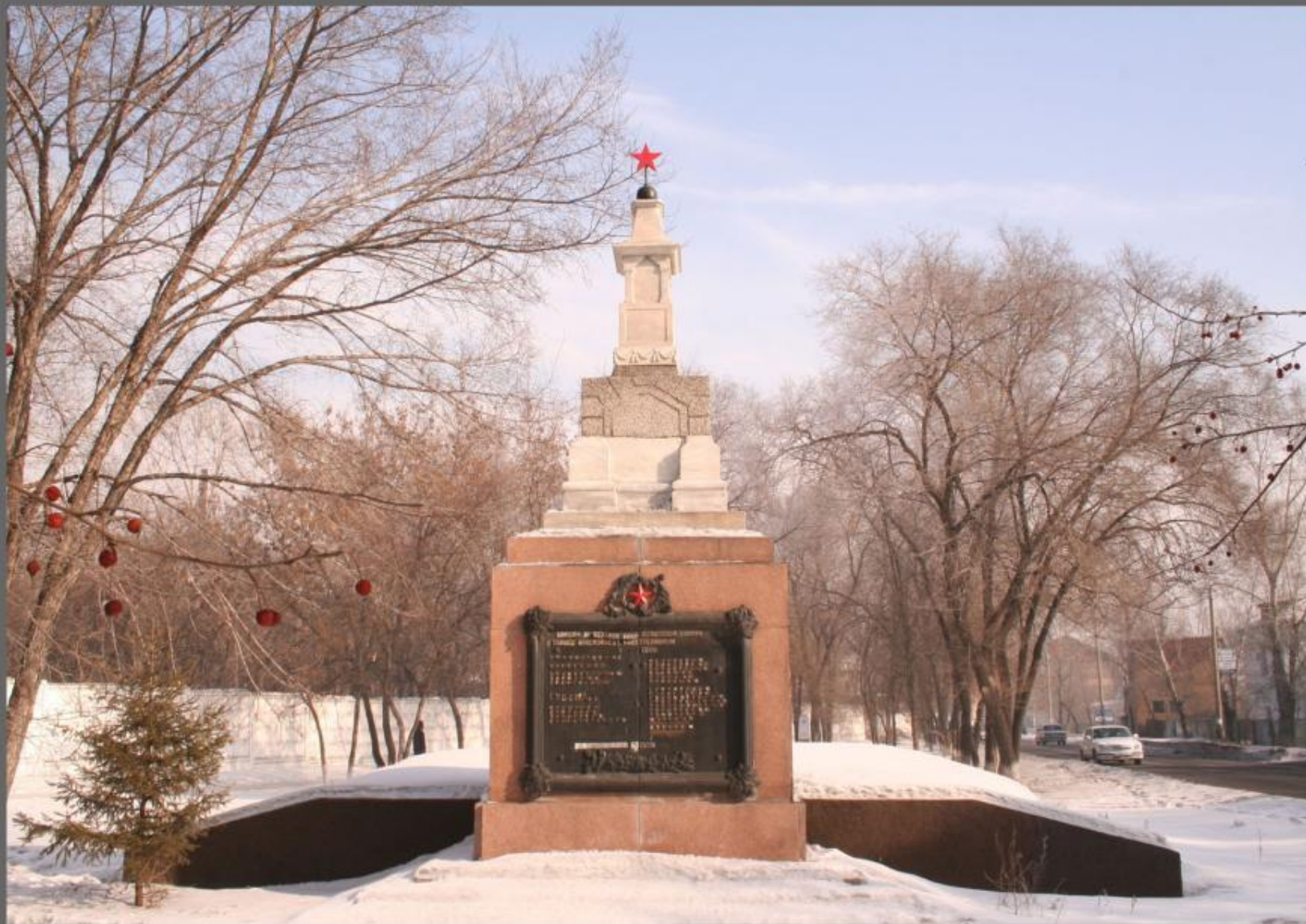
Борцам за установление Советской власти в г. Красноярске.