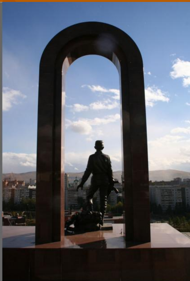
Мемориал Воинам -Интернационалистам