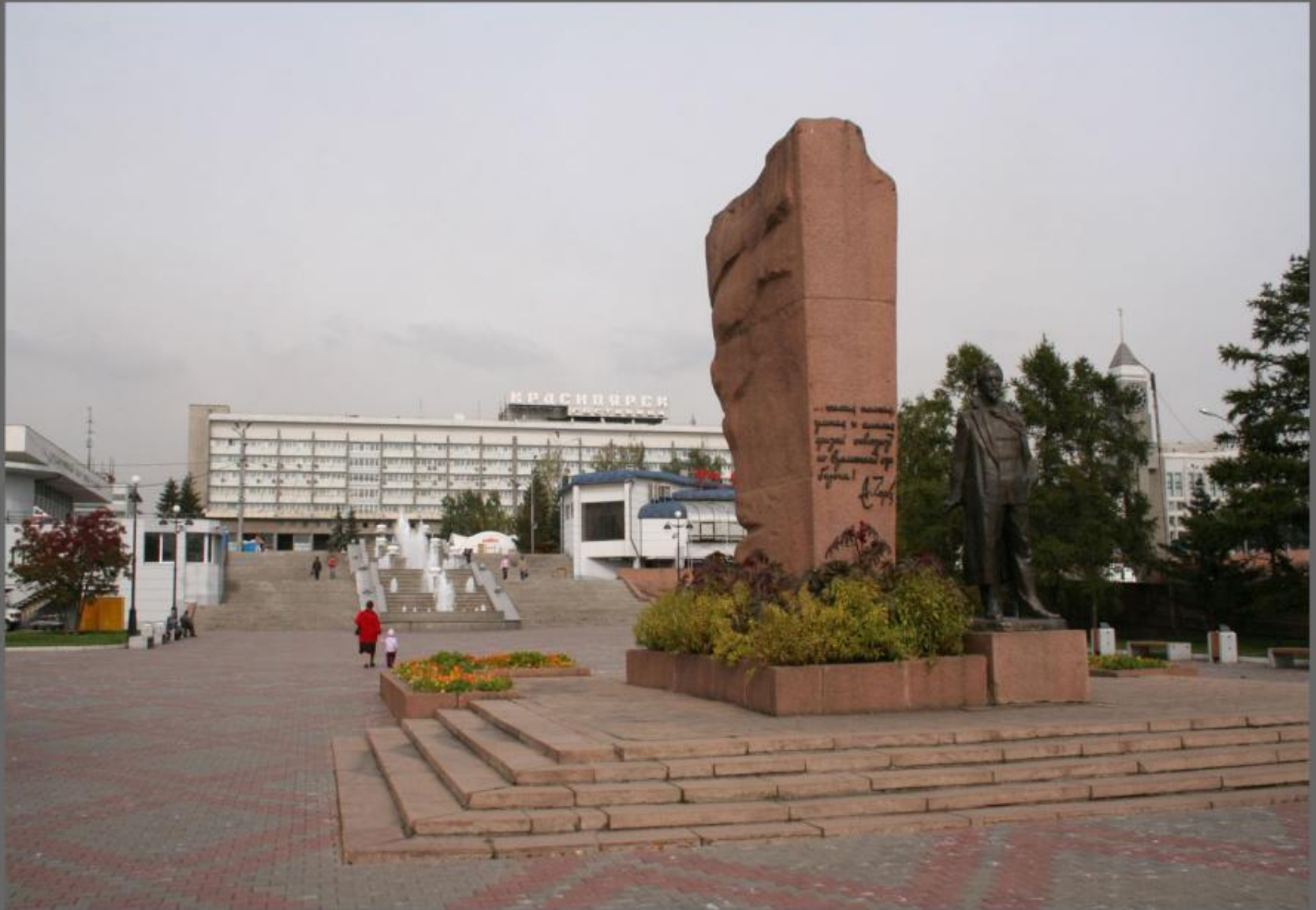
Памятник А. Чехову.