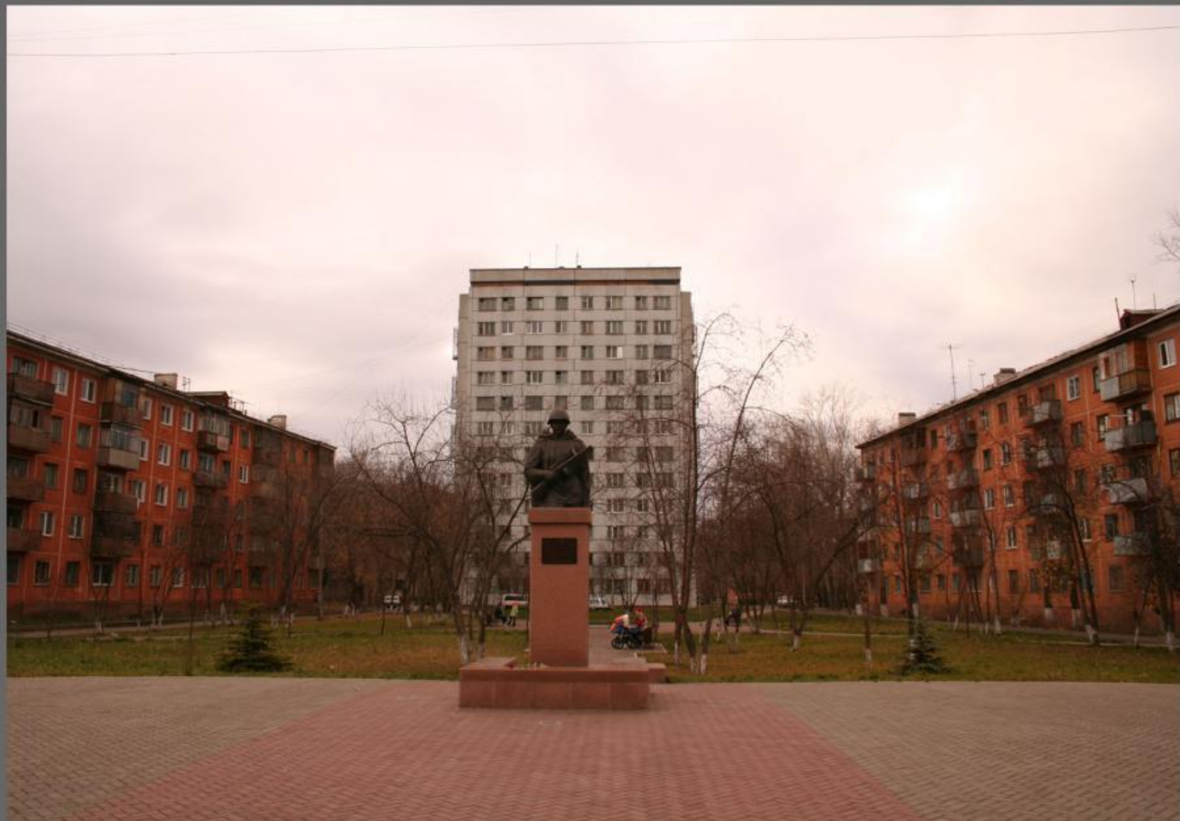
Герою СССР Александру Матросову.