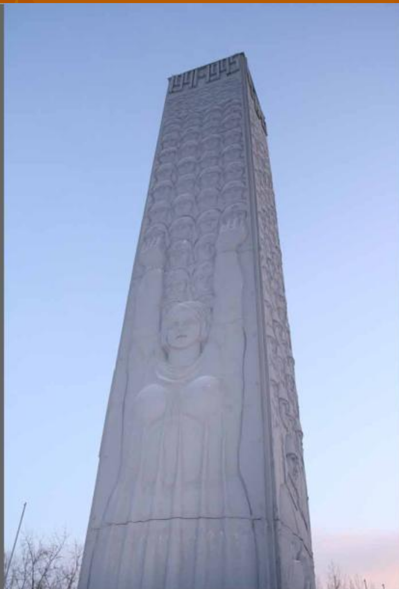
Обелиск в Парке Победы.