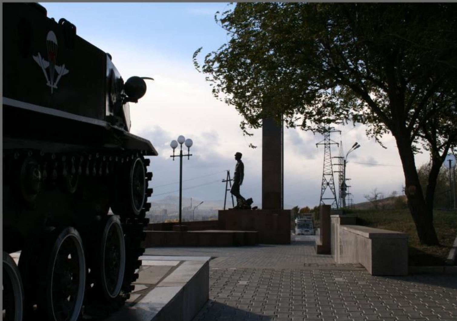
Мемориал Воинам -Интернационалистам.