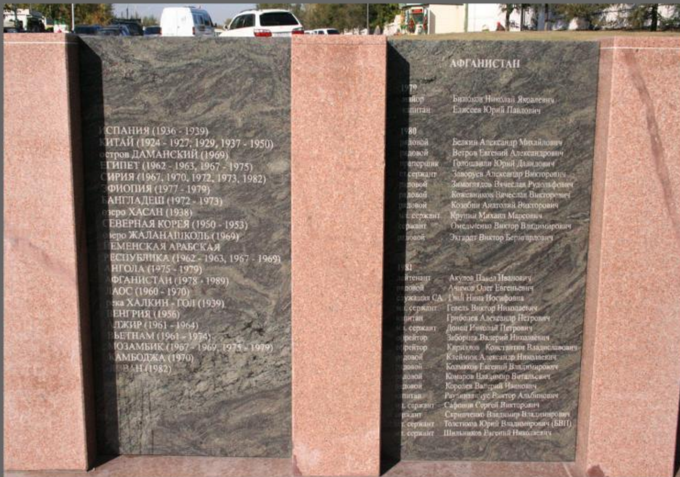
Мемориал Воинам -Интернационалистам.