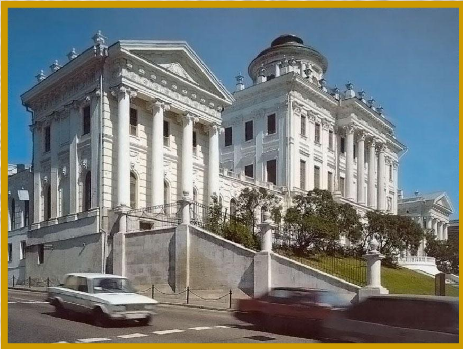
Дом Пашкова. XX век