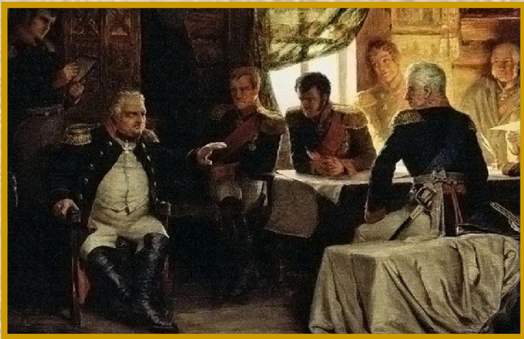
А.Д. Кившенко. Военный совет в Филях в 1812. 1882