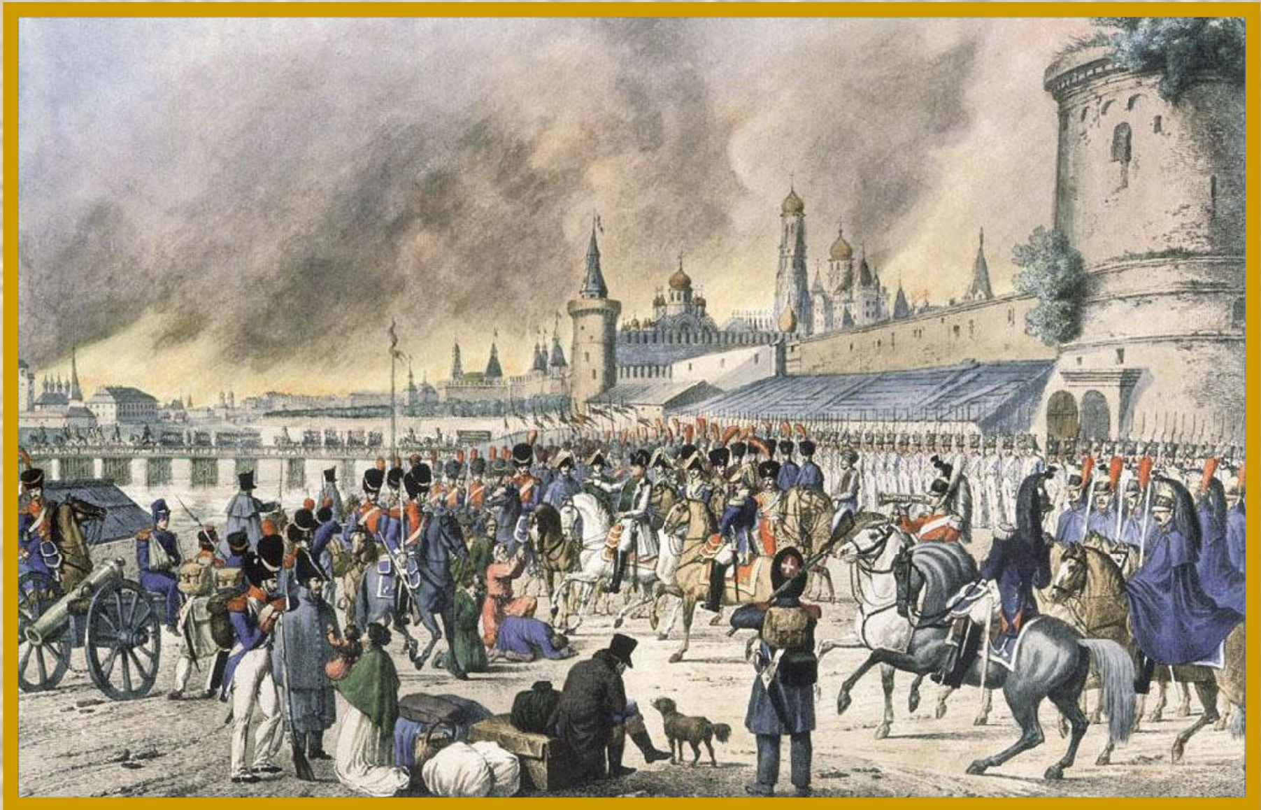
Неизвестный гравер. Пожар Москвы в 1812 году (по рисунку Ф. Габермана). 1810. Раскрашенная гравюра