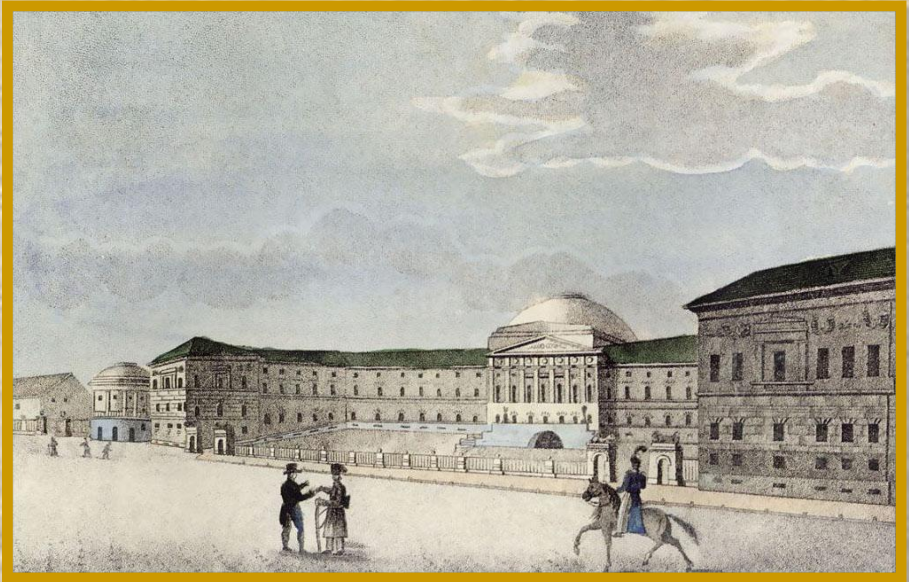
Московский университет. Раскрашенная литография неизвестного художника. 1820