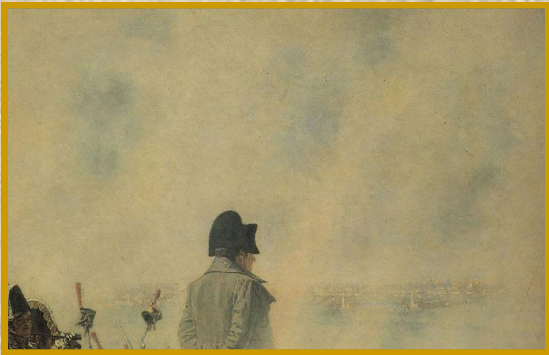
В.В. Верещагин. Перед Москвой в ожидании делегации бояр. 1891-1892