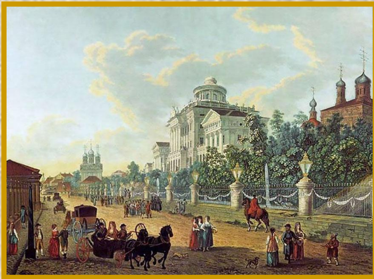
Дом Пашкова на Моховой улице. Конец XVIII века