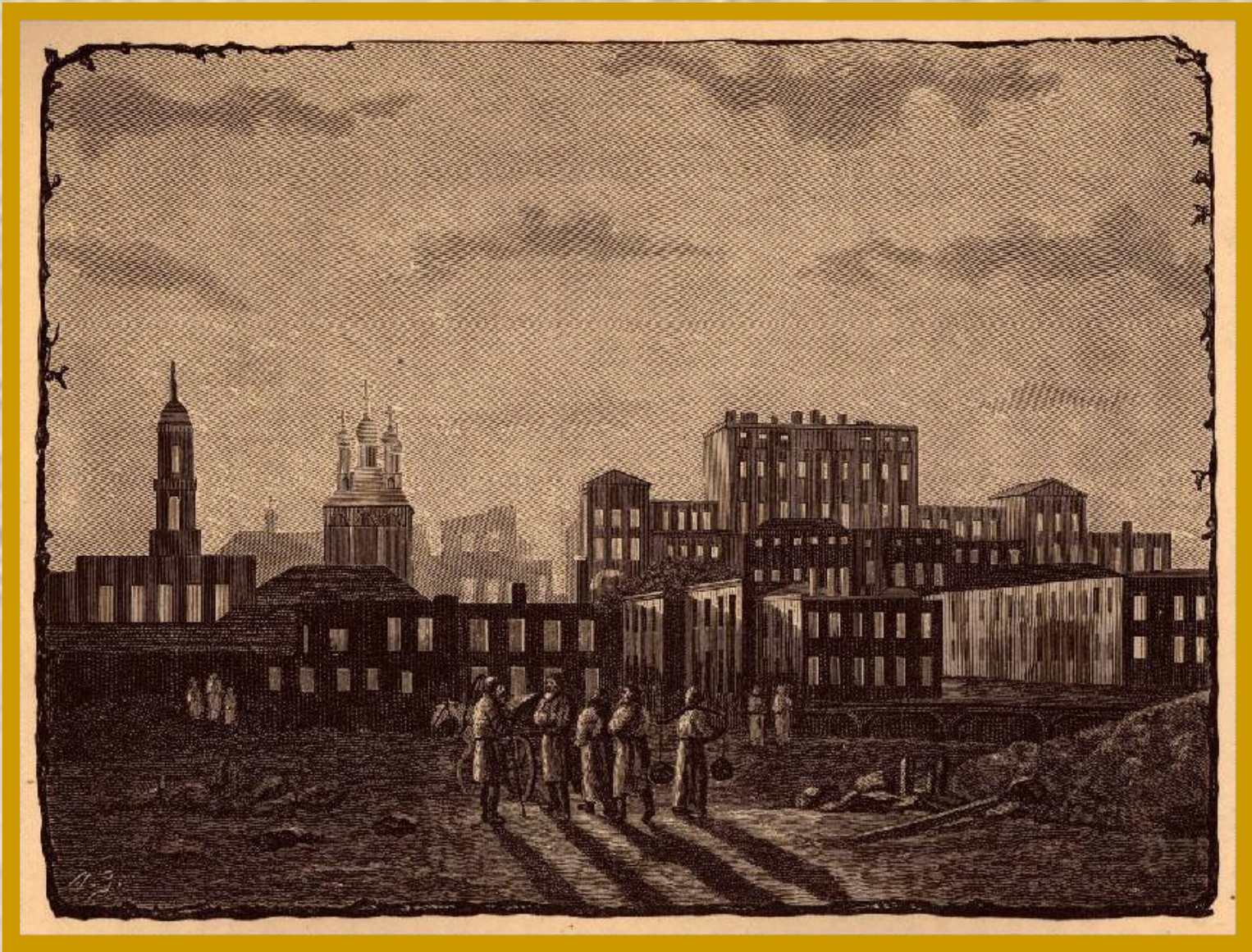
Дом Пашкова в Москве после пожара 1812 года. С гравюры того времени