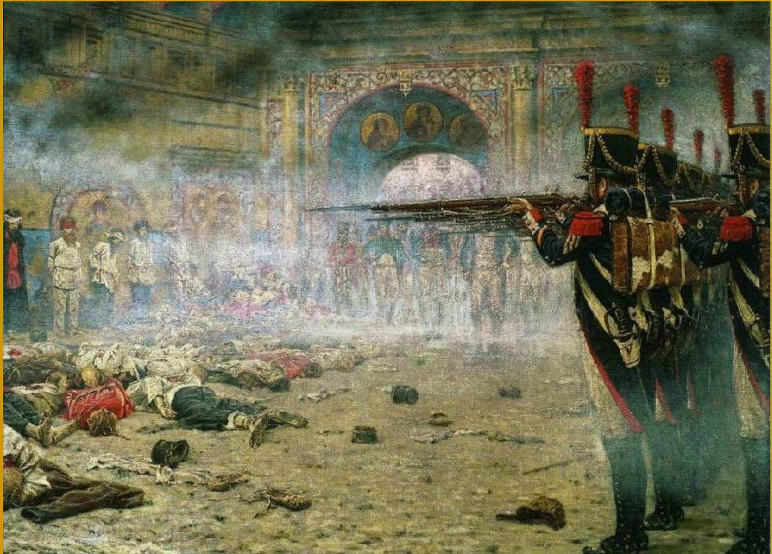
В.В. Верещагин. В покоренной Москве (Поджигатели или Расстрел в Кремле). 1897-1898