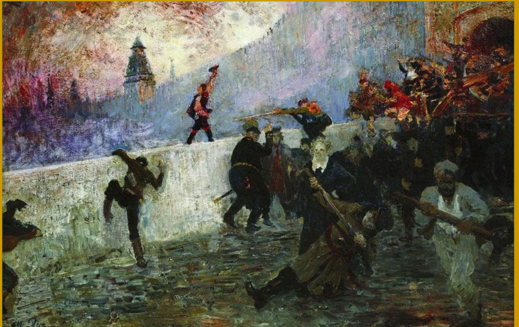
И.Е.Репин. В осажденной Москве в 1812 году. 1912