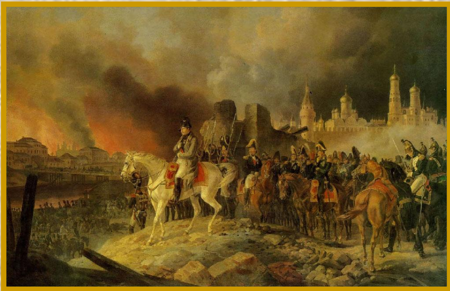
А. Адам. Наполеон в горящей Москве. 1840