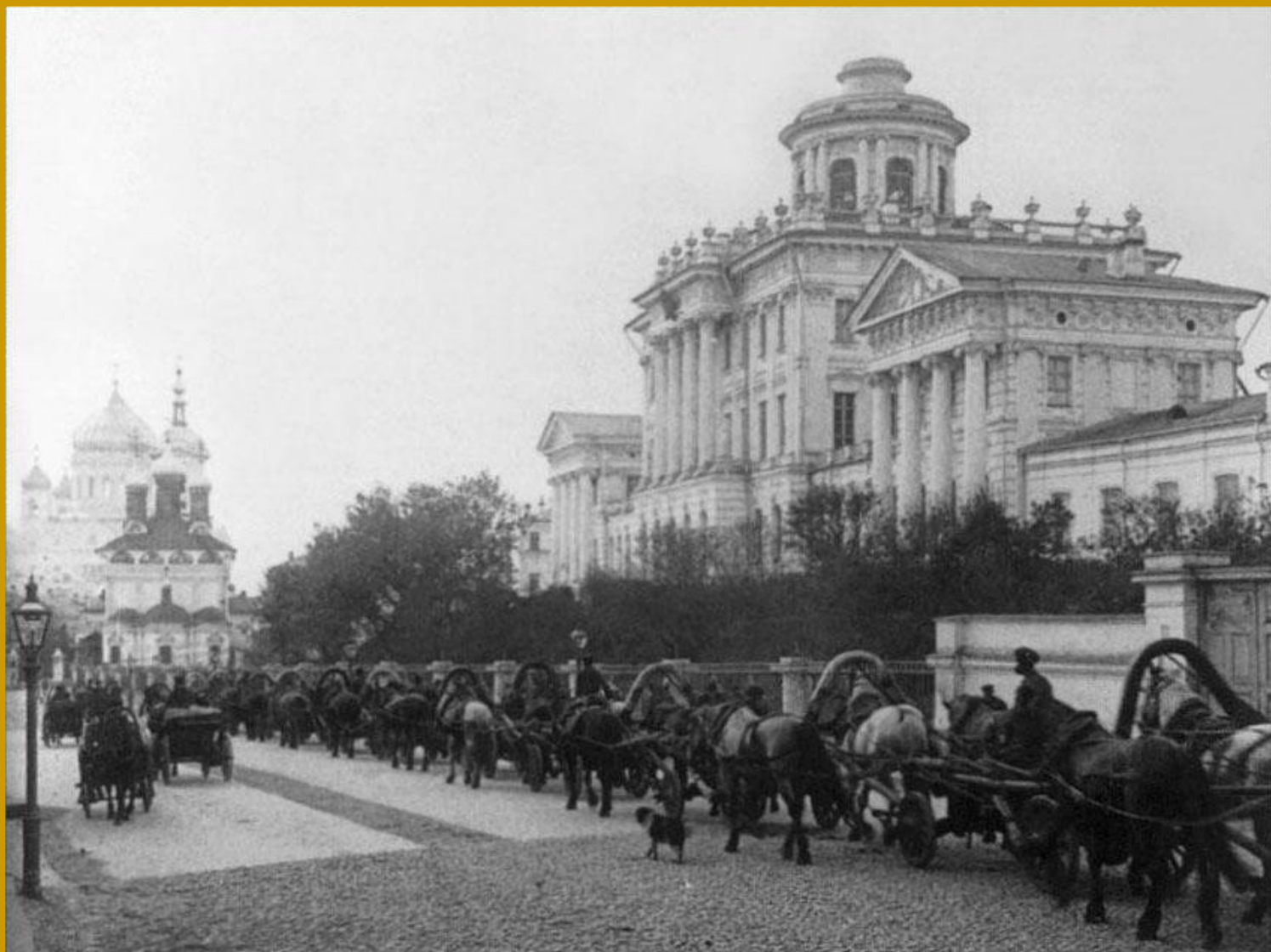
Дом Пашкова. Конец XIX века