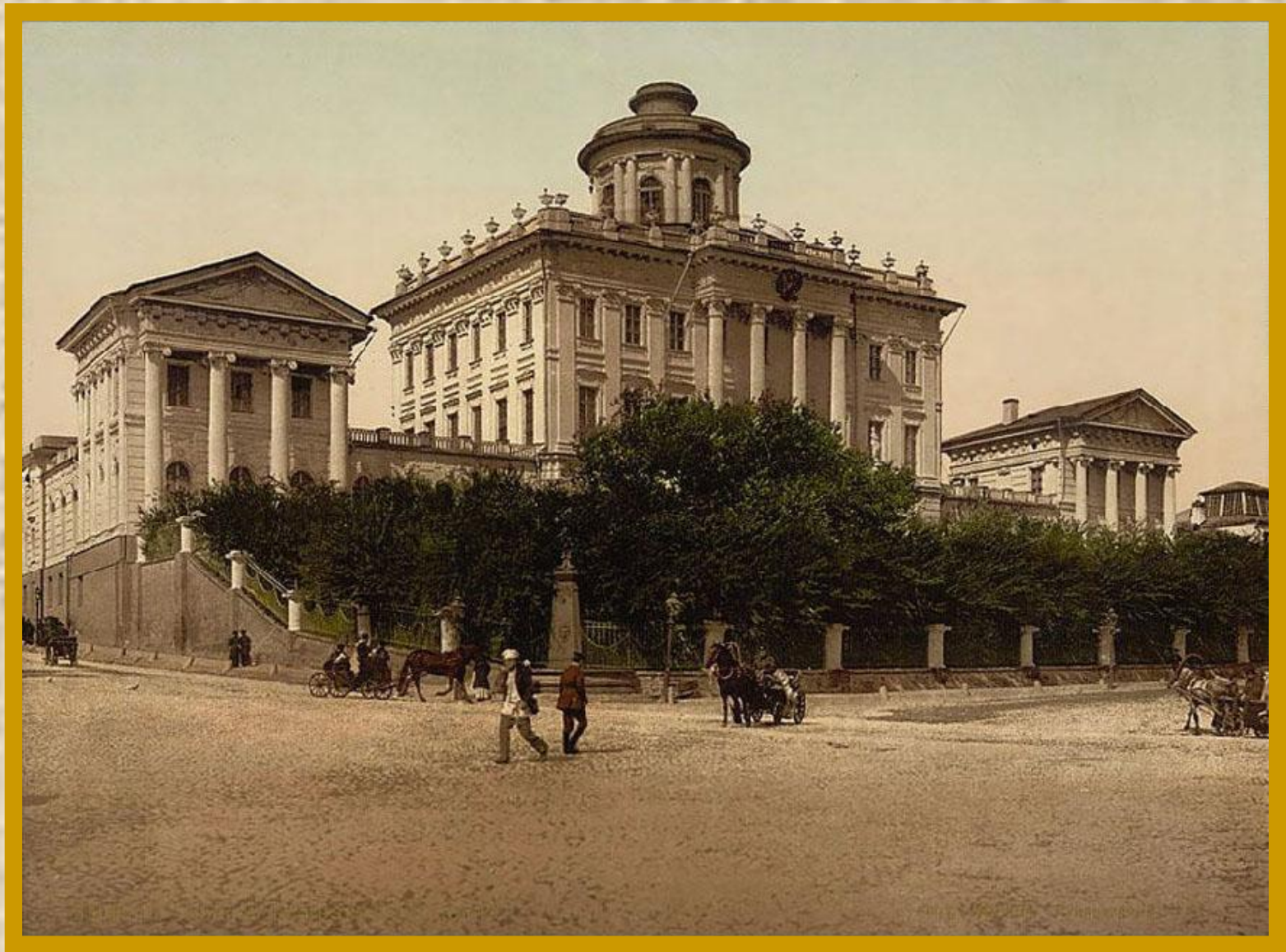
Дом Пашкова. Москва. Фотография конца XIX века