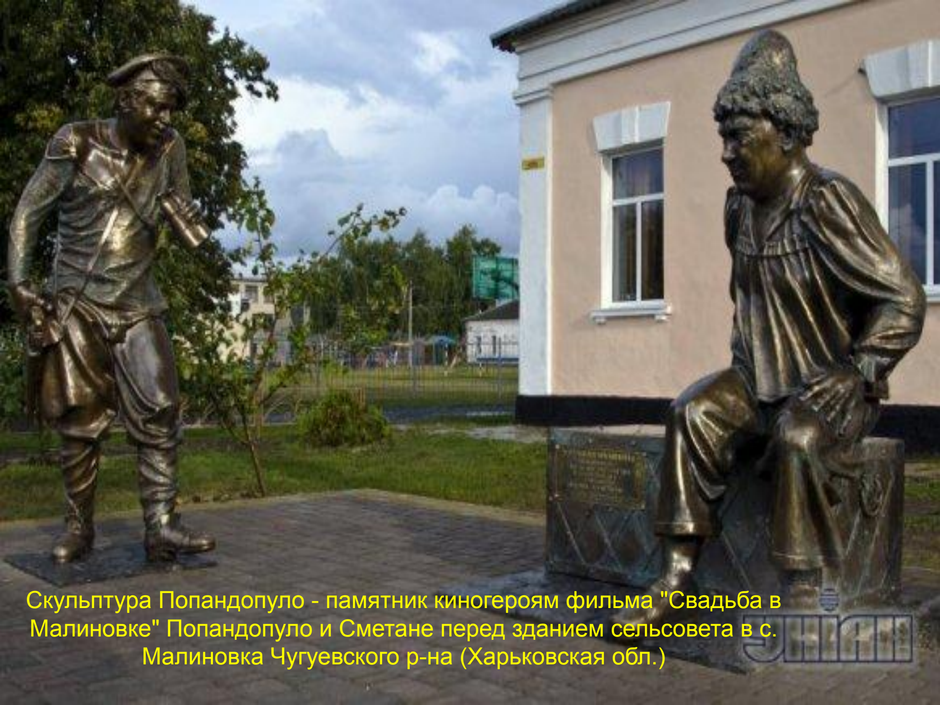
Скульптура Попандопуло - памятник киногероям фильма "Свадьба в Малиновке" Попандопуло и Сметане перед зданием сельсовета в с. Малиновка Чугуевского р-на (Харьковская обл.)