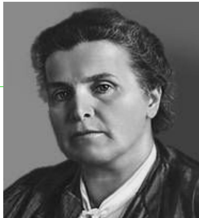
В. И. Мухина