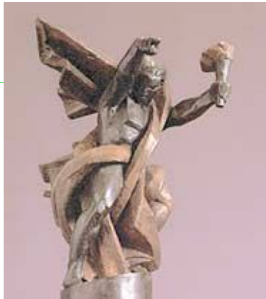
« Пламя революции» (1922- 23, гипс Музей революции, Москва)