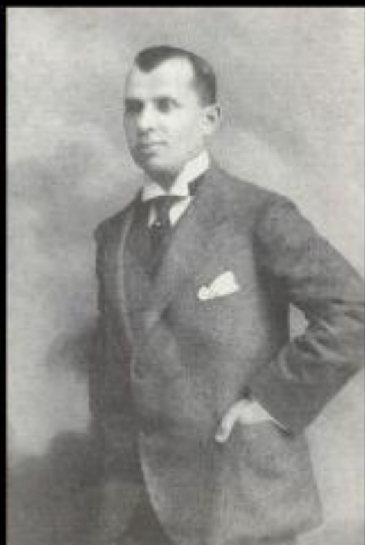
Леонид Александрович Сенько-Поповский, Черноморский вице- губернатор, основатель музея.

Музей в Новороссийске был создан в 1916 году по инициативе Черноморского вице-губернатора Л.А. Сенько-Поповского, как Музей Природы и Истории Черно-морского Побережья Кавказа. В основу его фондов легли предметы старины, хранившиеся в городской публичной библиотеке с 1894 г. и коллекции по палеонтологии и геологии первого хранителя музея Г.Н. Сорохтина.